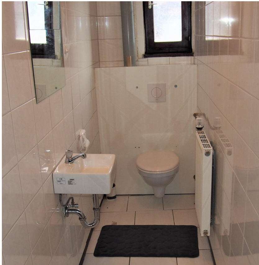
Gäste-WC im OG