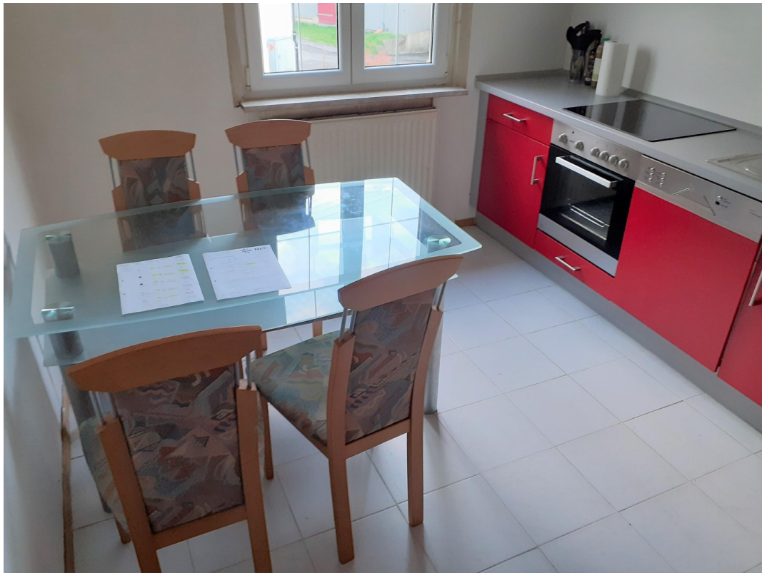
Küche mit EBK und Essplatz