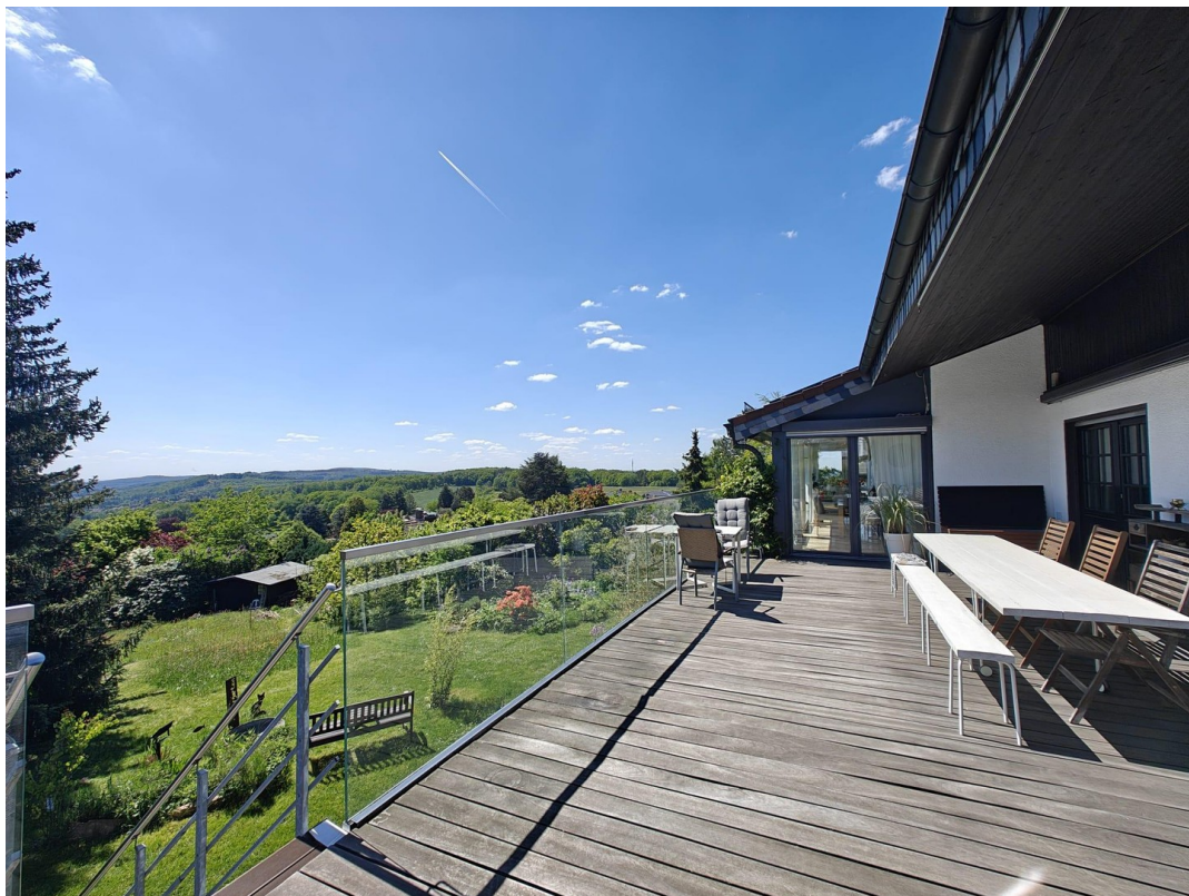
55m 2 Panoramaterrasse