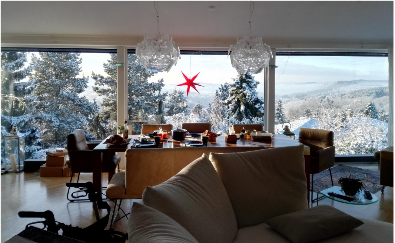
Frühstück mit Weitblick