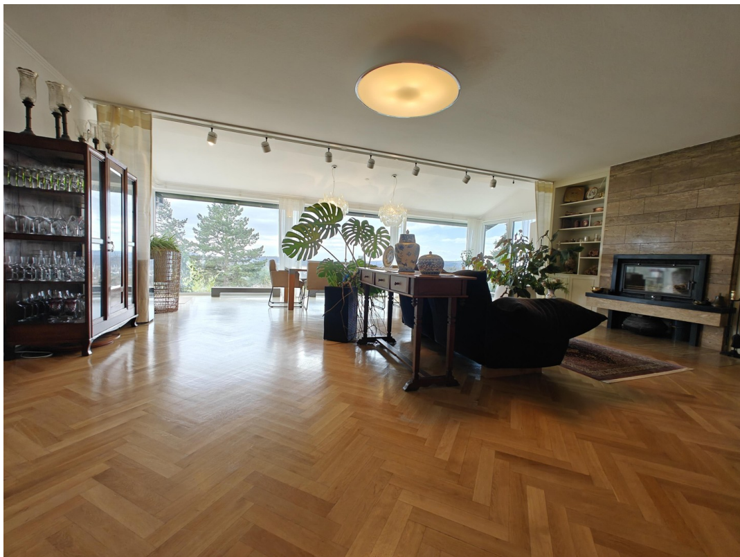
Großes Wohnzimmer mit Aussicht