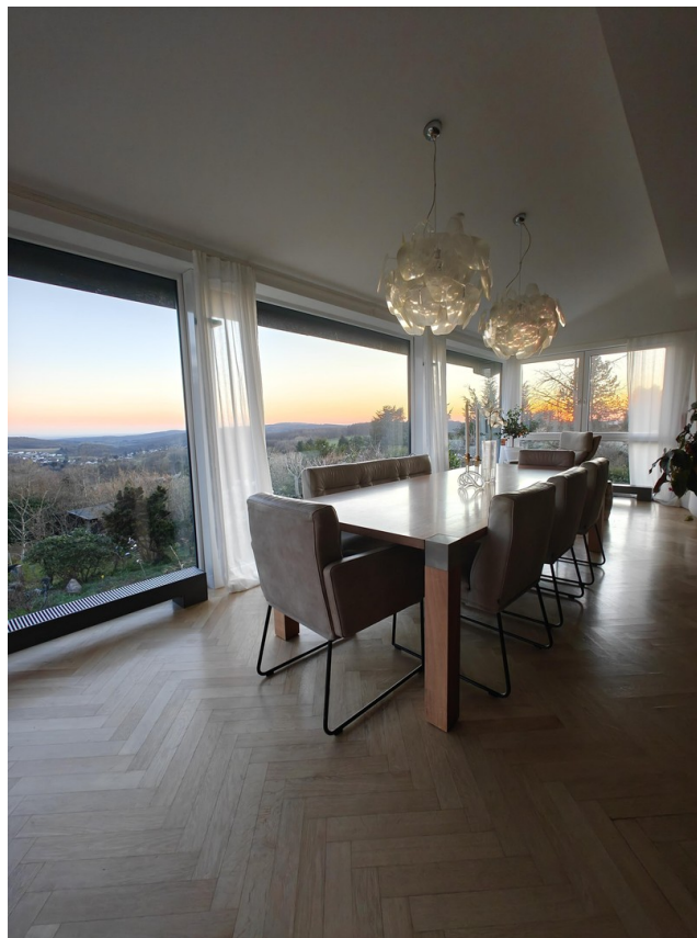
Essen mit Panorama