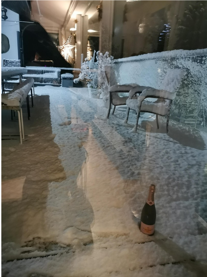
und Silvester auf der Terrasse