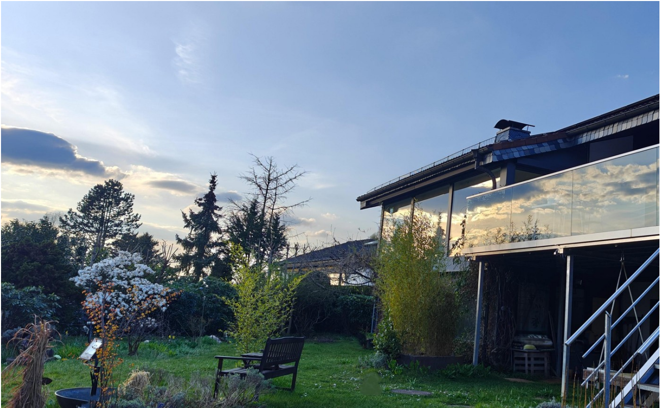
Südterrasse mit Glasgeländer