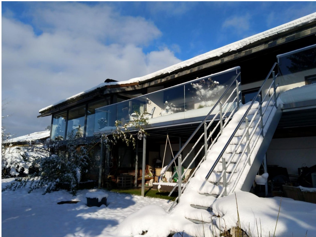
Südansicht im Winter