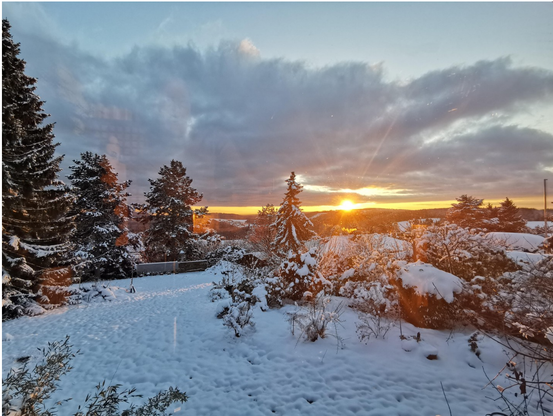
Ihr privates Winterpanorama