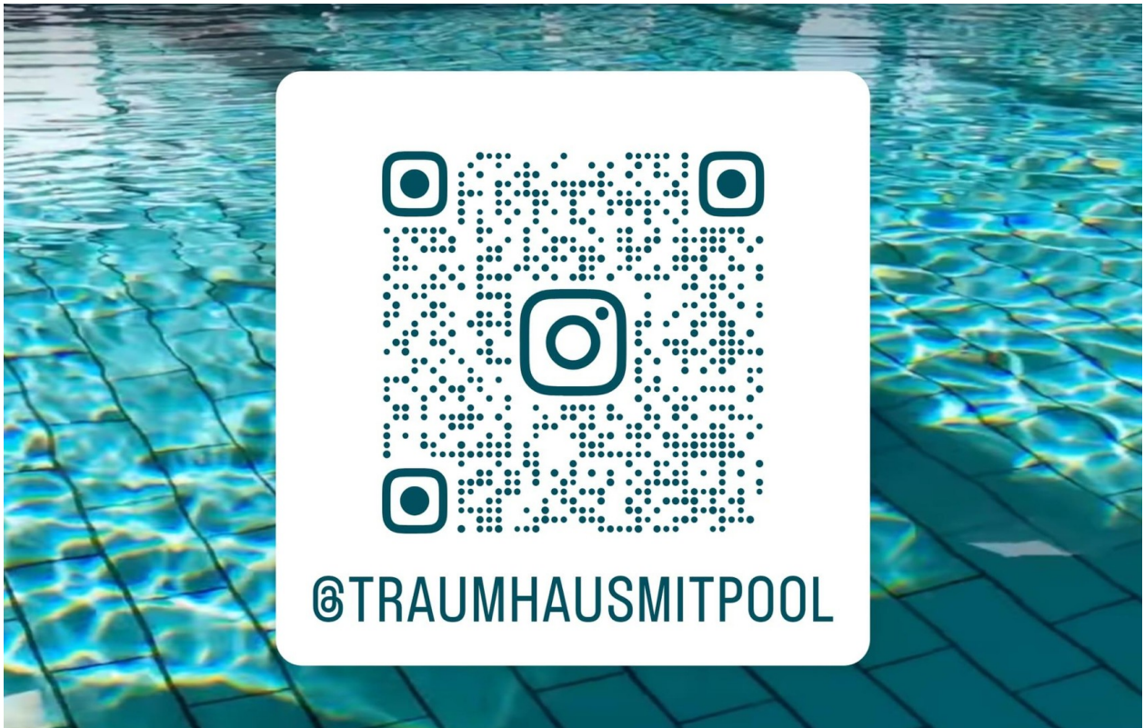
Scannen für mehr Einblicke