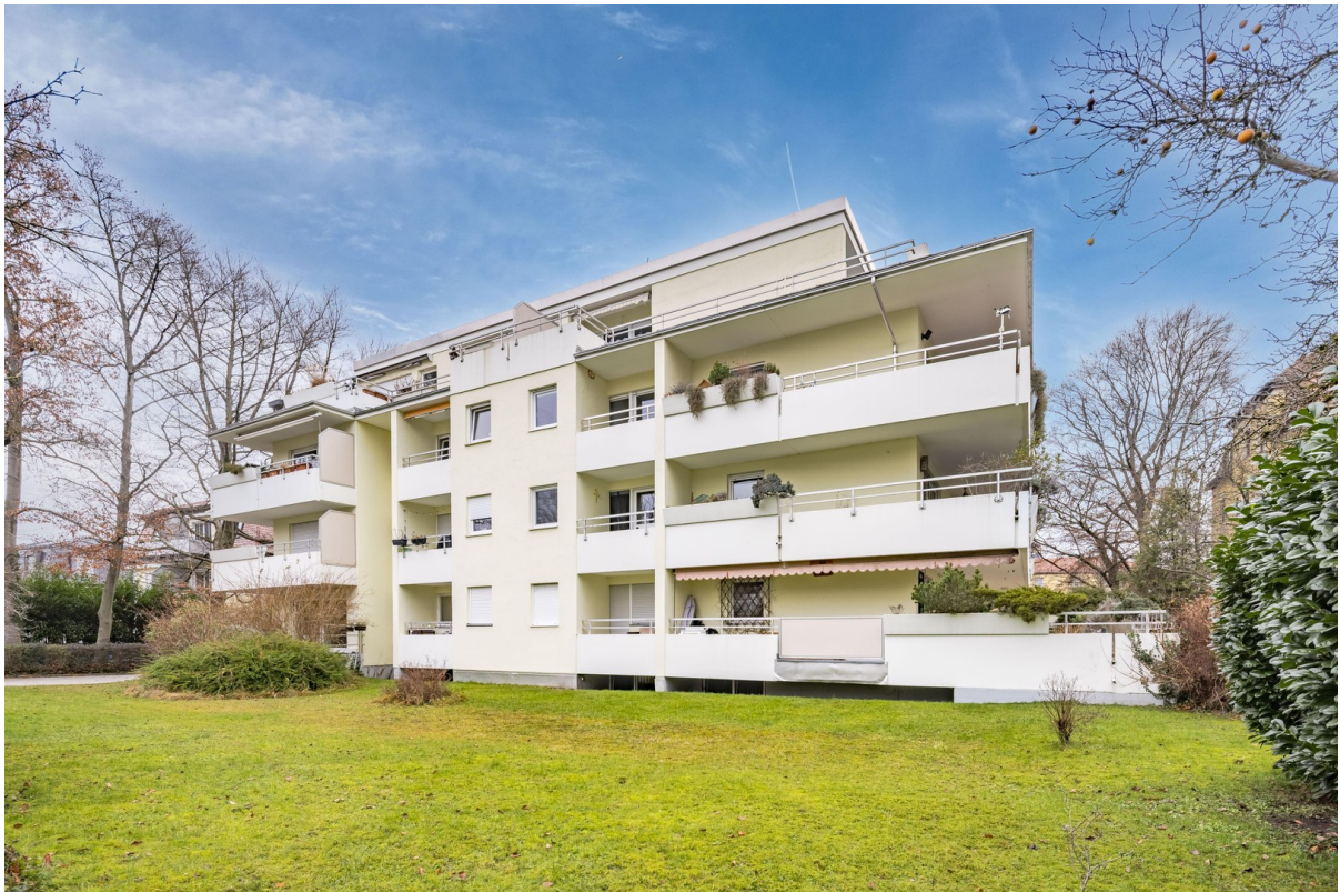
Blick vom Garten auf ETW