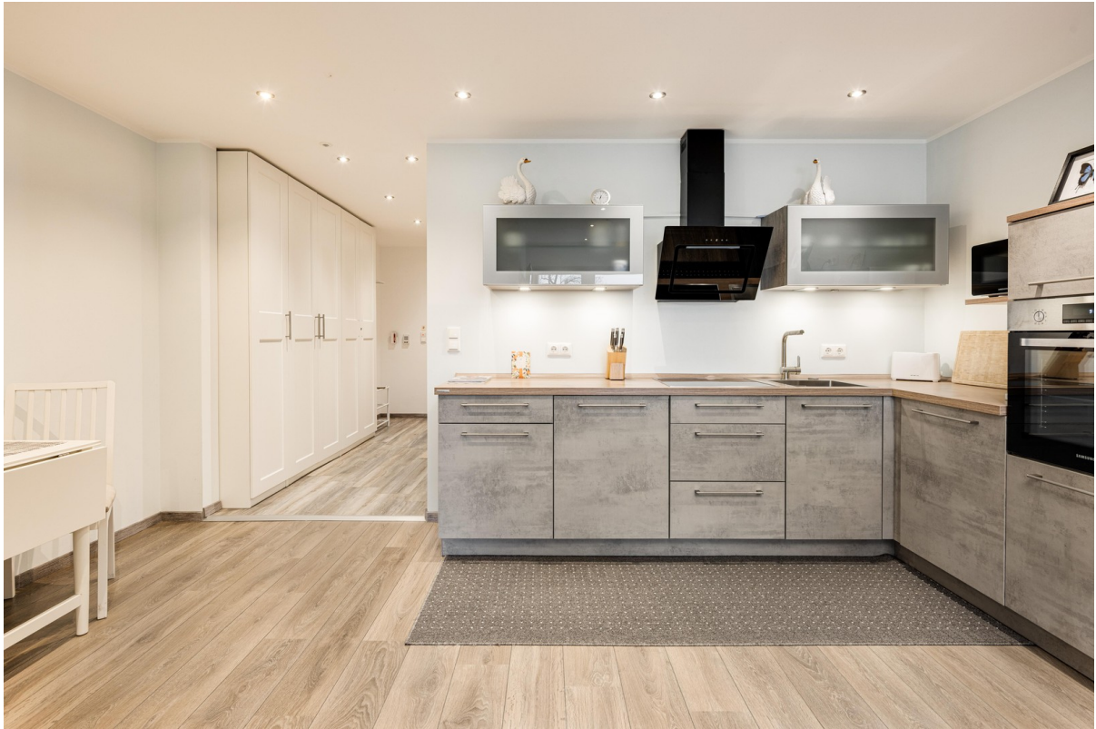
Küchenbereich und Flur