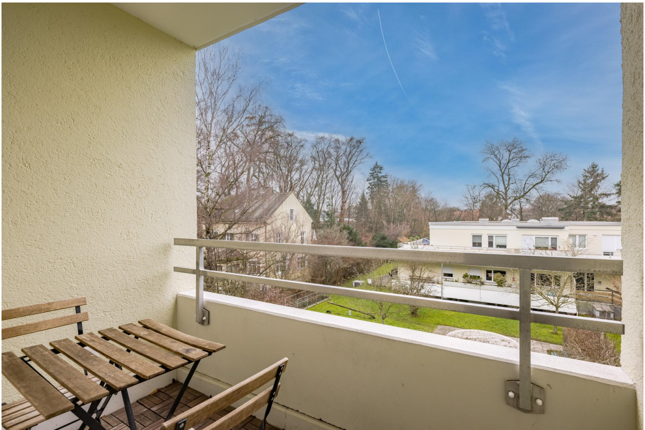
Ausblick vom Balkon