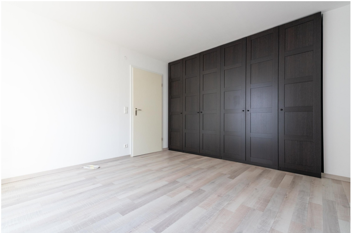
Schlafzimmer mit Einbauschränk