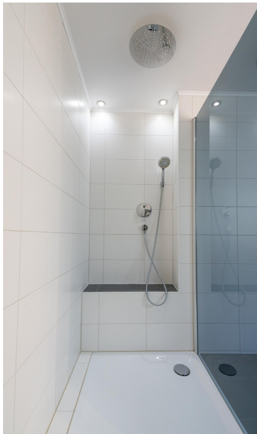
Bad - Dusche