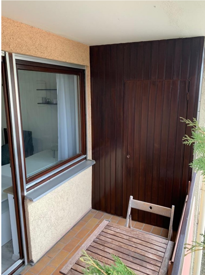
Abstellraum auf Balkon