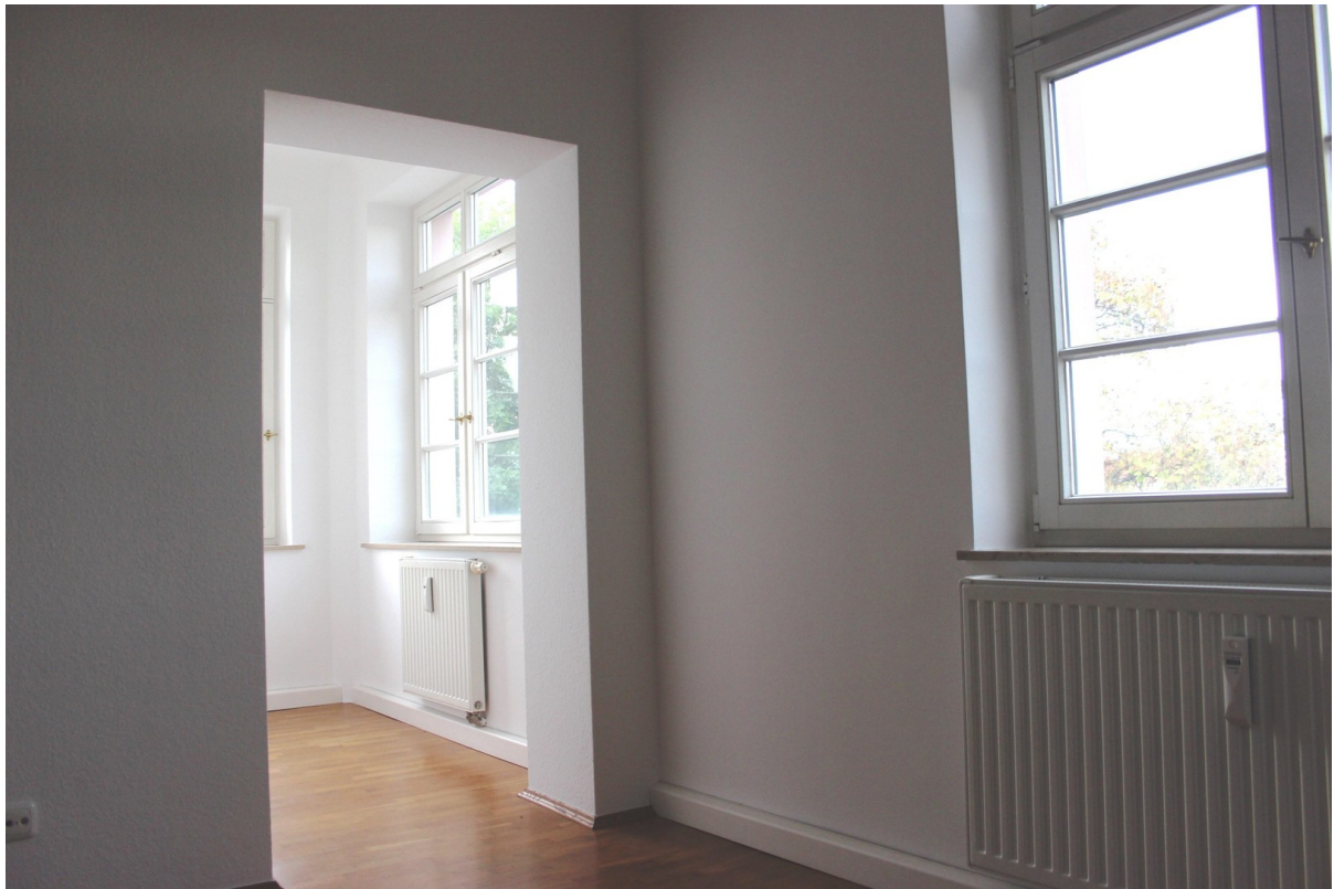
Wohnzimmer mit kleinem Erker