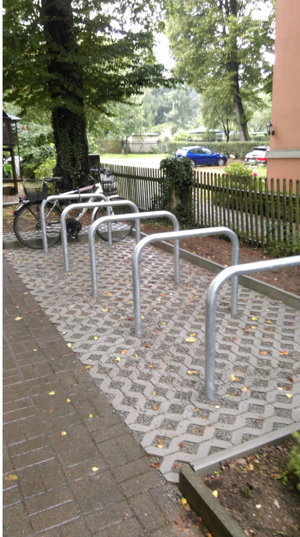
Für Fahrräder bestens geeignet