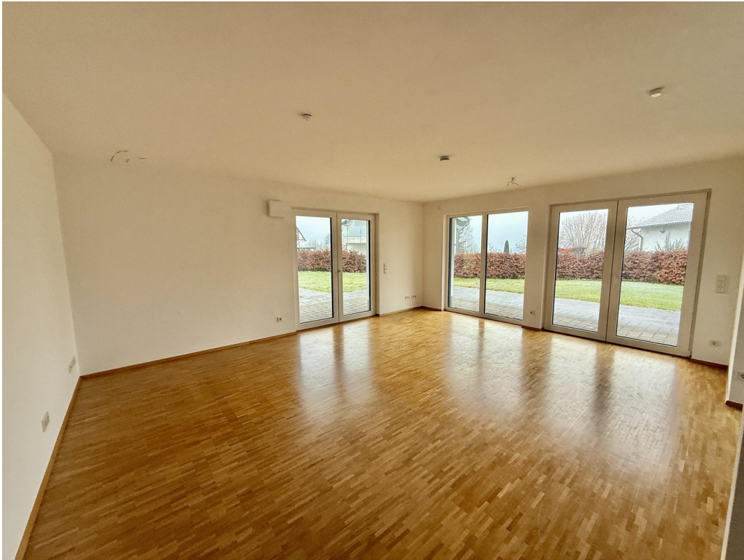
Wohnen mit Austritt