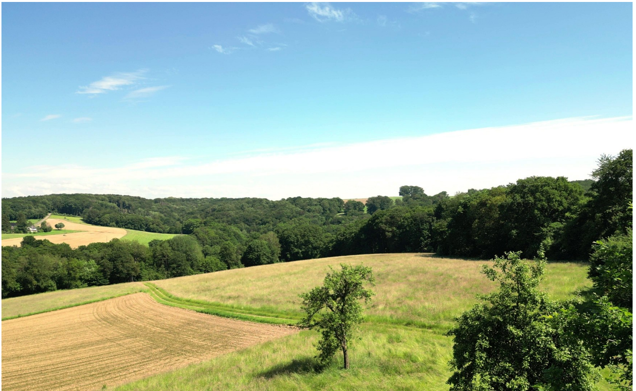
Wohnen in der Natur