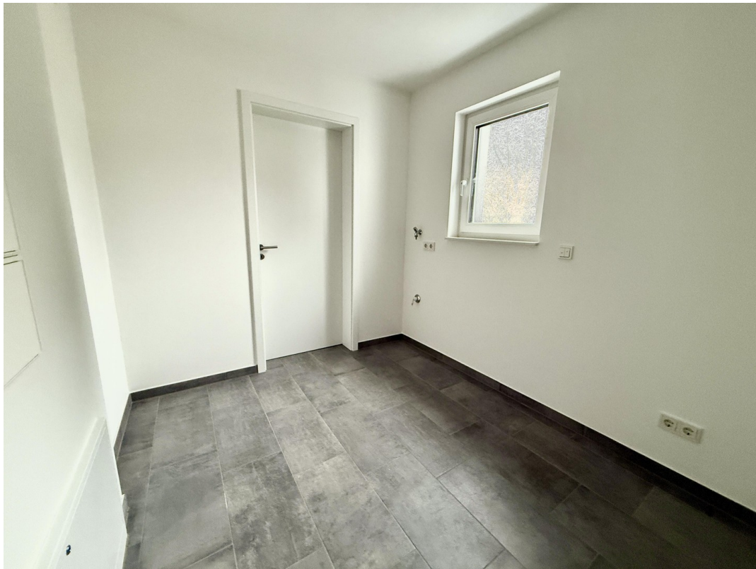
Abstellraum mit Fenster