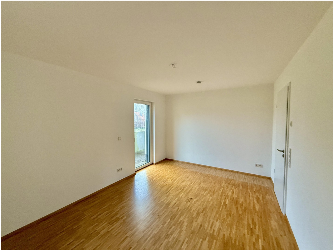
Schlafzimmer mit Austritt