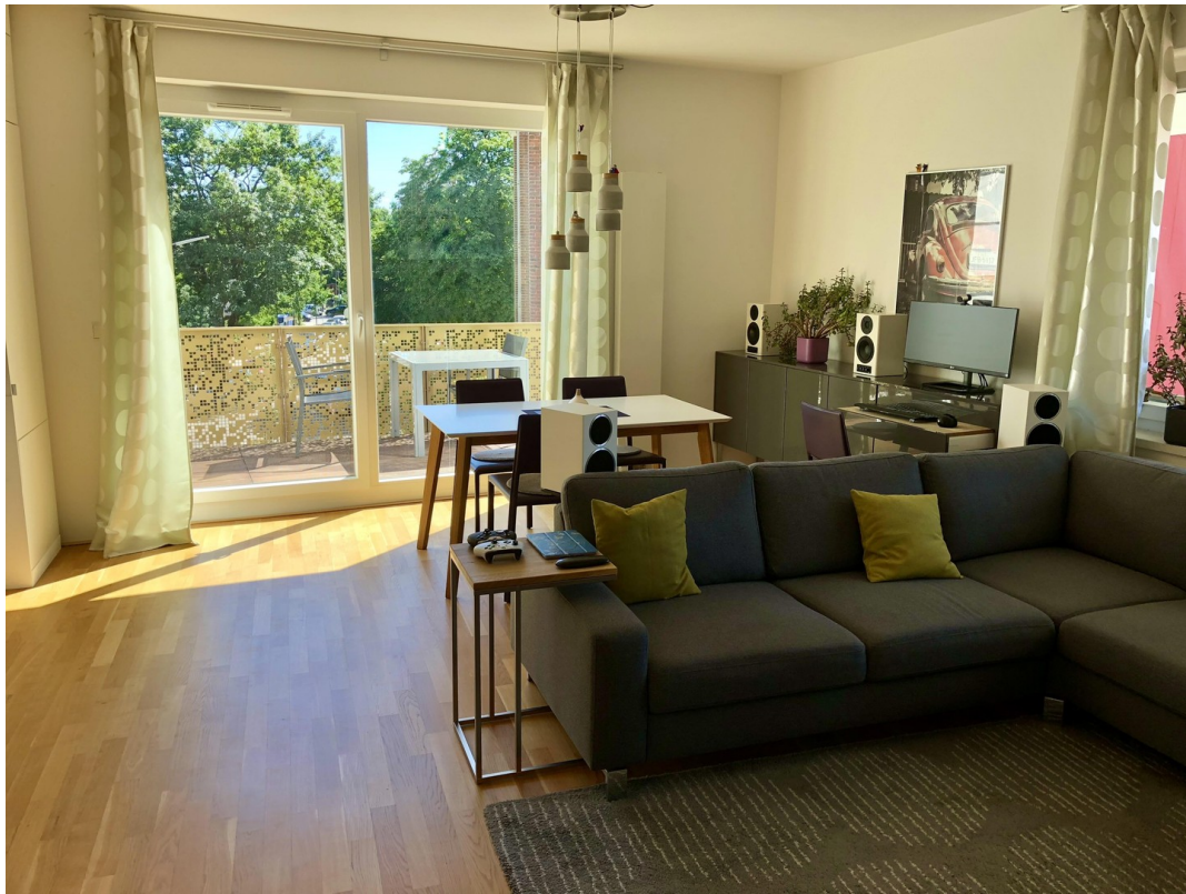
Wohnzimmer - Sommerblick