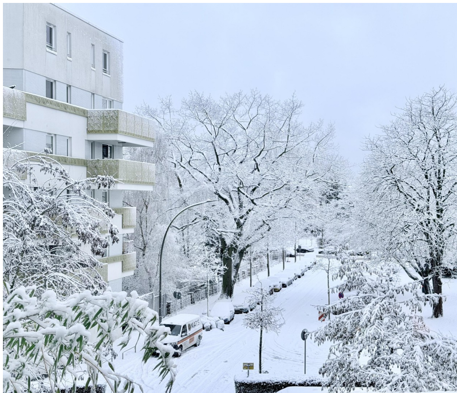
Wohnzimmer - Winterblick