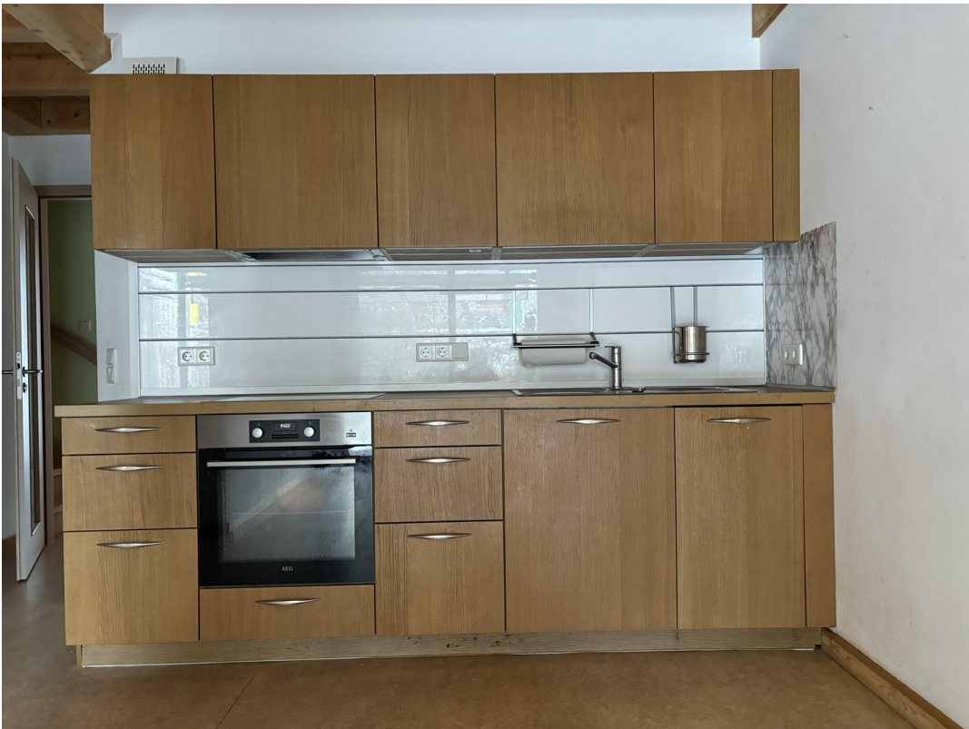
Kueche im Wohnzimmer