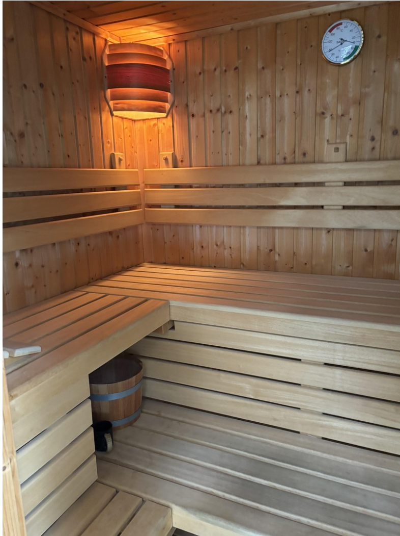
Sauna im Garten