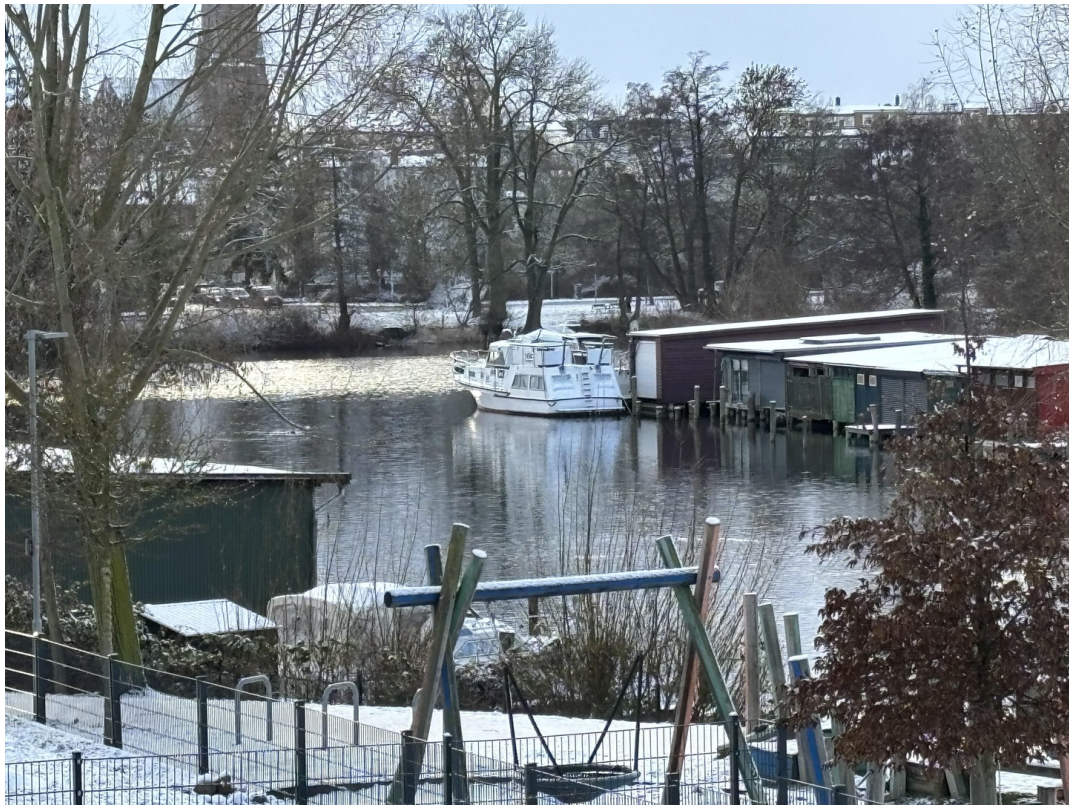
Seeblick vom Balkon