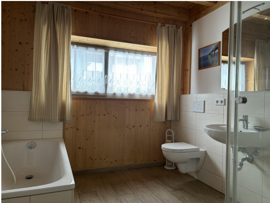
Bad - unten