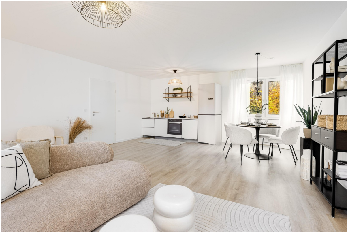
Wohnzimmer Bild 2