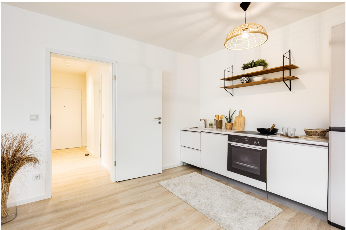
Offene Küche Bild 1