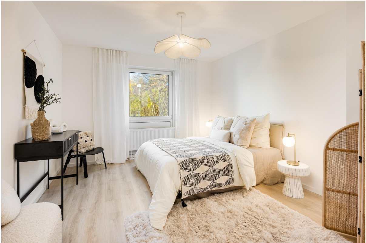
Schlafzimmer Bild 1