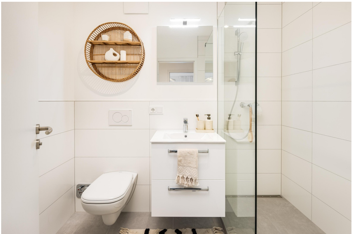
Badezimmer Bild 1