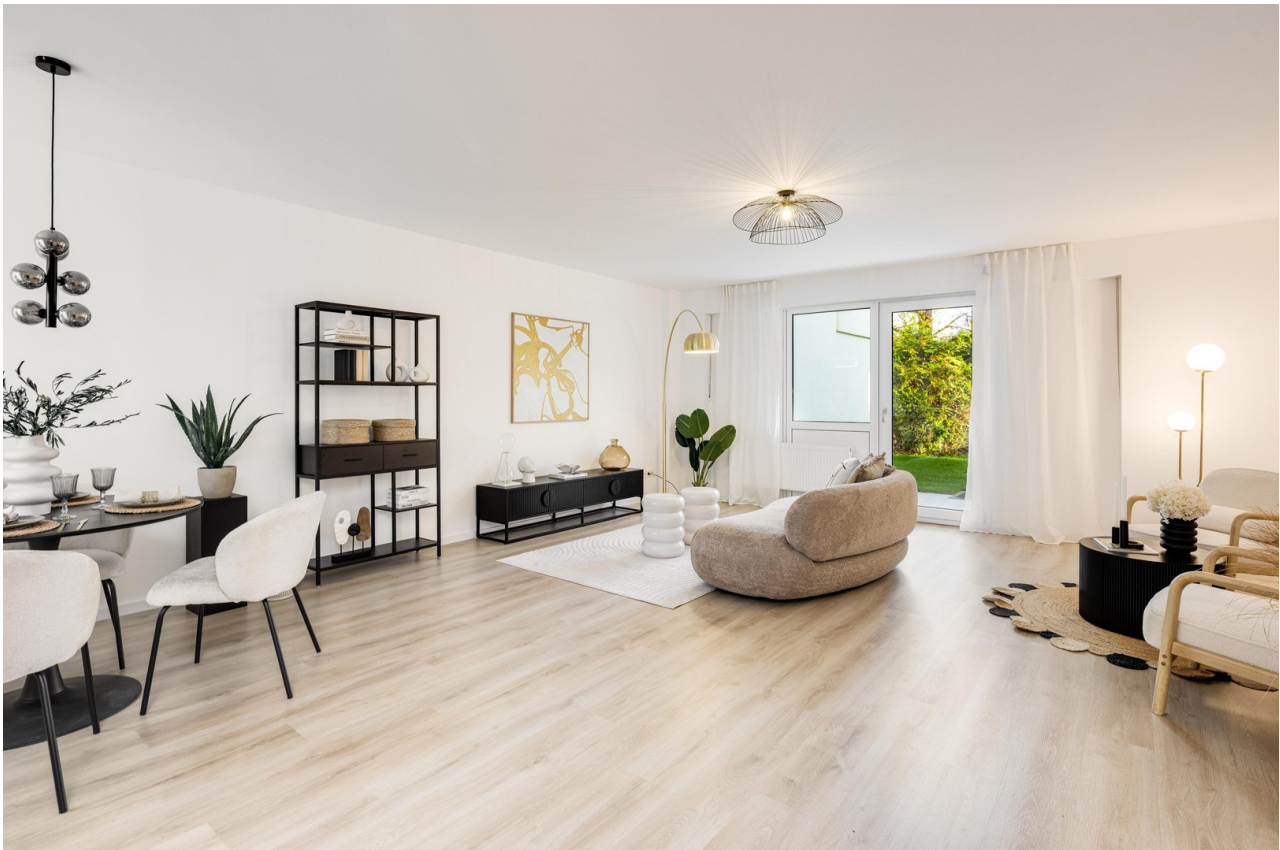
Wohnzimmer Bild 1