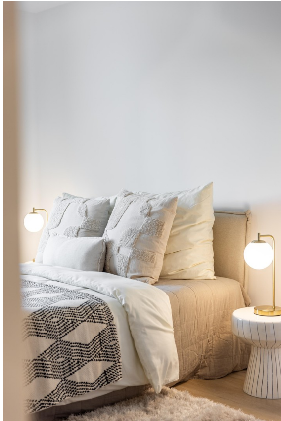
Detailbild 1 Schlafzimmer