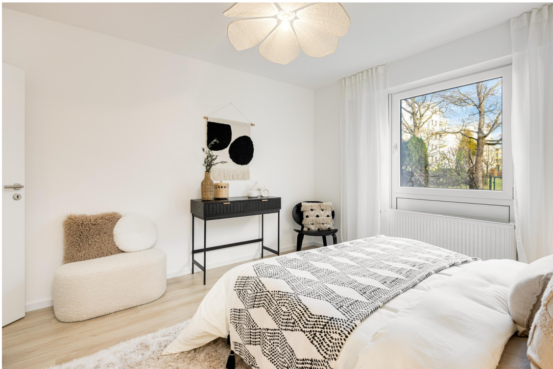
Schlafzimmer Bild 2