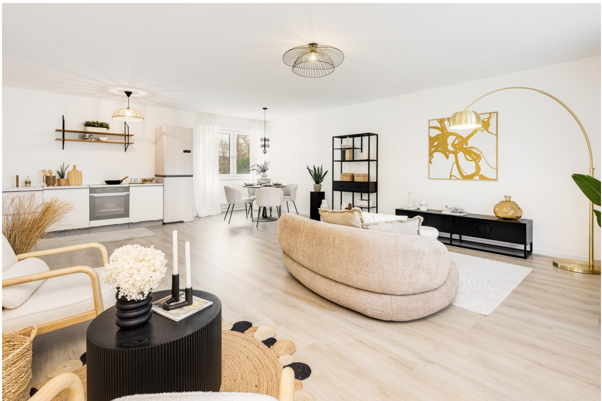
Wohnzimmer Bild 3