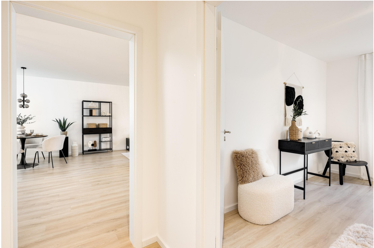
Wohnzimmer / Schlafzimmer