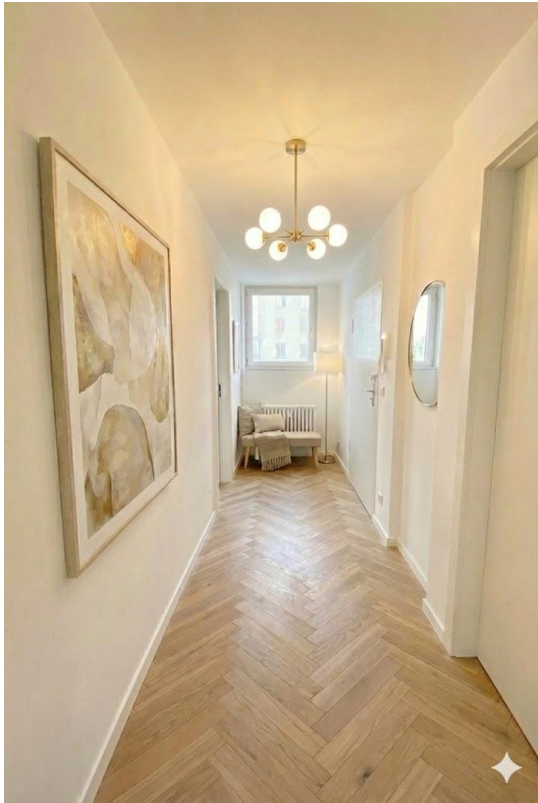
Flur Beispiel Möblierung