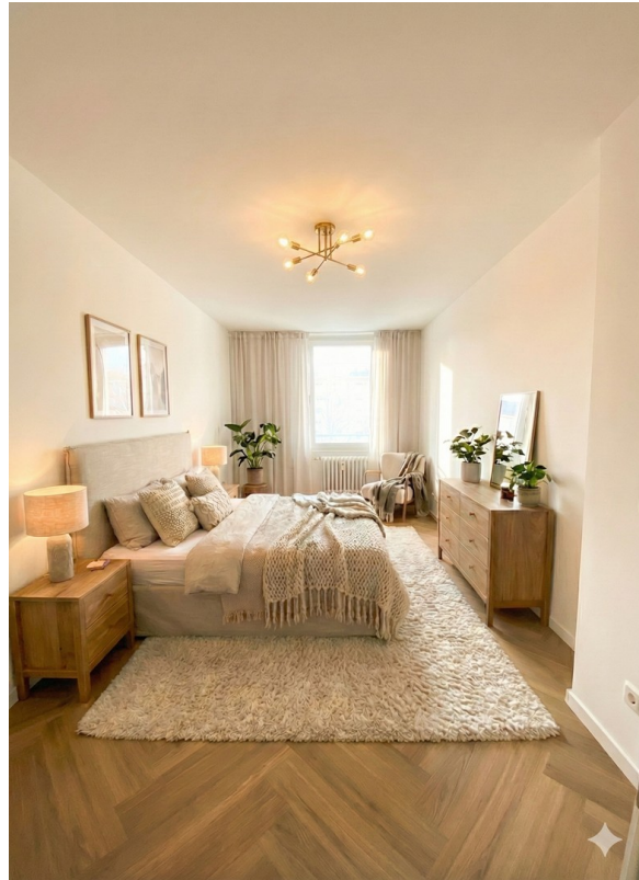
Schlafzimmer Beispiel Möbel