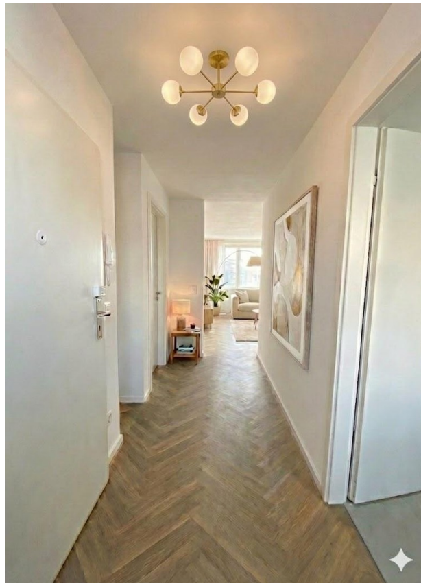
Flur Beispiel Möblierung