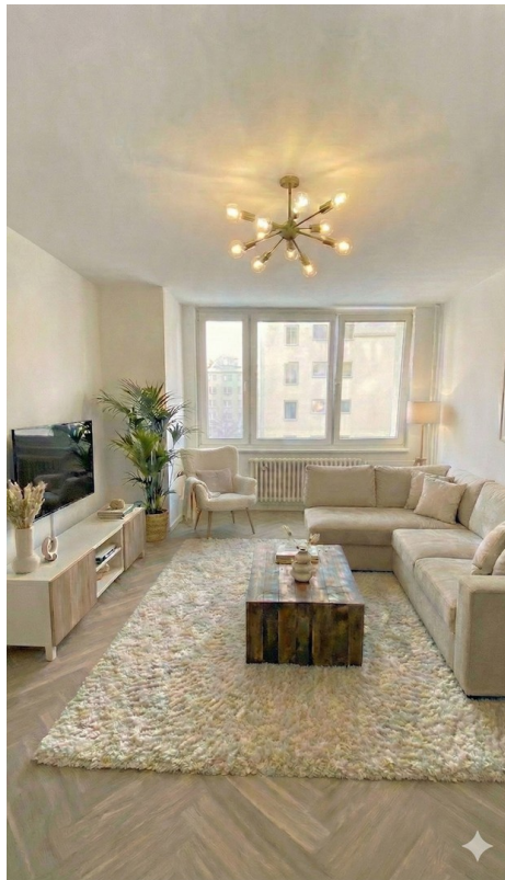
Wohnzimmer Beispiel Möblierung