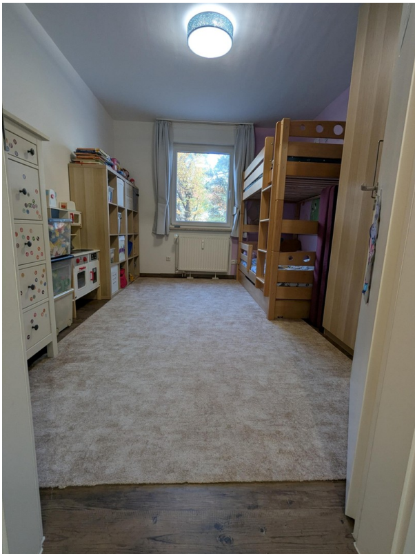
Kinder- / Arbeitszimmer