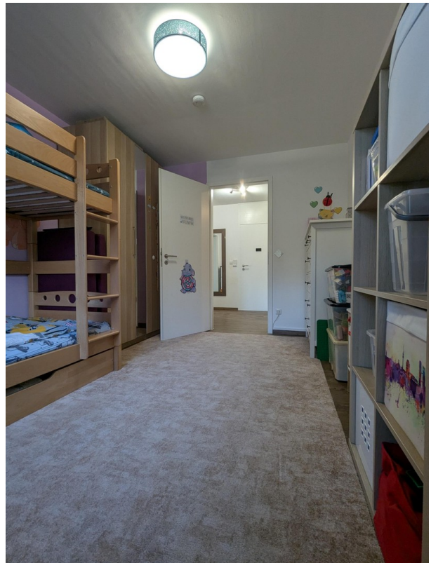
Kinder- / Arbeitszimmer