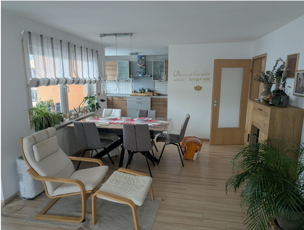
Essen & Küche