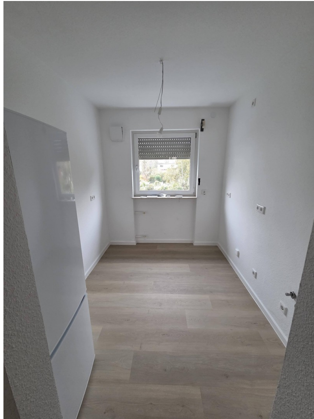
Küche (noch im Aufbau)