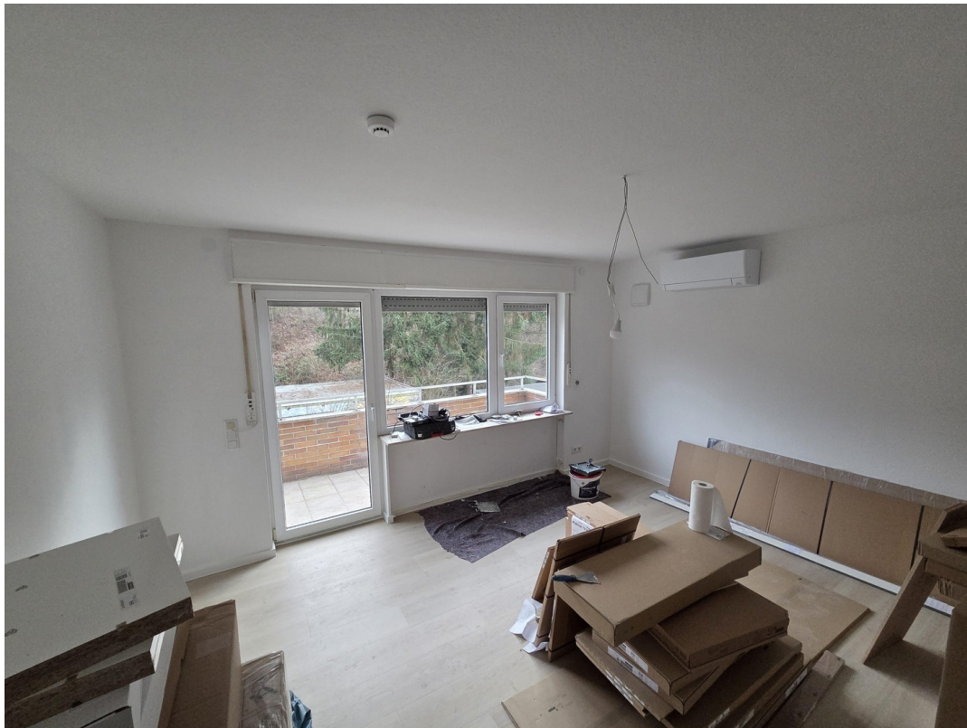
Wohnzimmer mit Blick auf Hof