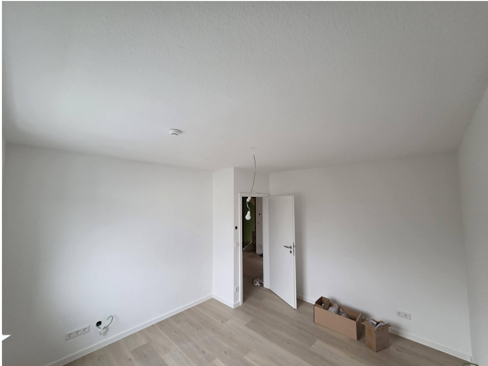
Schlafzimmer Richtung Flur