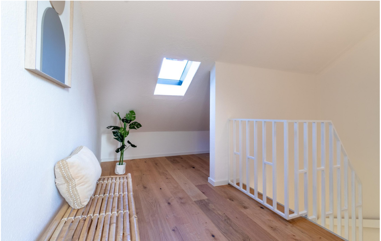
DG - Diele