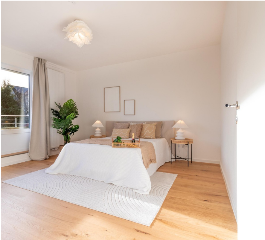
OG - Schlafzimmer