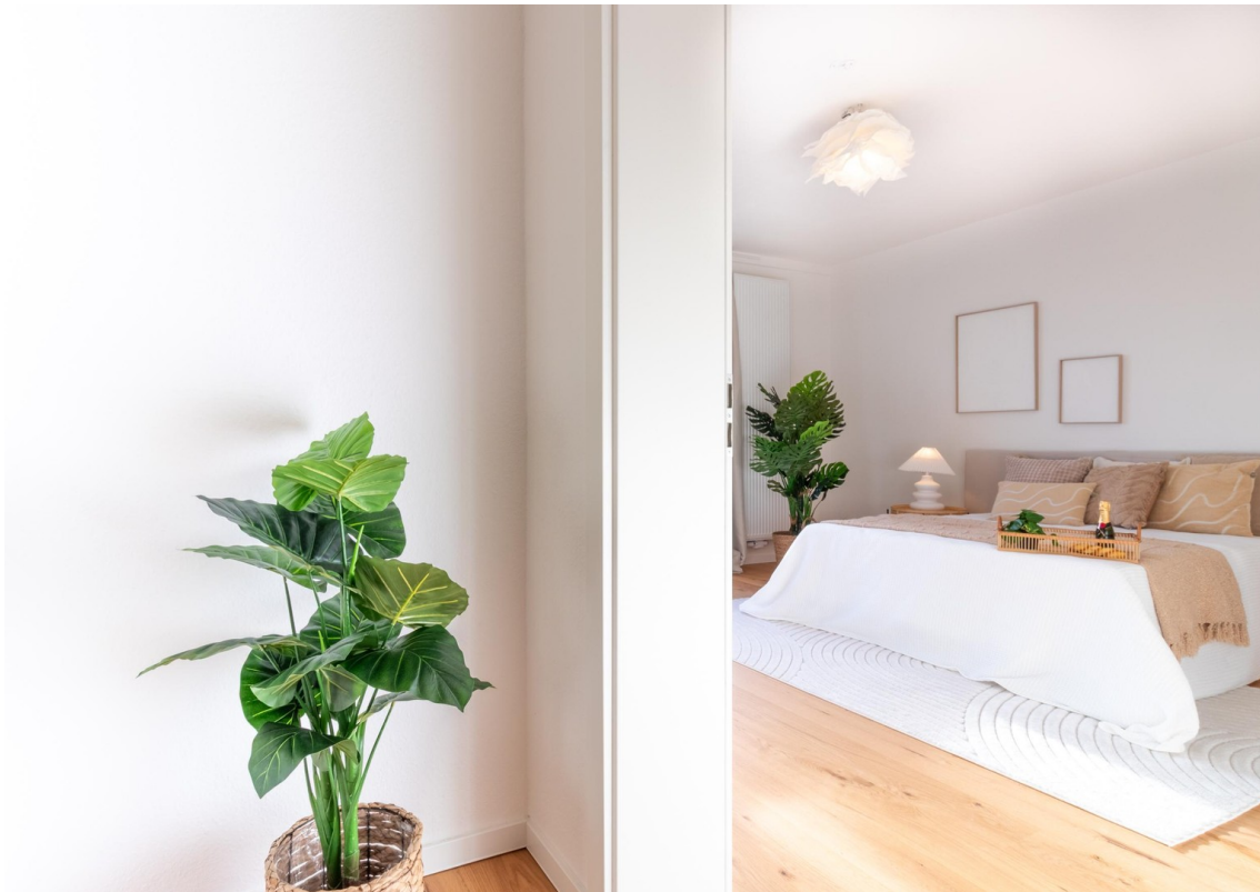
OG - Schlafzimmer