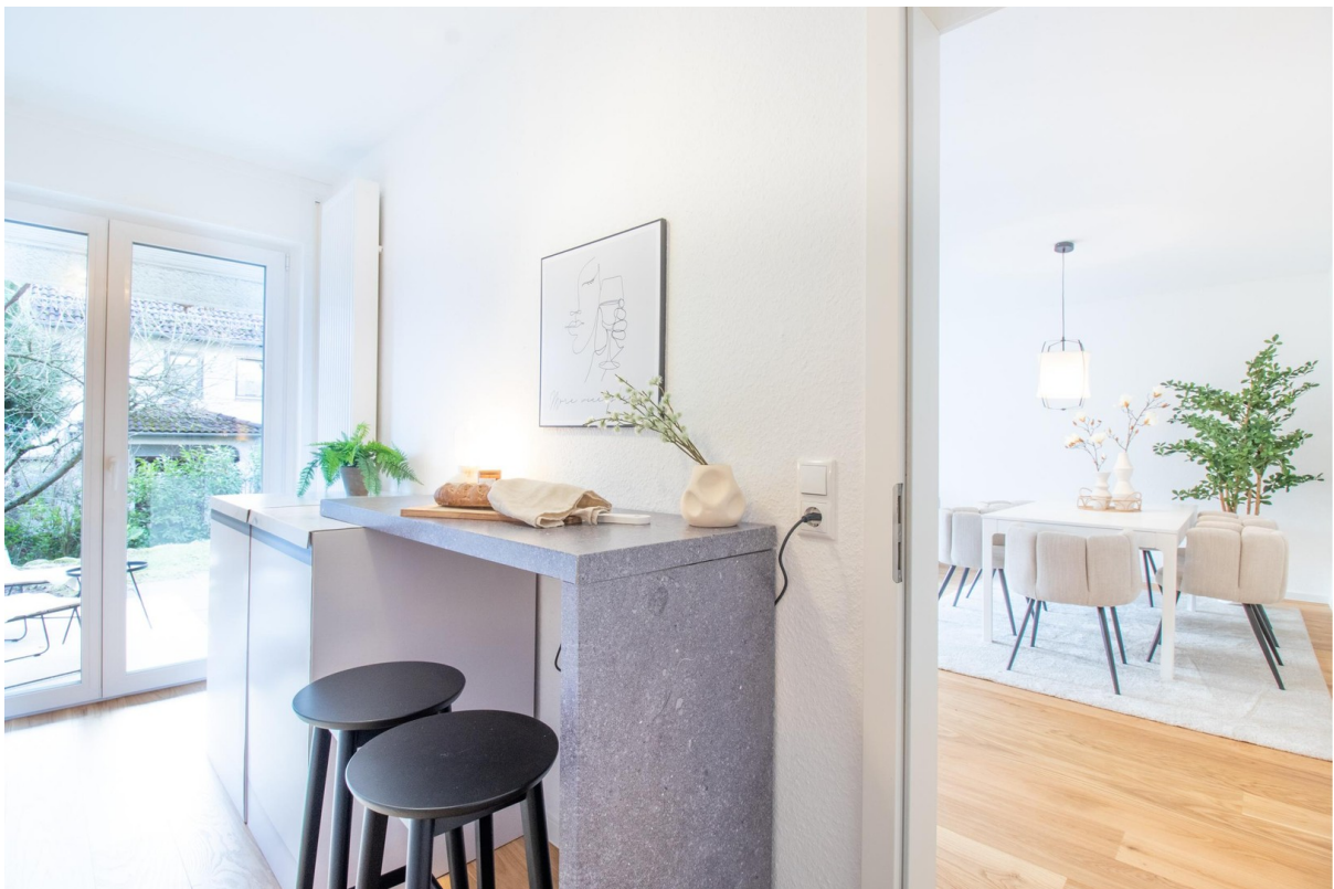
Küche mit Zugang zur Terrasse