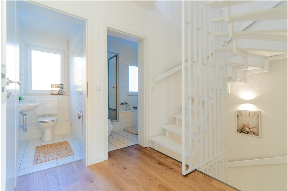
OG - Diele