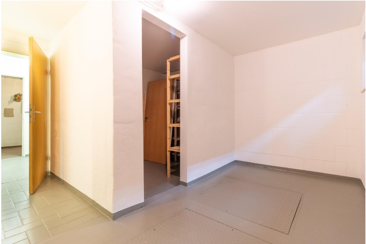
Keller - Abstellraum