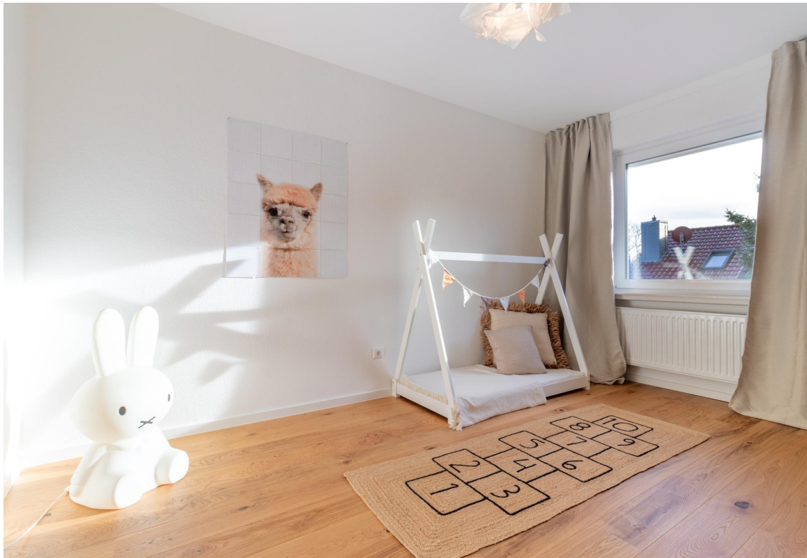
OG - Kinderzimmer