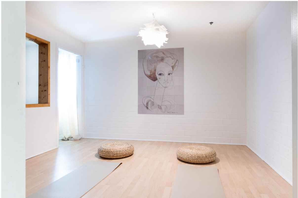
Keller - Hobbyraum