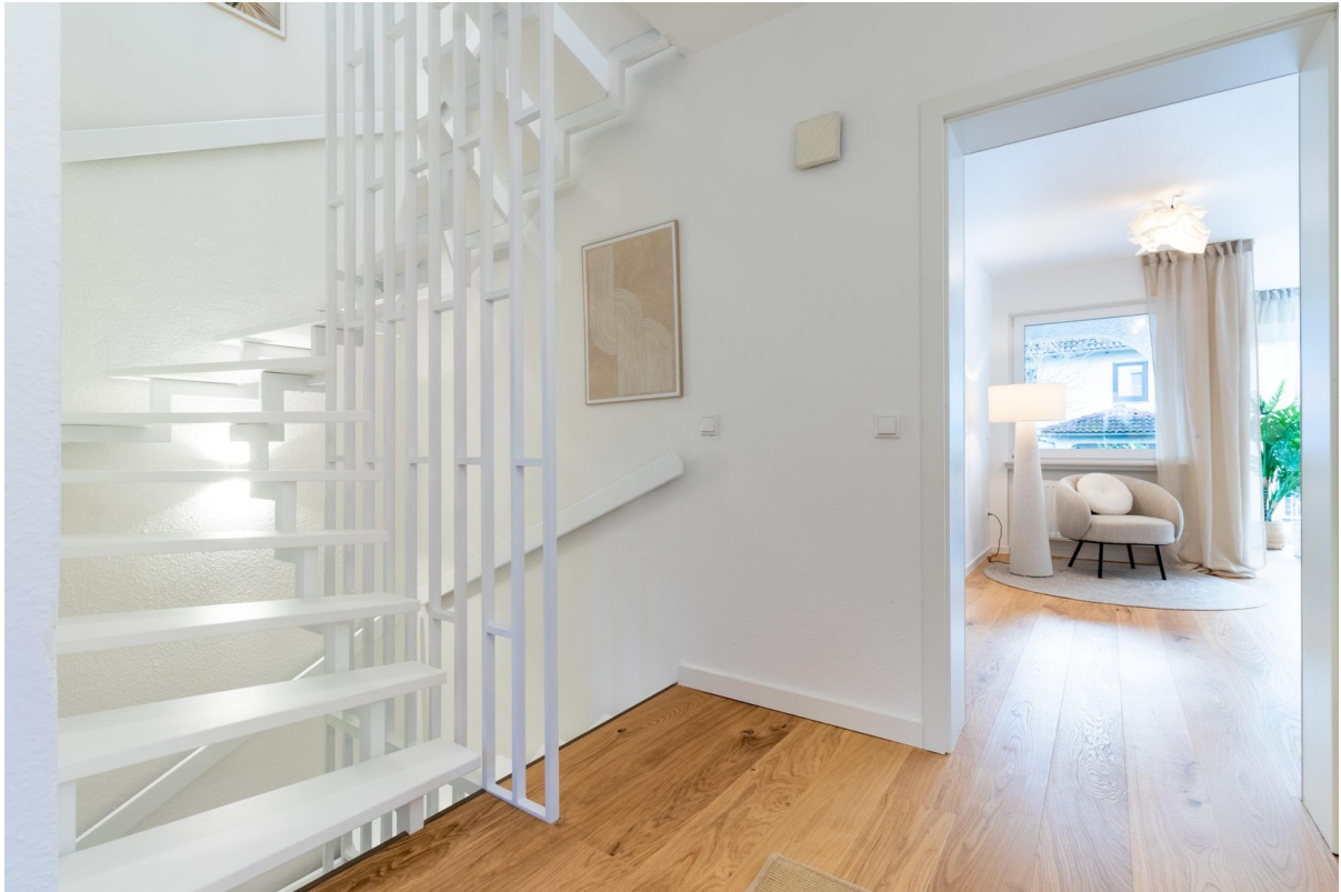
EG - Diele