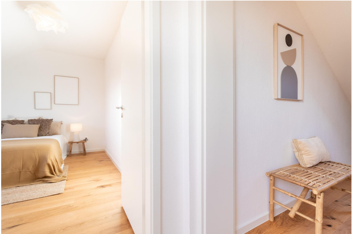
DG - Kinder-/Gästezimmer