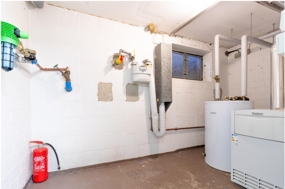
Keller - Gasheizung