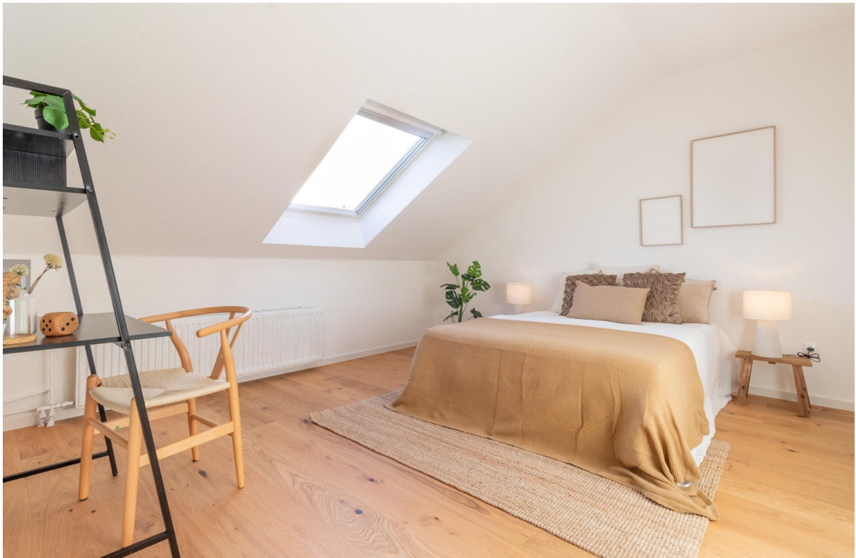
DG - Kinder-/Gästezimmer