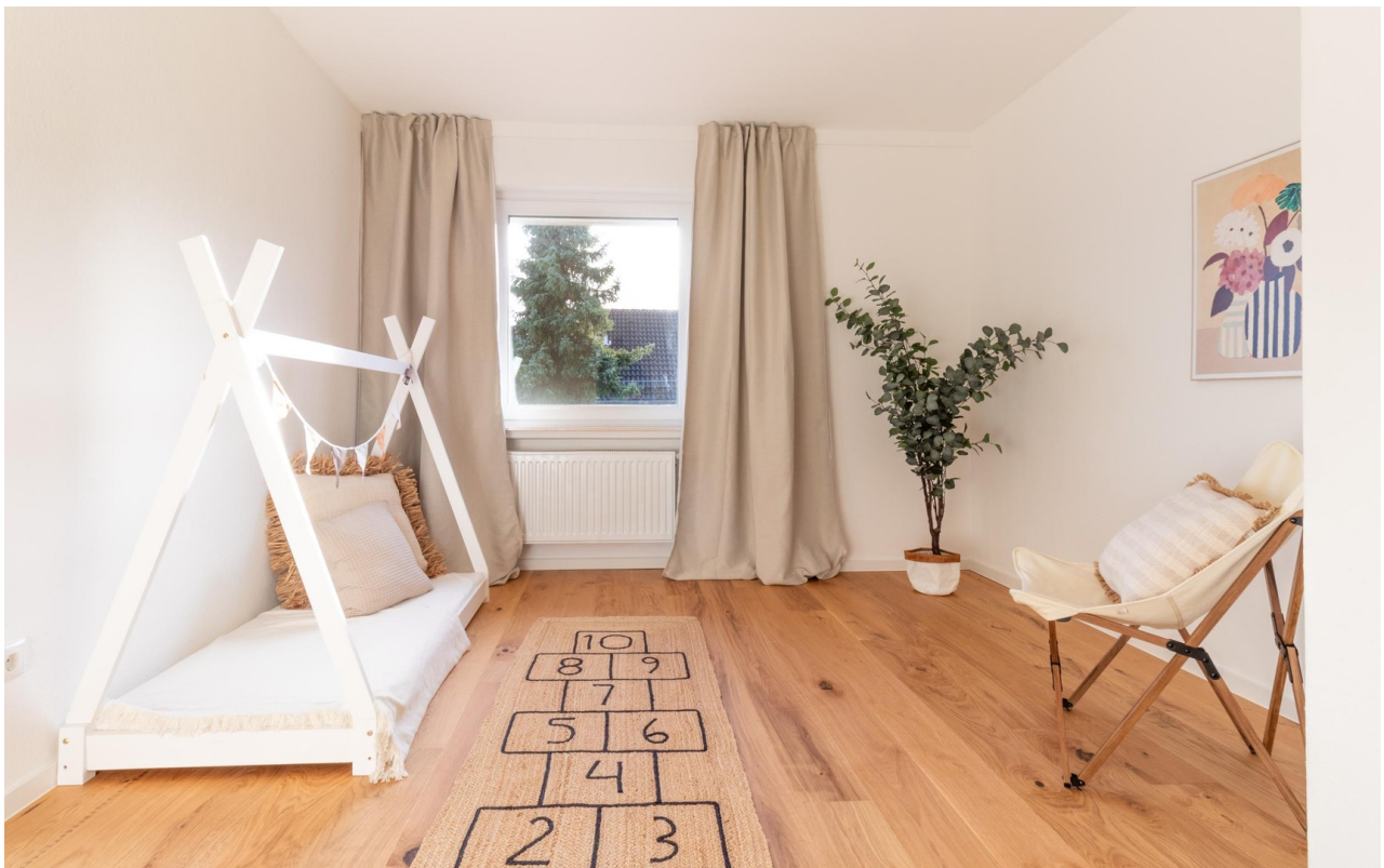
OG - Kinderzimmer