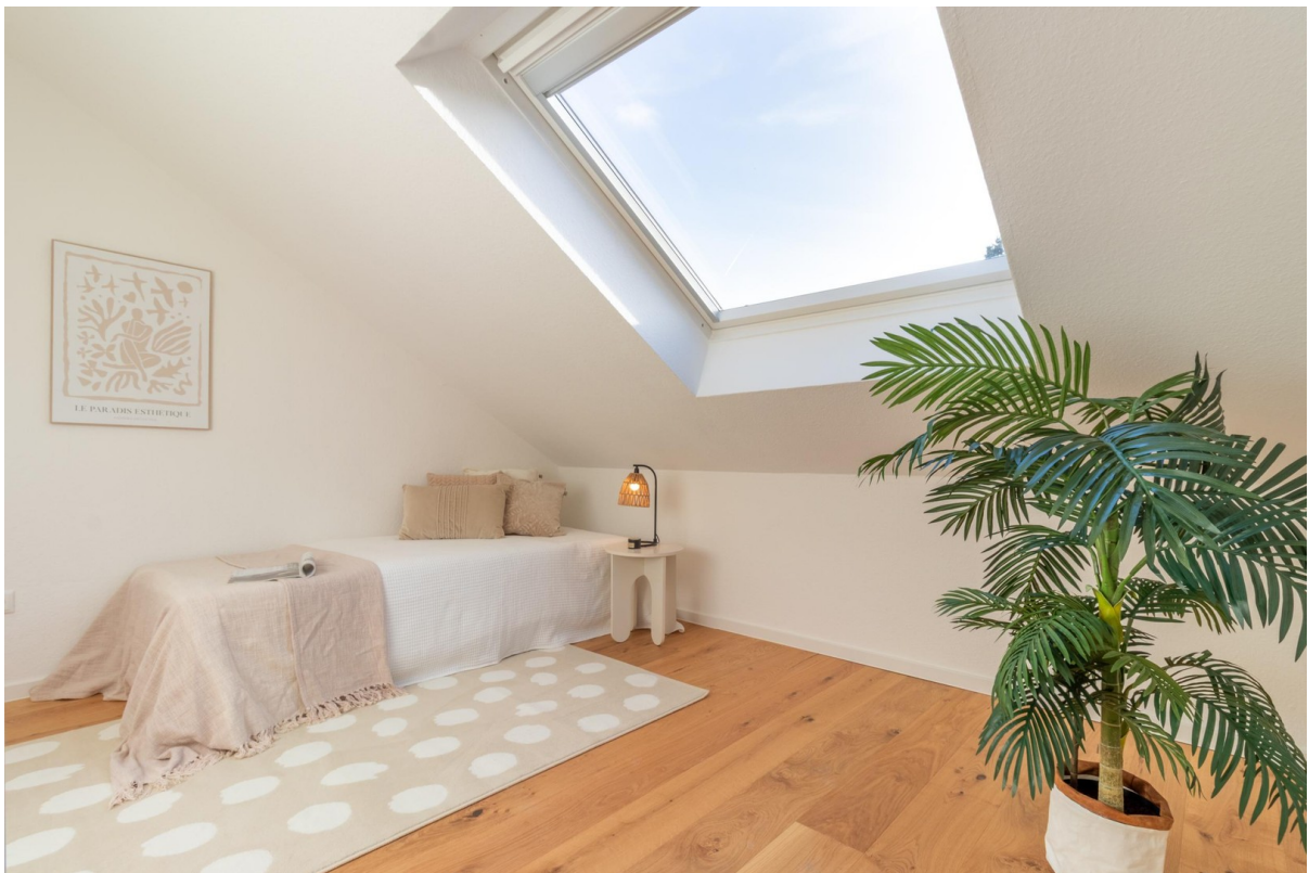
DG - Kinder-/Gästezimmer