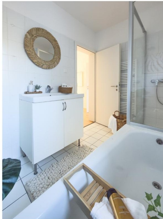
OG - Bad mit Tageslicht