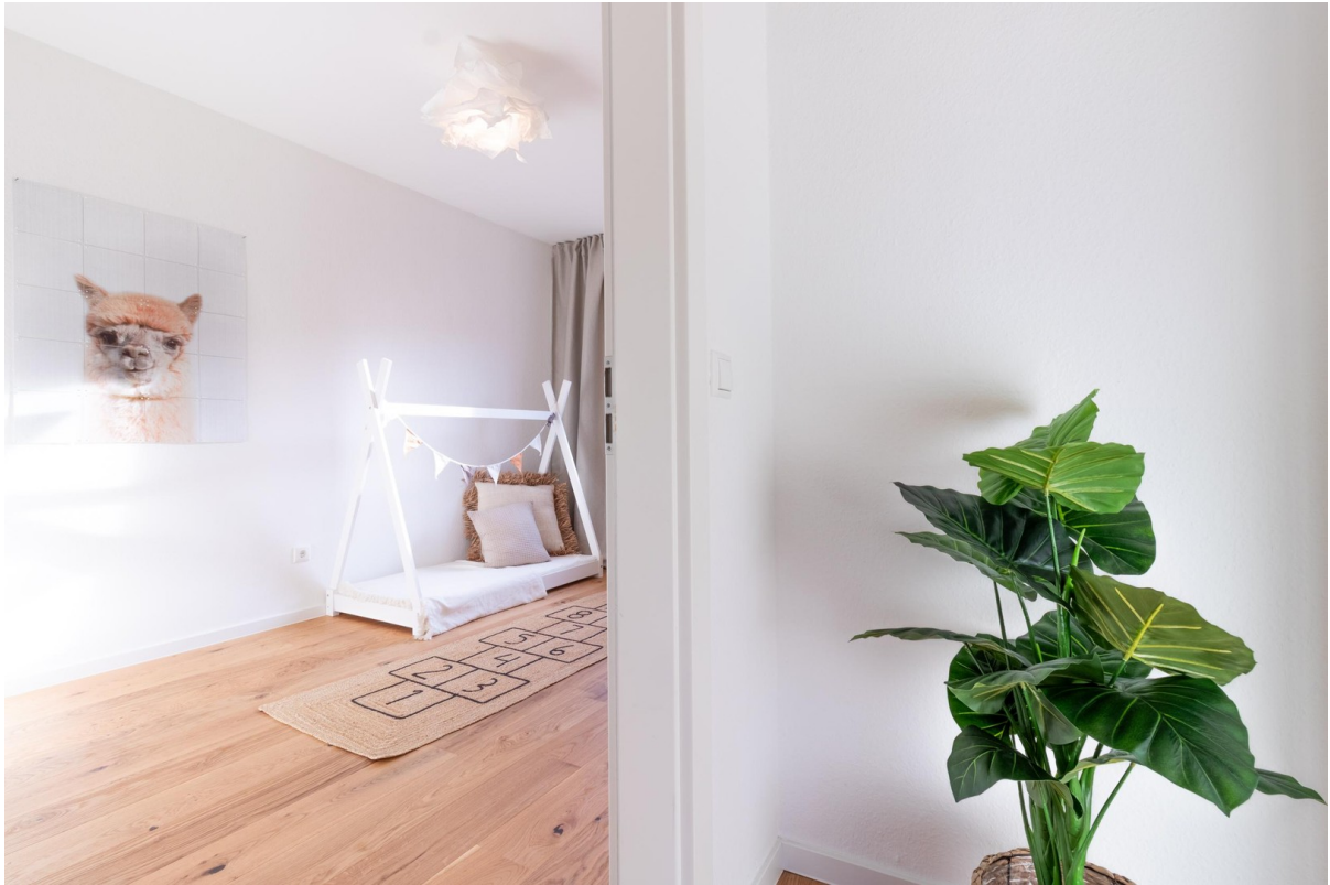
OG - Kinderzimmer