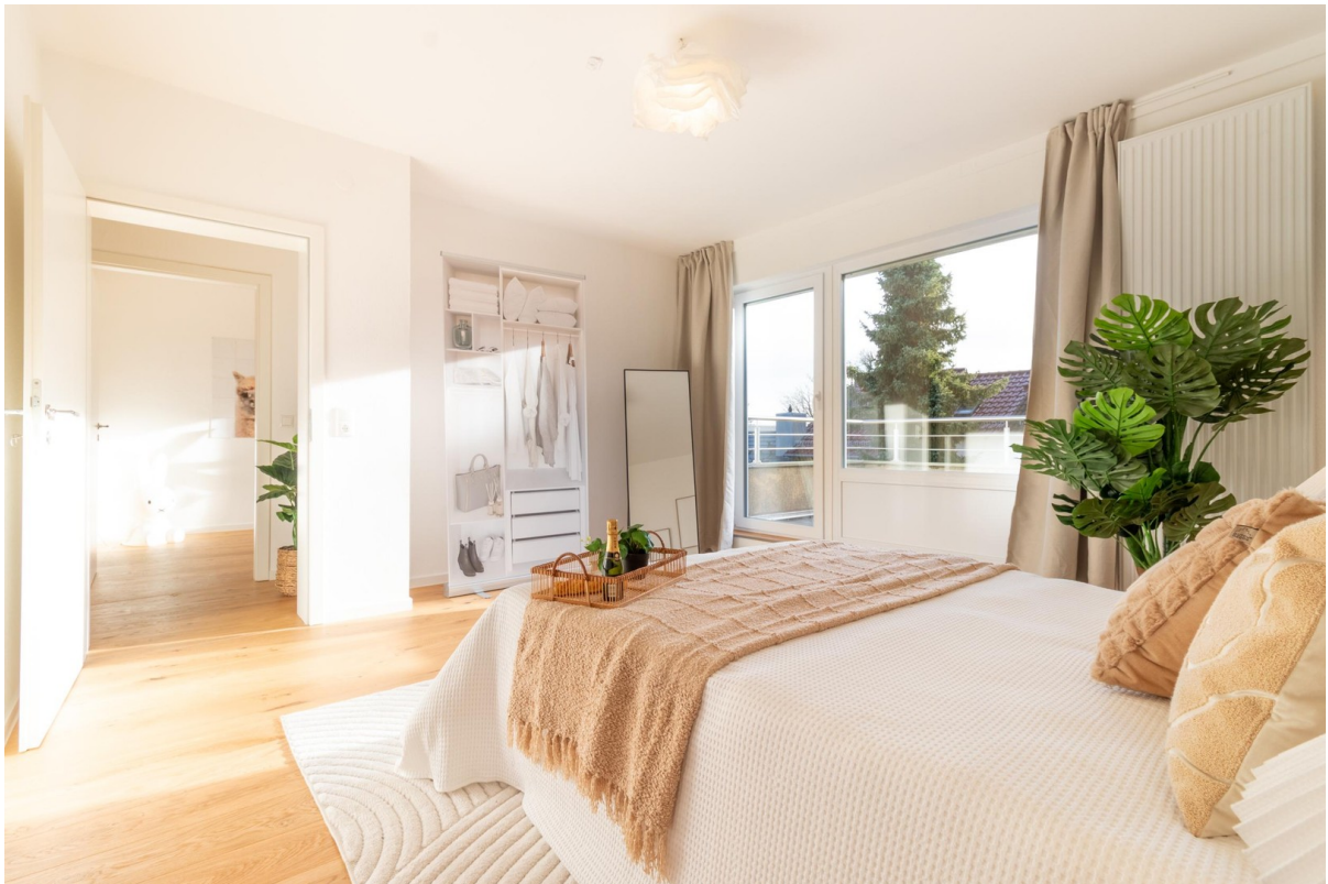
OG - Schlafzimmer mit Loggia