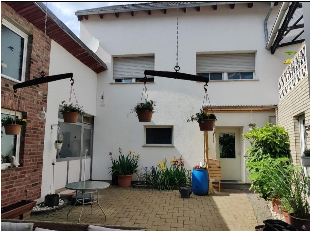
Innenhof Sicht aus Eingang