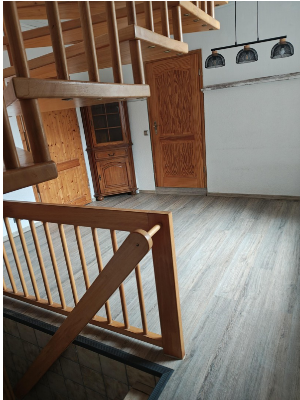
Diele aus Wohnzimmer