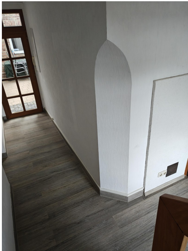
Blick von Treppe runter