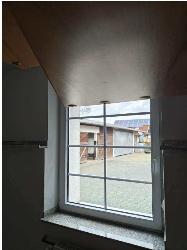
Blick aus Diele