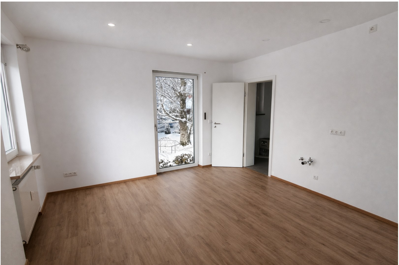
Küche / Esszimmer 2