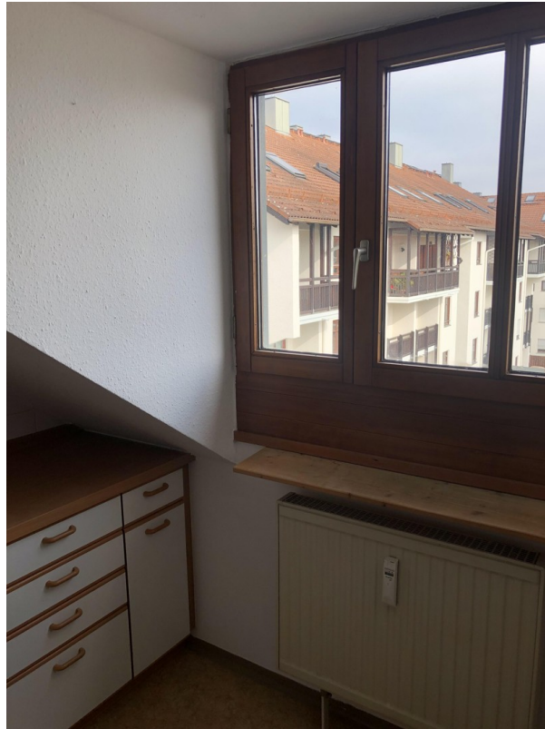
Küchenbereich, großes Fenster