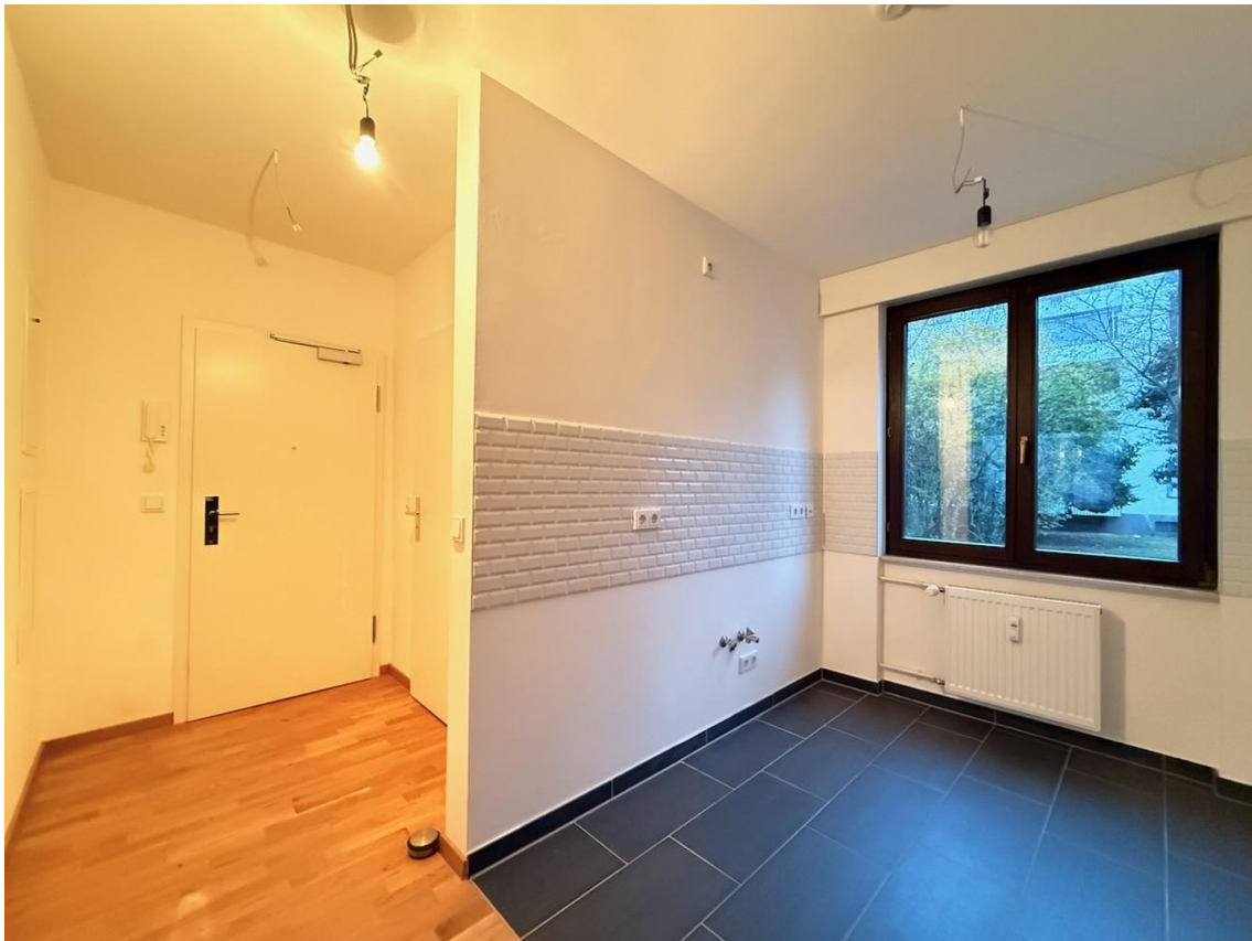
Flur Küche NO