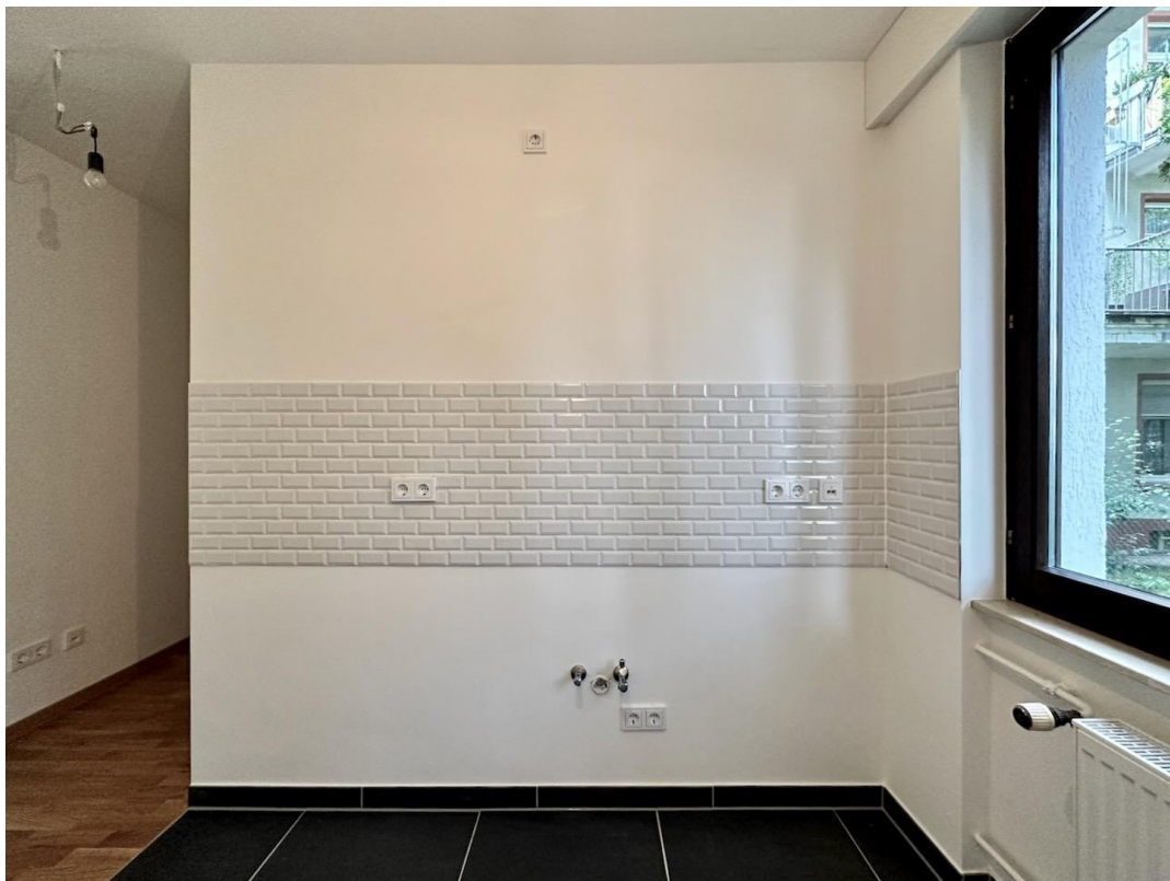
Küche Wasseranschluss N