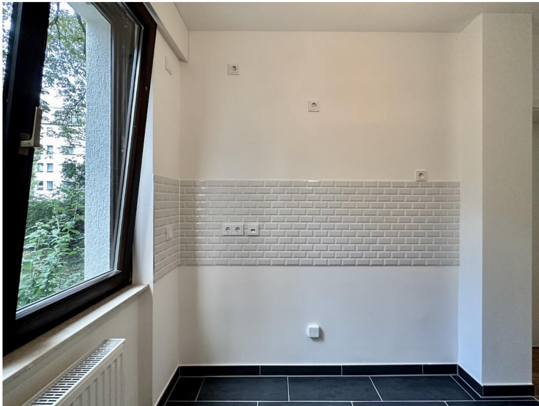
Küche Herdanschluss S