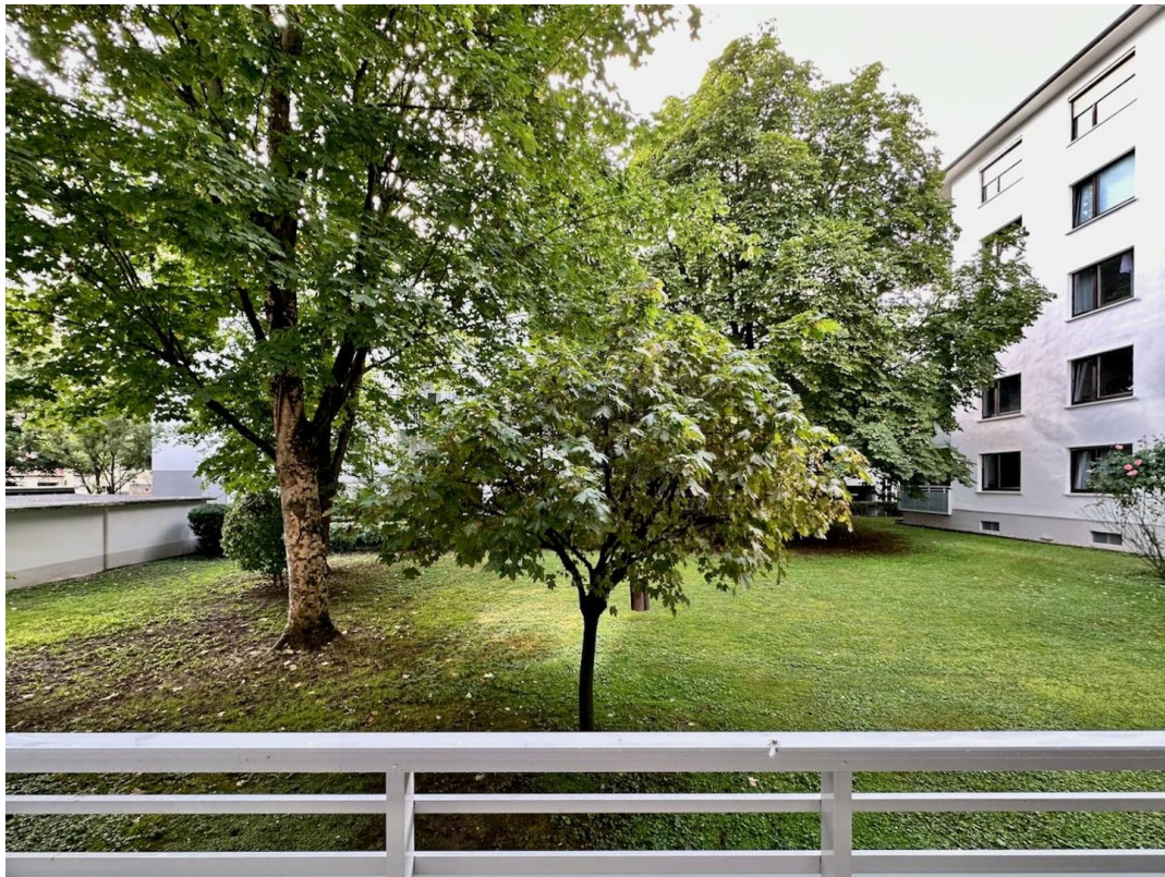
Blick von Loggia W