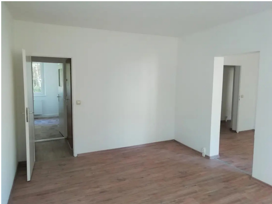
Beispielräume der großen Whg