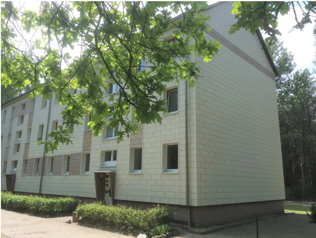
Haus von der Seite