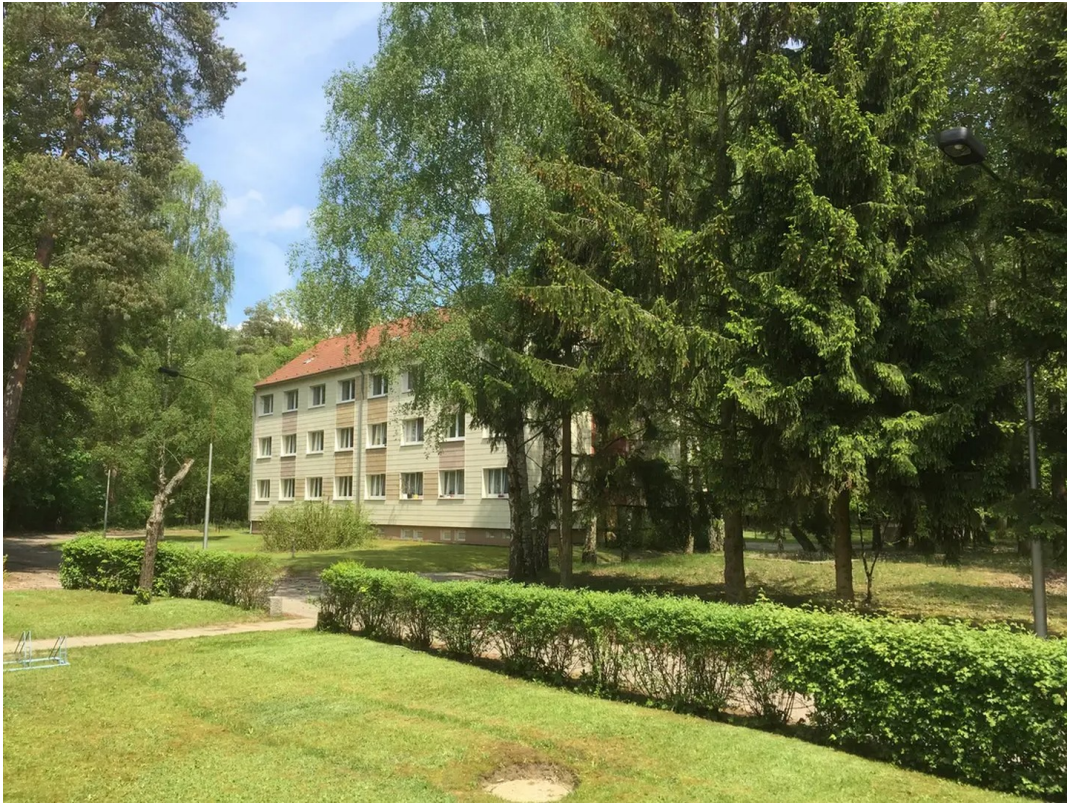
Haus von hinten