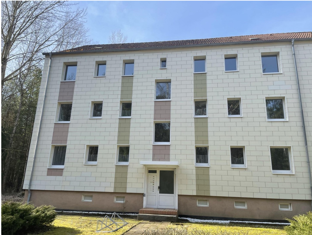
Haus von vorne