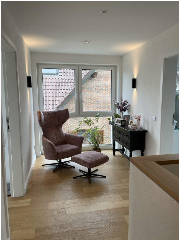
Sitzbereich im Obergeschoss