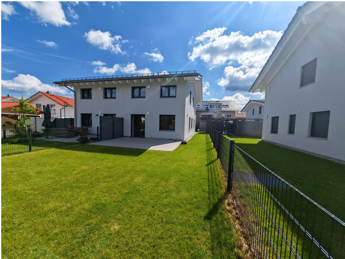
Ansicht DHH rechts