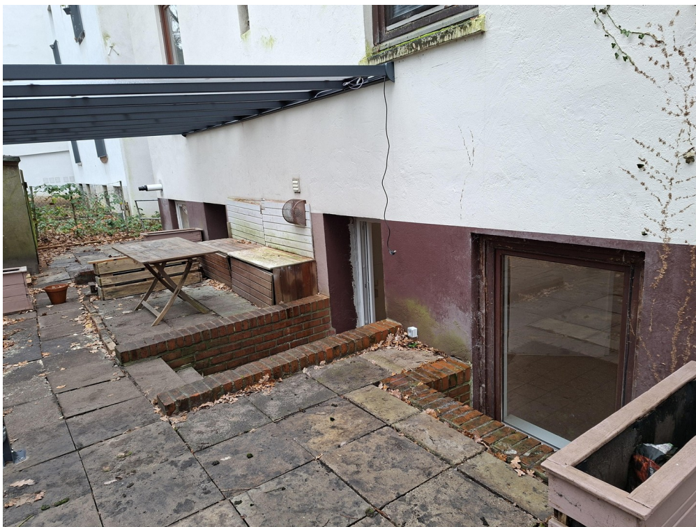
rückwärtige Terasse / Pergola