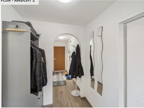
FLUR - ANSICHT 2