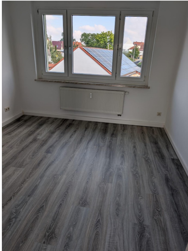
großes Zimmer (original)