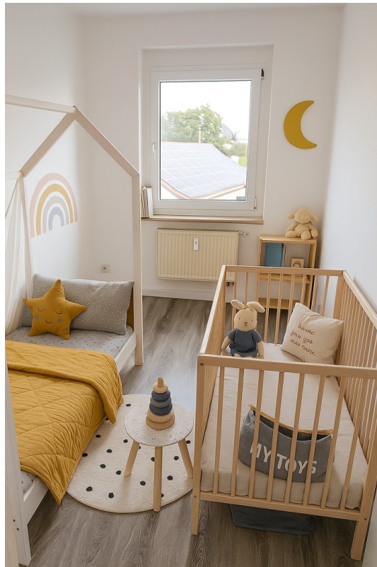
Kinderzimmer (kleines Zimmer)