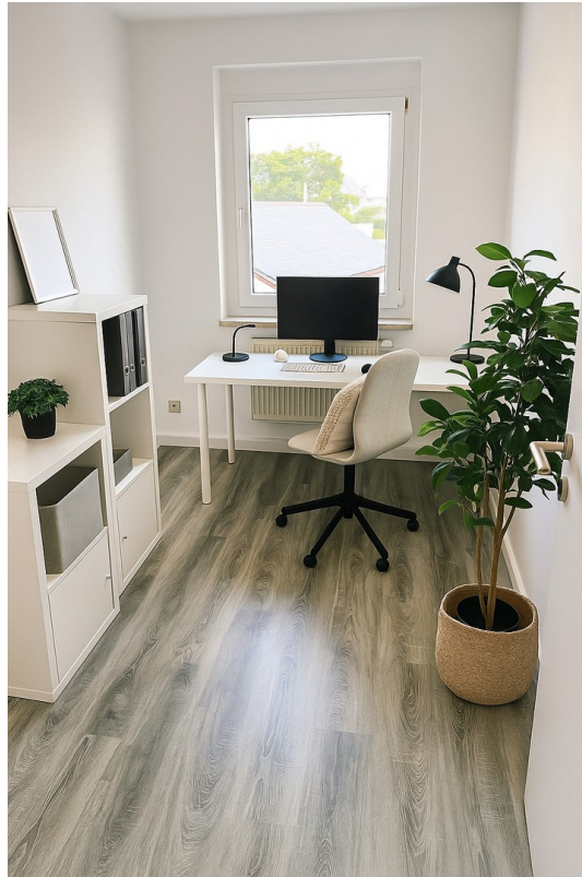
Arbeitszimmer (kleines Zimmer)