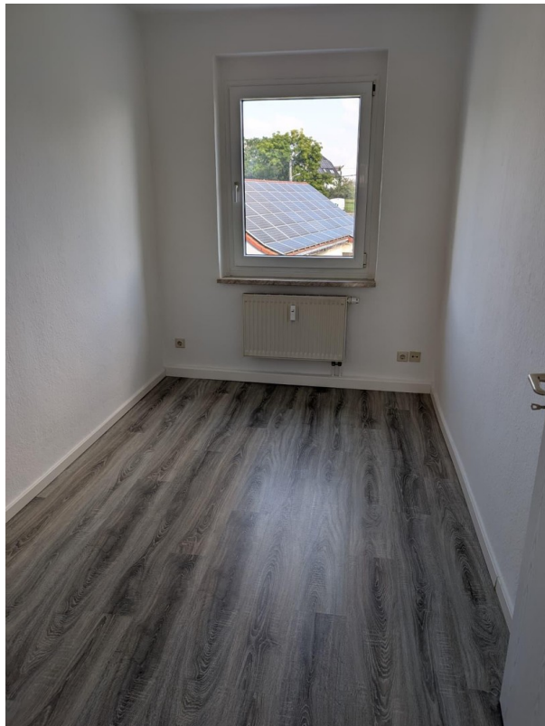
kleines Zimmer (original)