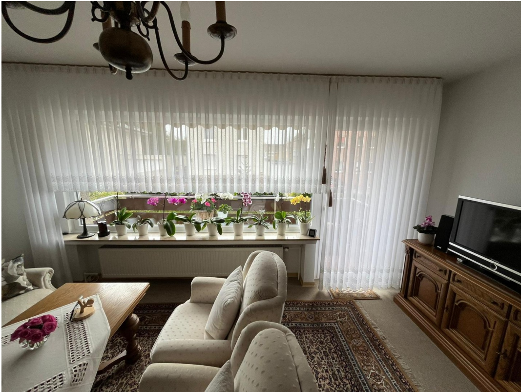
Wohnzimmer mit Balkonzugang