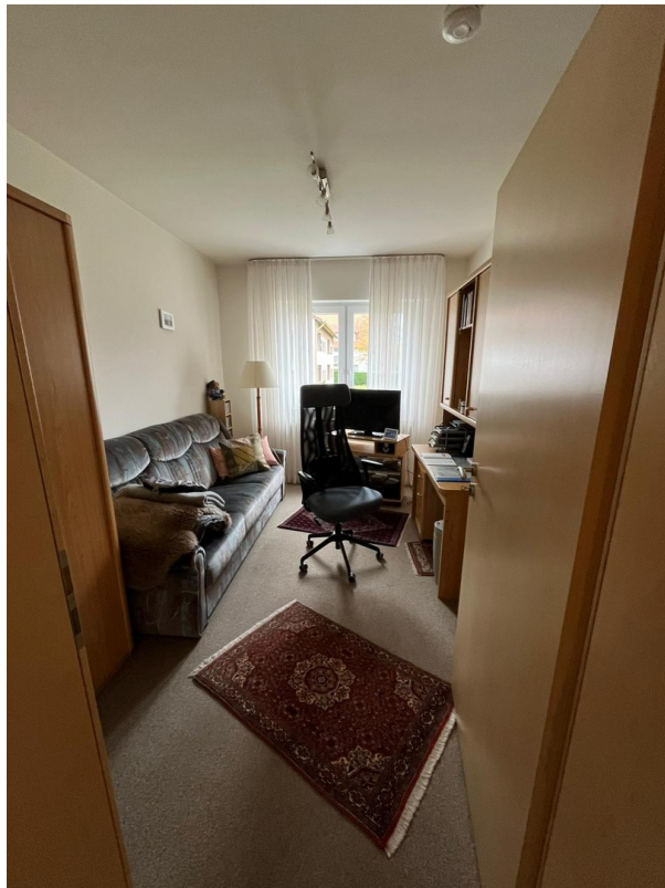
Arbeitszimmer / Kinderzimmer