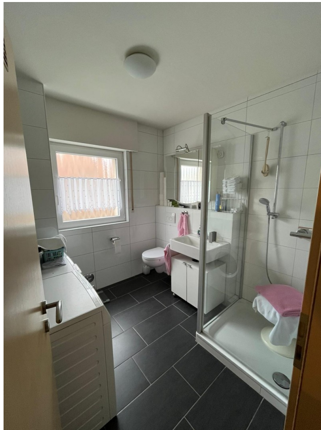
Bad inkl. Dusche und Fenster