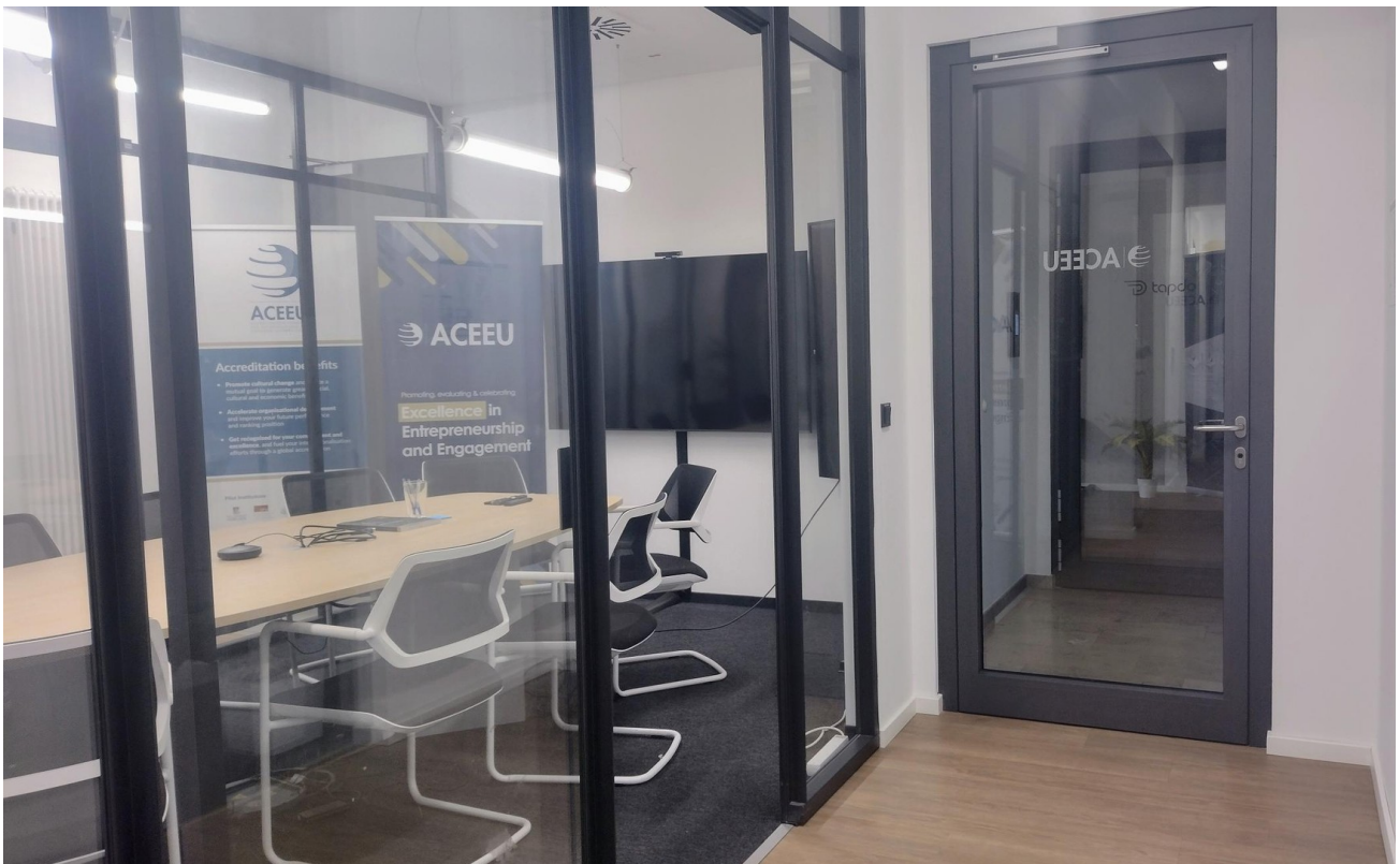
Eingang, Flur, Meetingraum