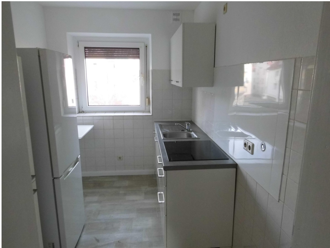
Küche 1. OG rechts