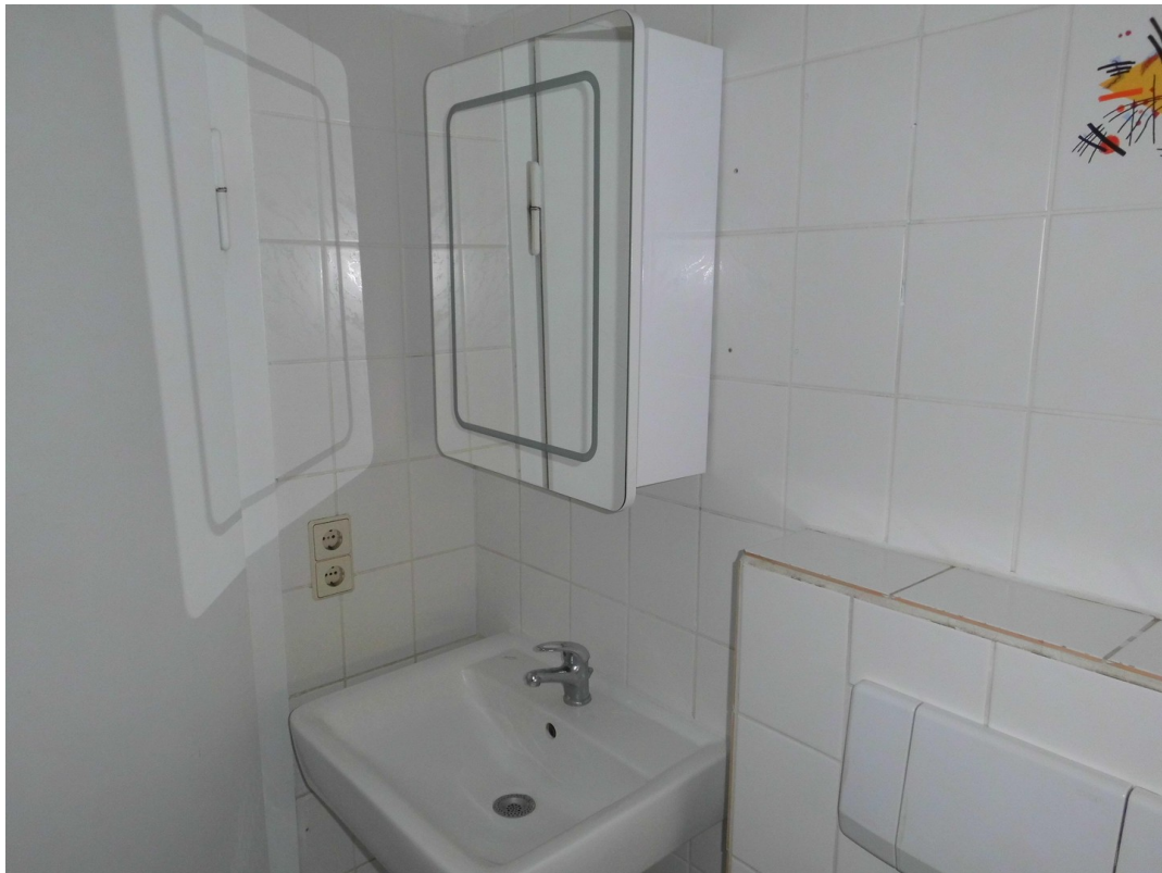
Bad 1. OG. rechts