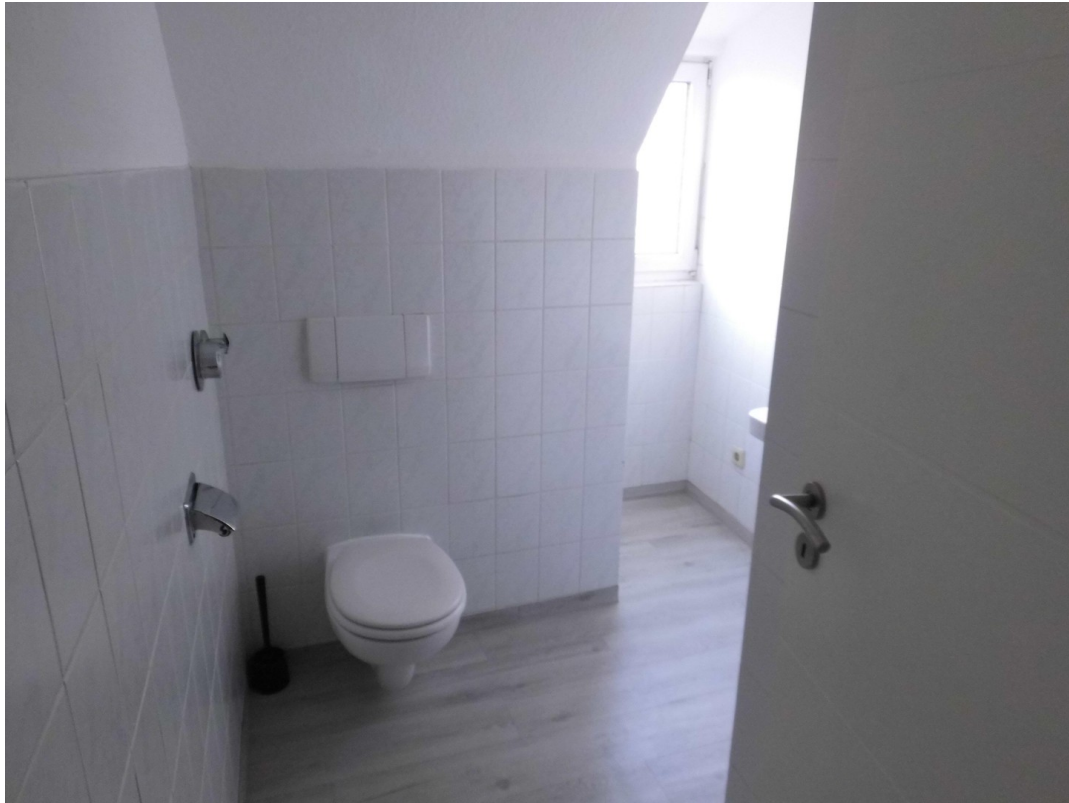
Bad Dachstock links