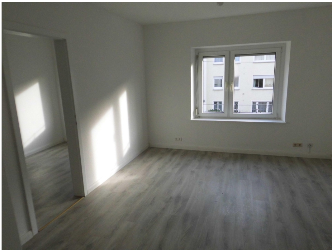
Wohnzimmer 1. OG rechts