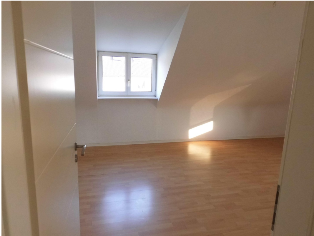
Schlafzimmer DG links