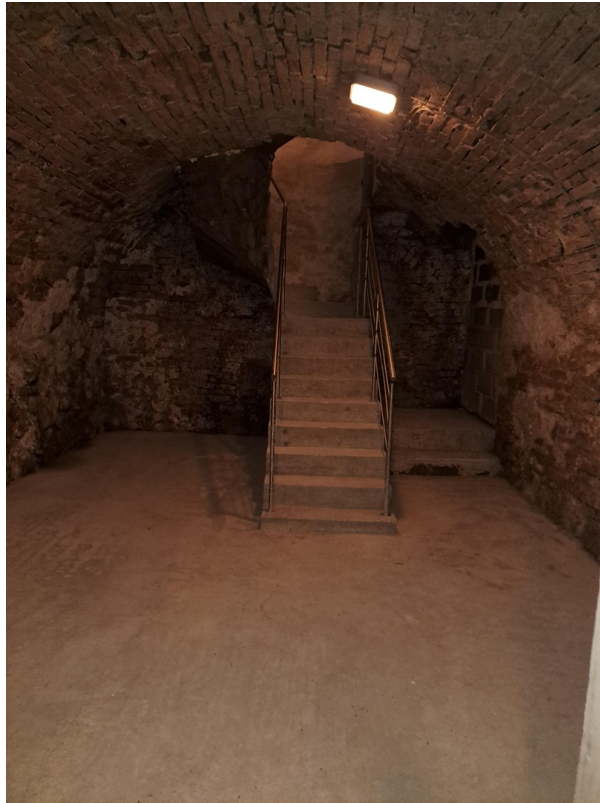
Treppe vom 1. UG ins 2. UG