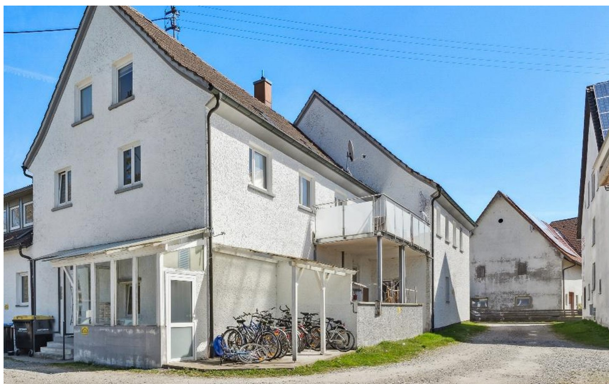
Eingang durch Tür links