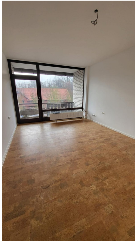
Schlafzimmer inkl. Balkon