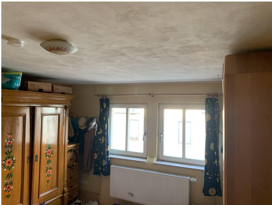
Kinderzimmer 1 Etage