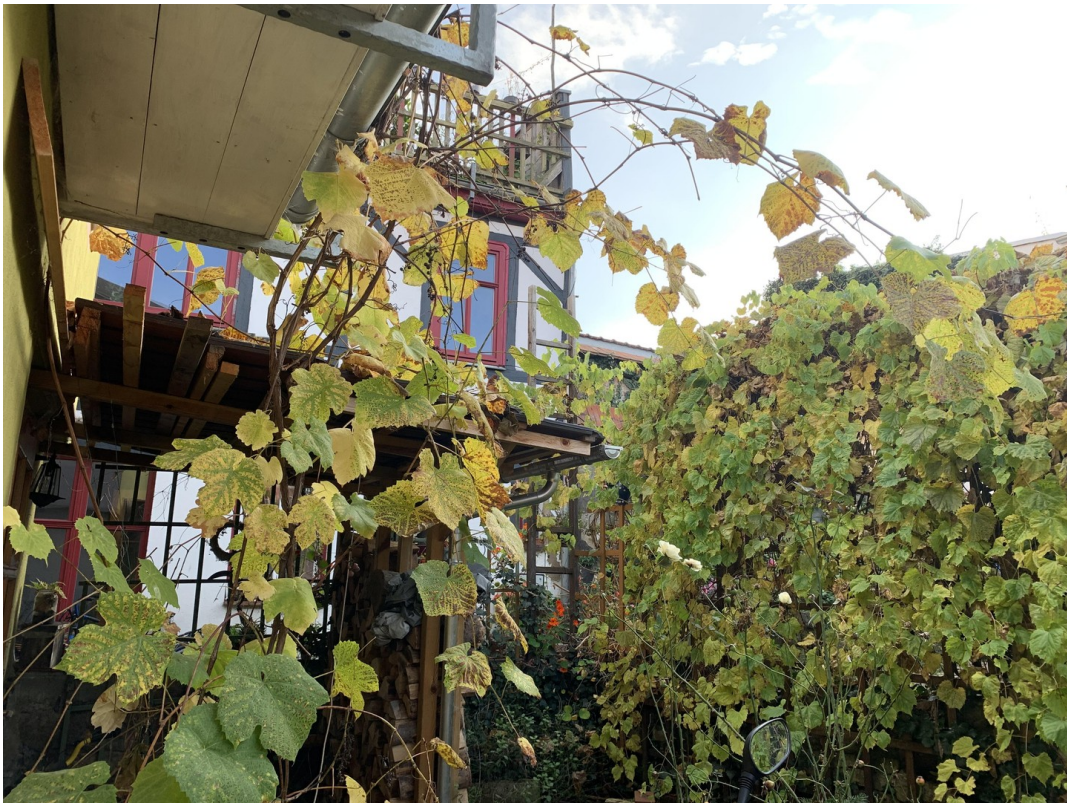
Blick aus Hintereingang