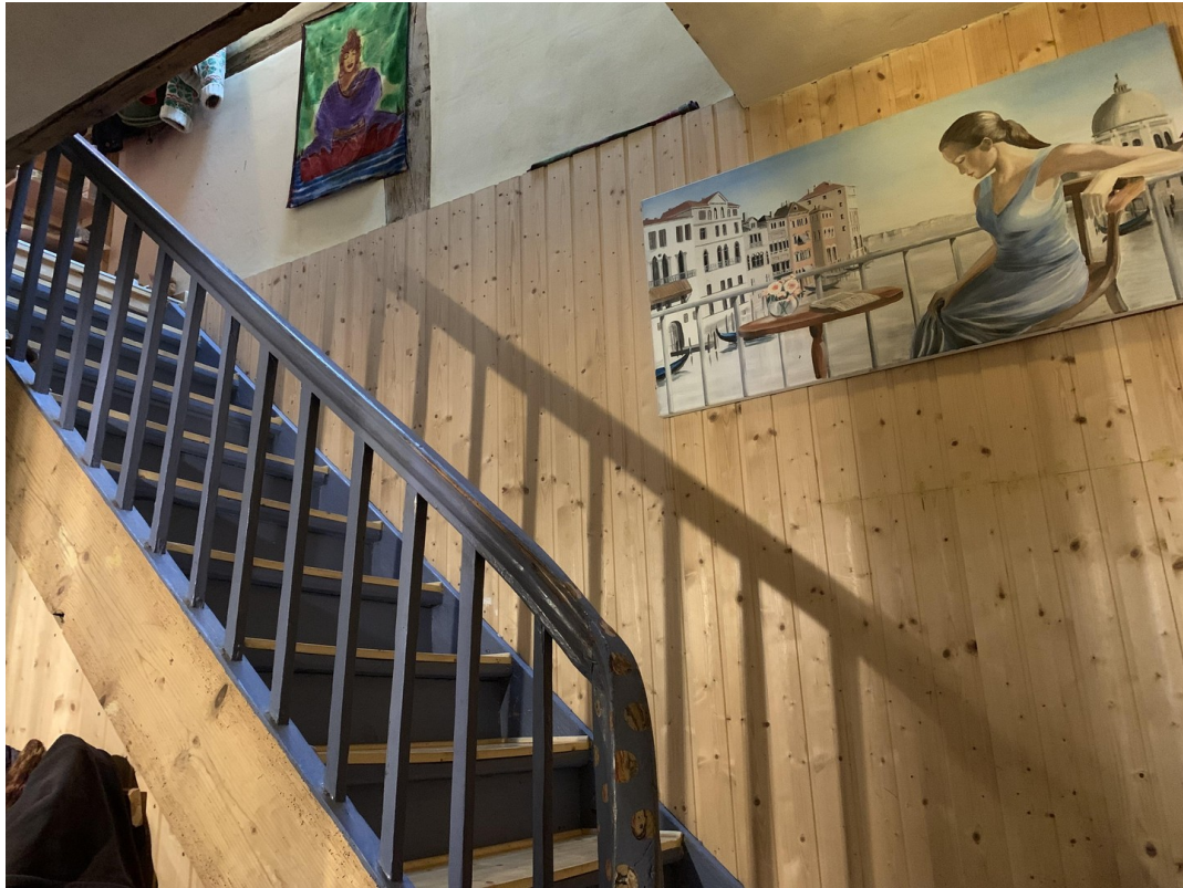
Aufgang 1 Etage