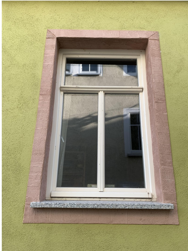
Neue Fenster im ganzen Haus