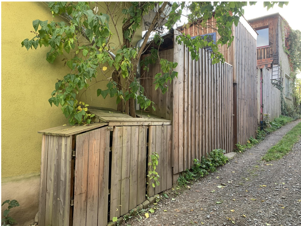
Zugang von hinten durch Gasse