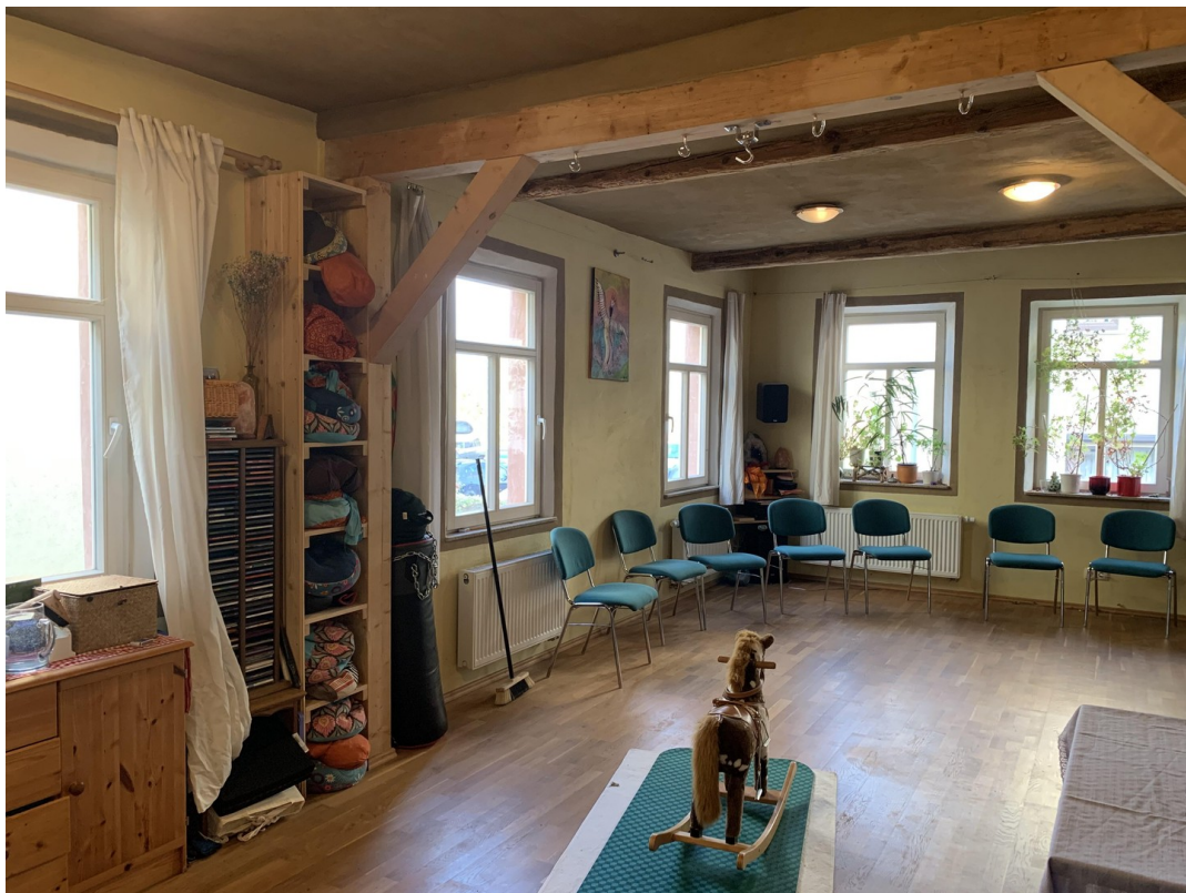
Kursraum & mögl. Wohn-Essküche