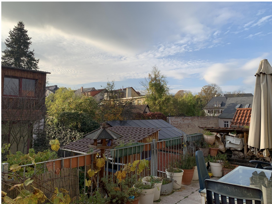
Blick von Terrasse