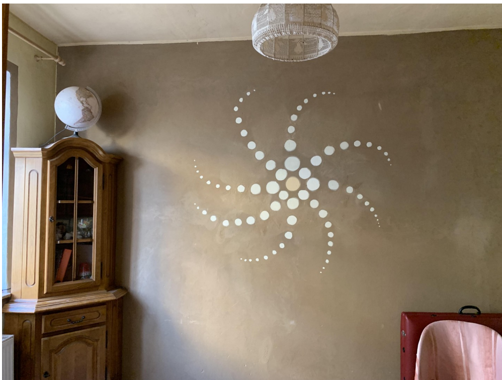
EG Zimmer neben Eingang