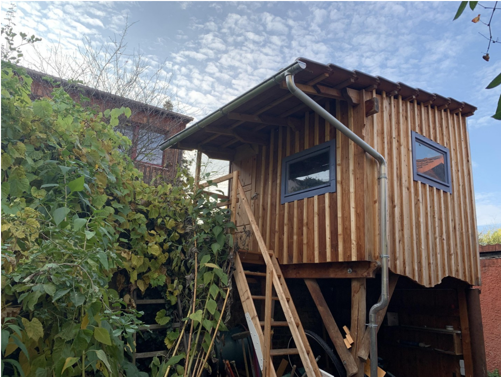
Baumhaus und Schuppen