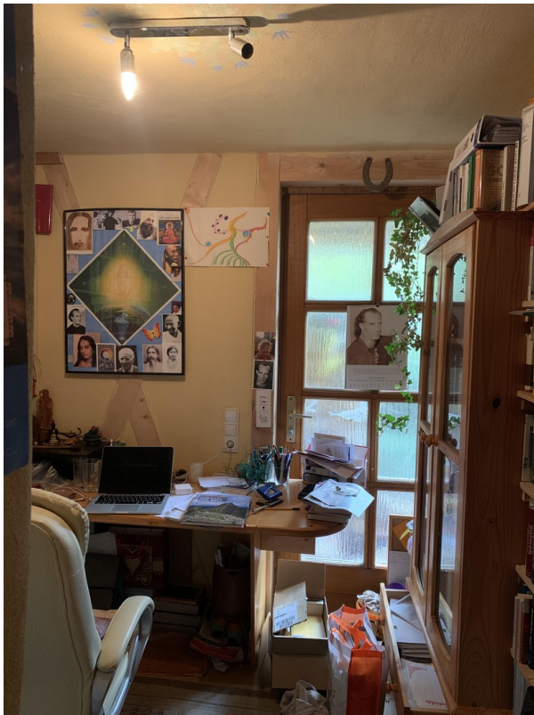
Zimmer EG Anbau/Sauna möglich