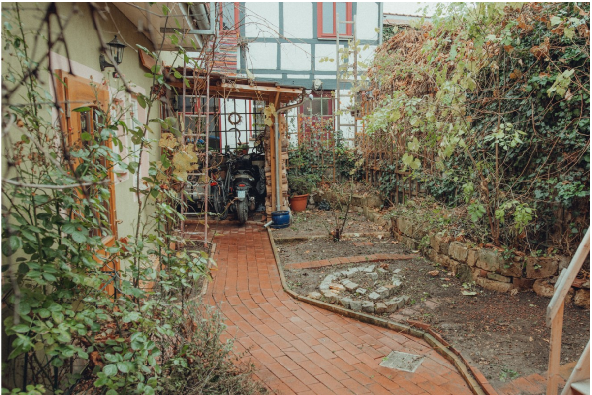
Garten hinter Zaun/Hochbeete