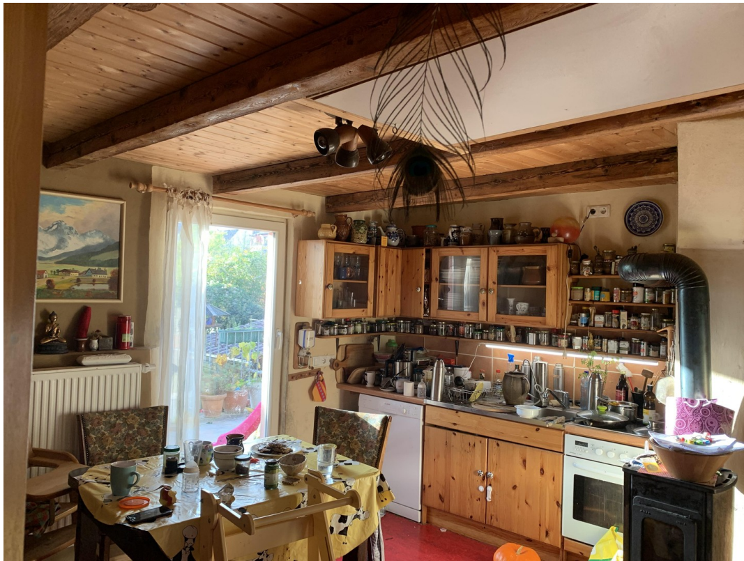
Küche OG mit Zugang Terrasse