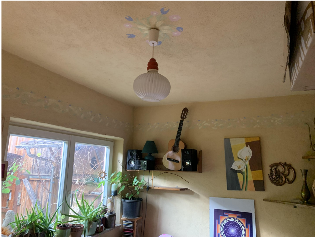
Gästezimmer EG mit sep.WC