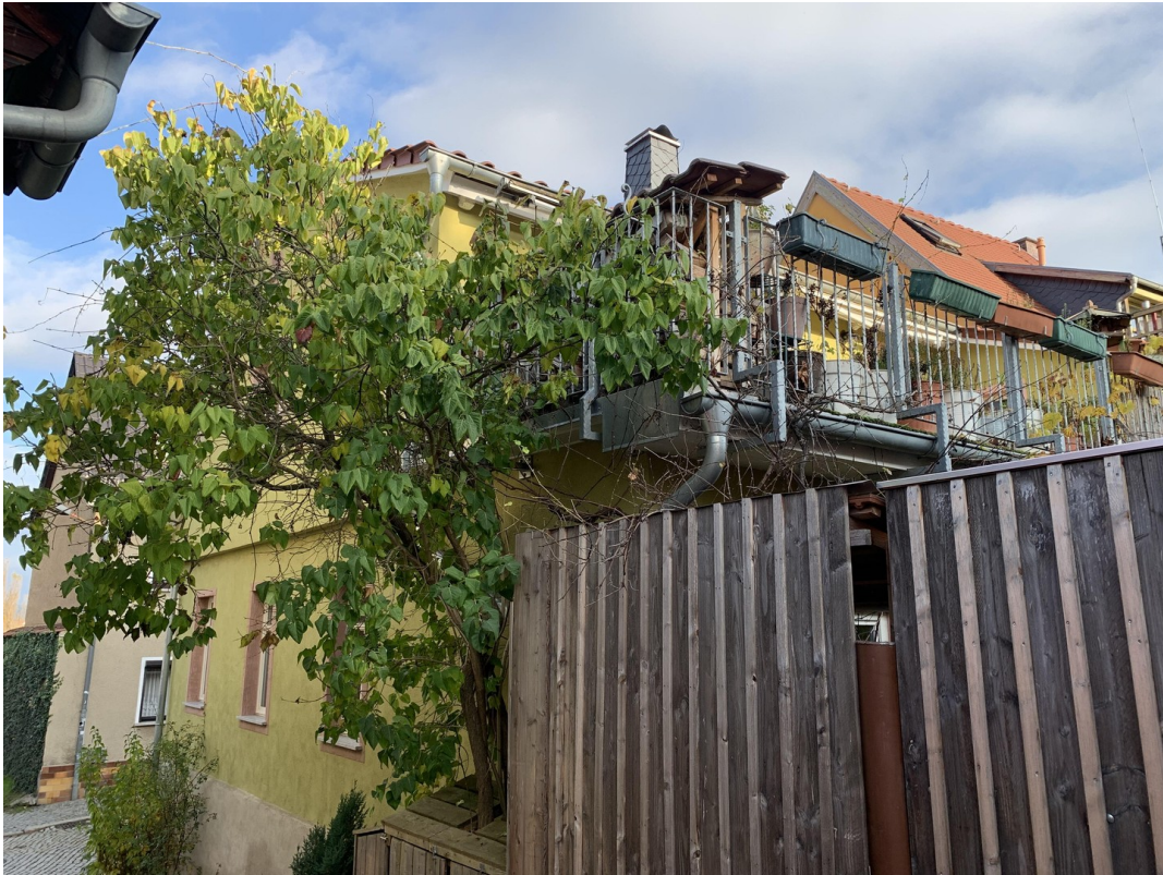
Gasse neben Haus/Blick Terasse