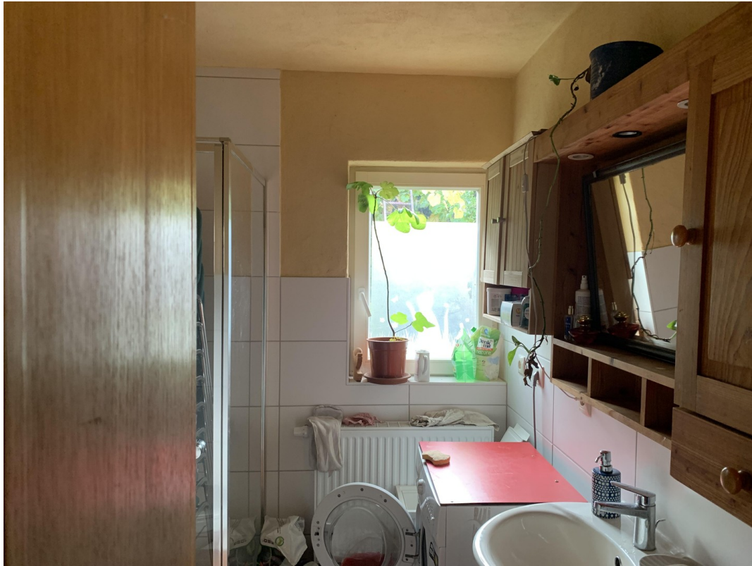
Bad groß EG mit Dusche