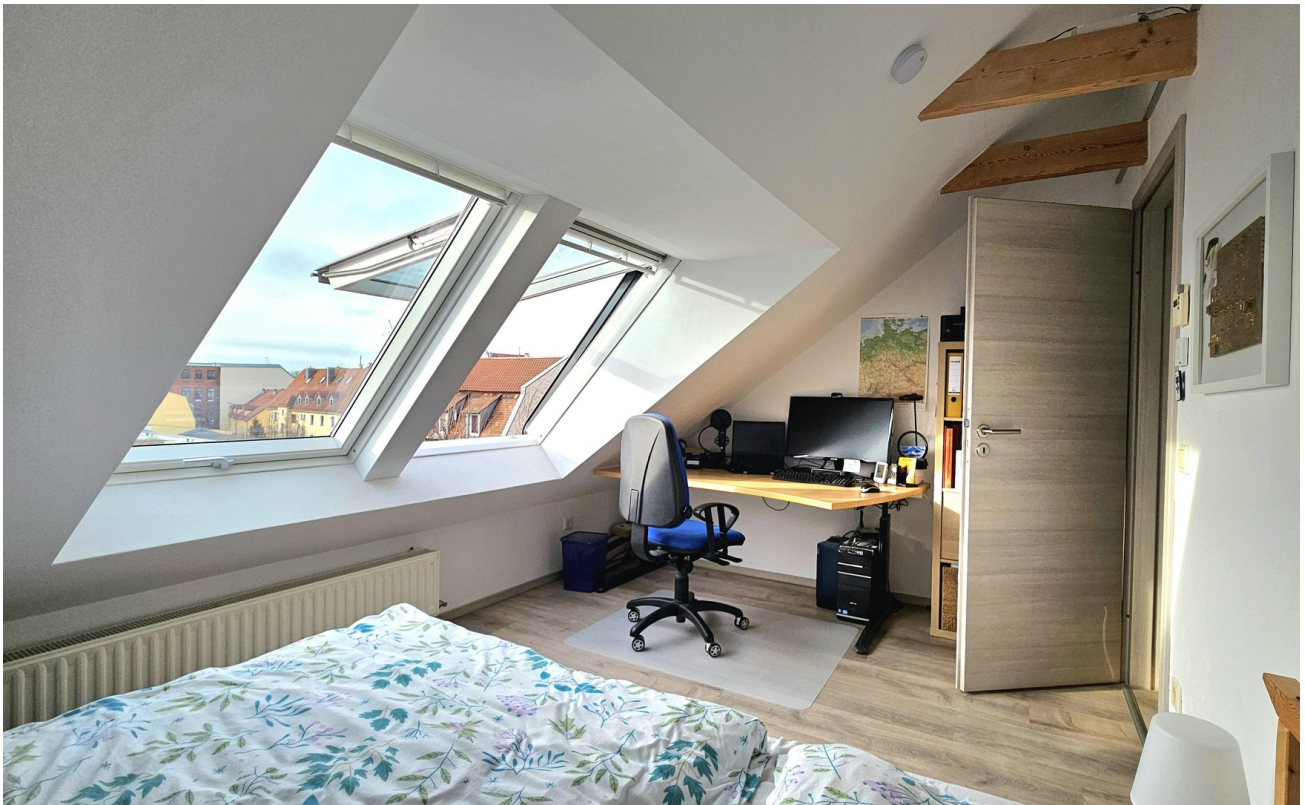
Arbeits- / Kinderzimmer