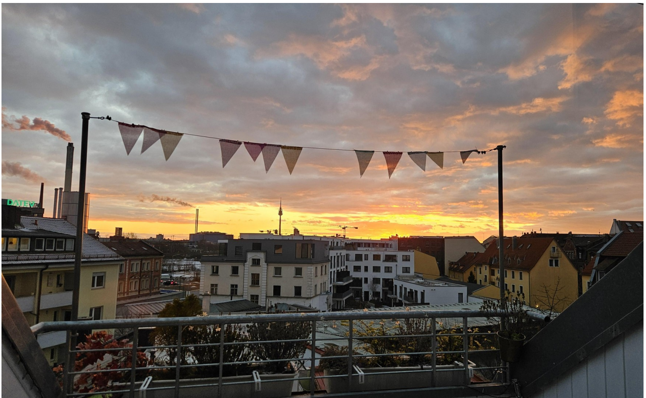
Dachterrasse am Abend