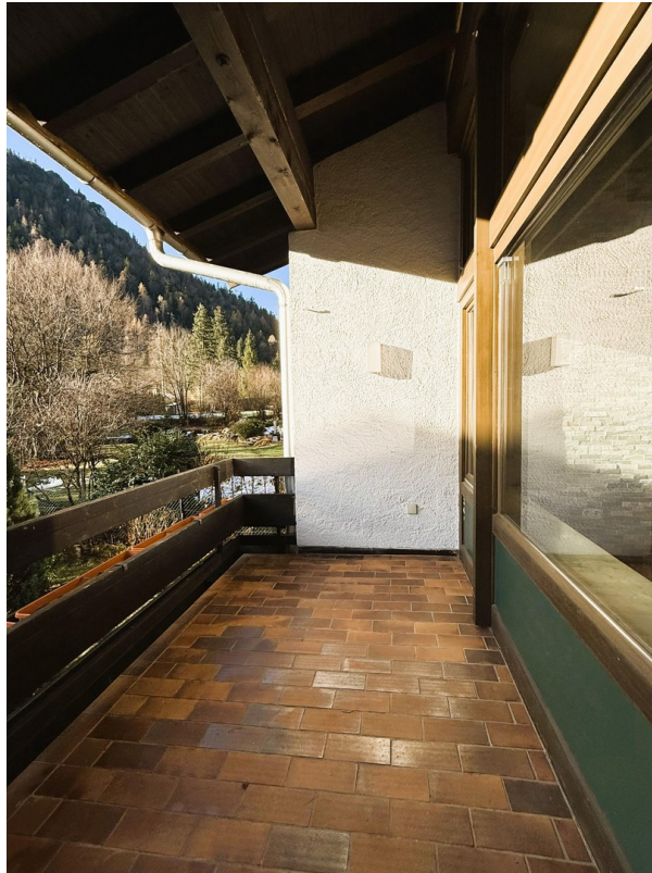
Aussicht von Balkon