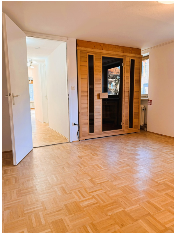
Sauna im Schlafzimmer unten