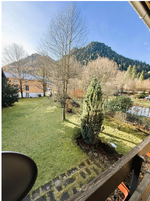
Aussicht von Balkon