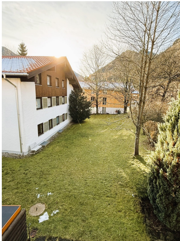
Aussicht von Balkon