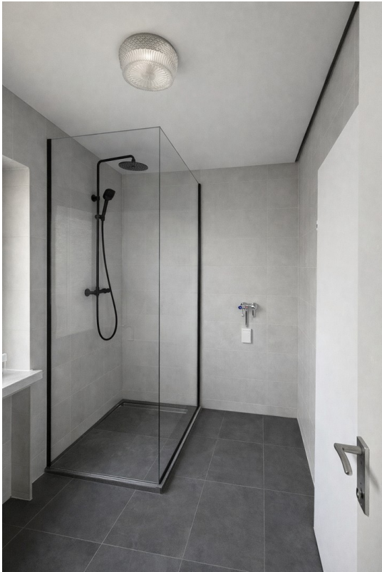
Bad oben (Bsp nach Sanierung)