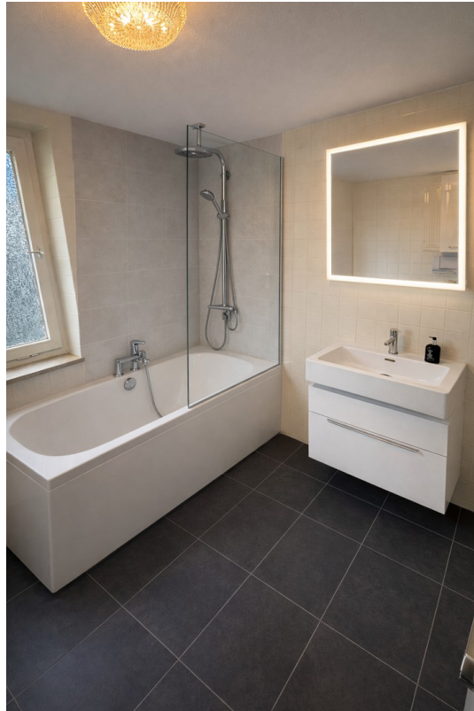
Bad unten (Bsp nach Sanierung)