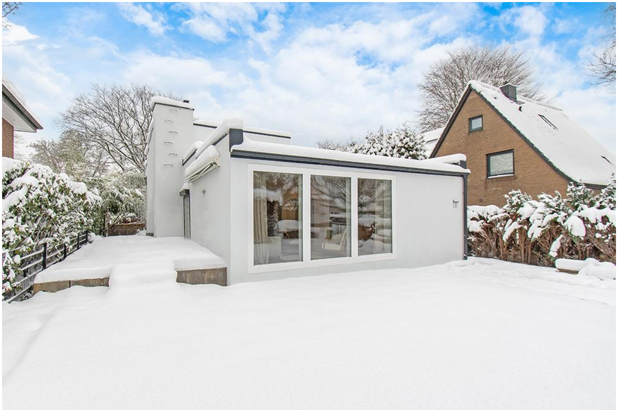
Ihr neues Zuhause!