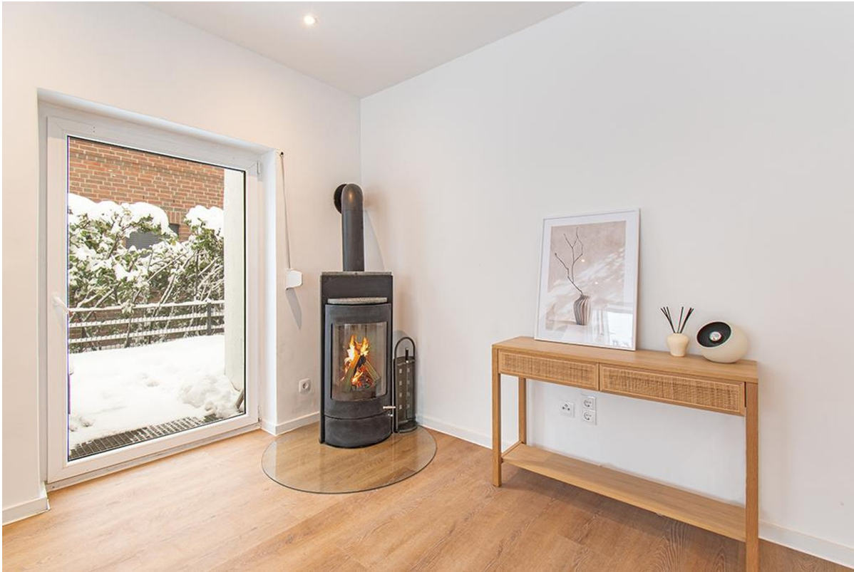
Wohlige Wärme an kalten Tagen