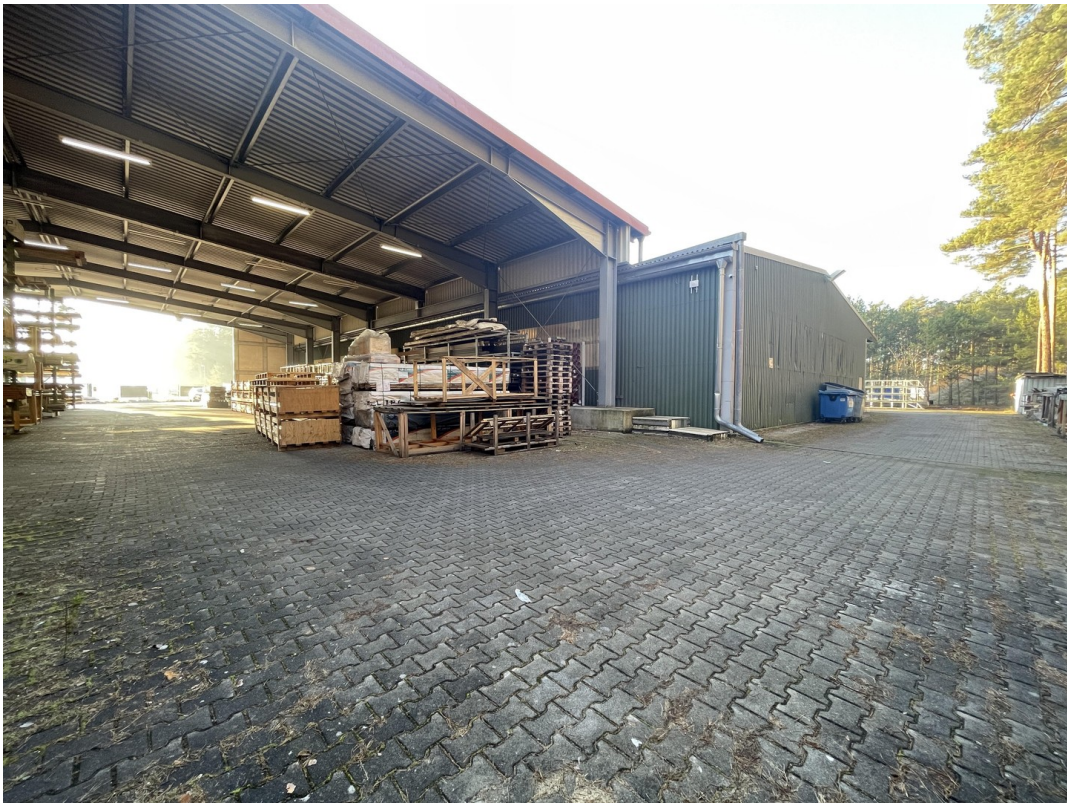
überdachte Lagerfläche B