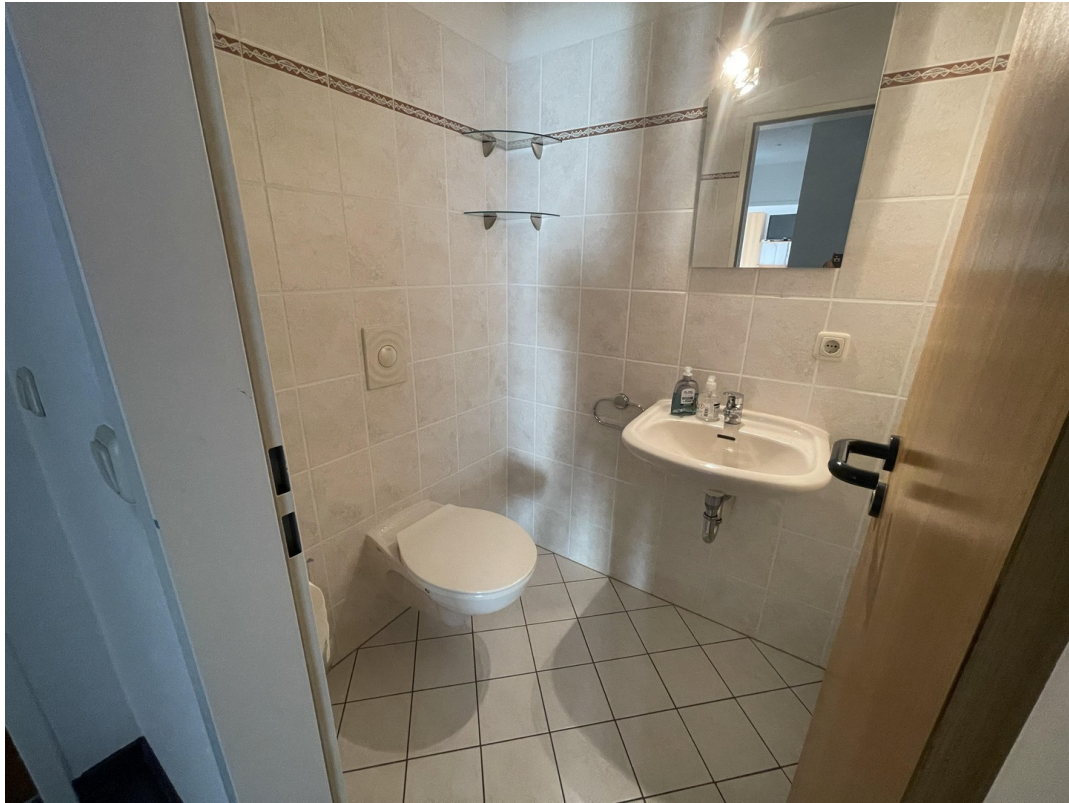
Wohnung 1 (1. OG)