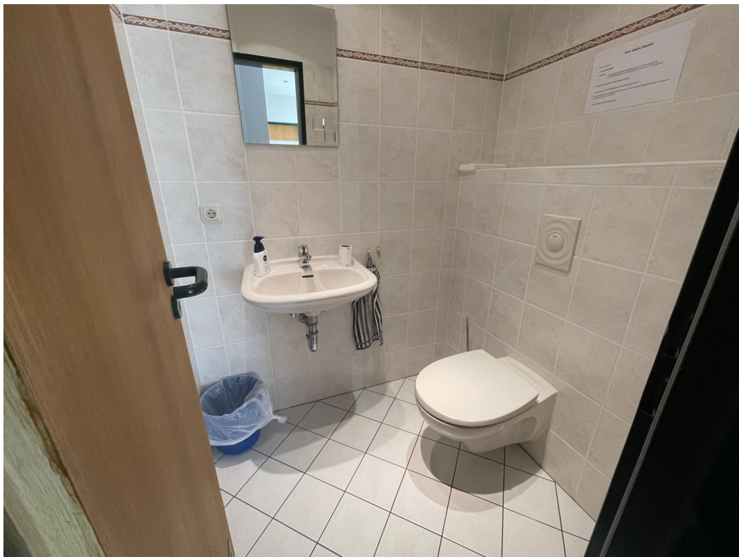
Wohnung 2 (1. OG)