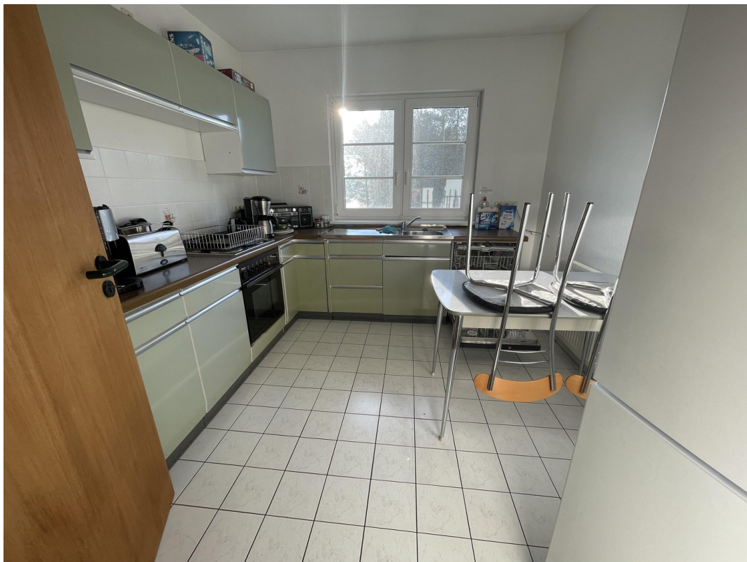
Wohnung 2 (1. OG)