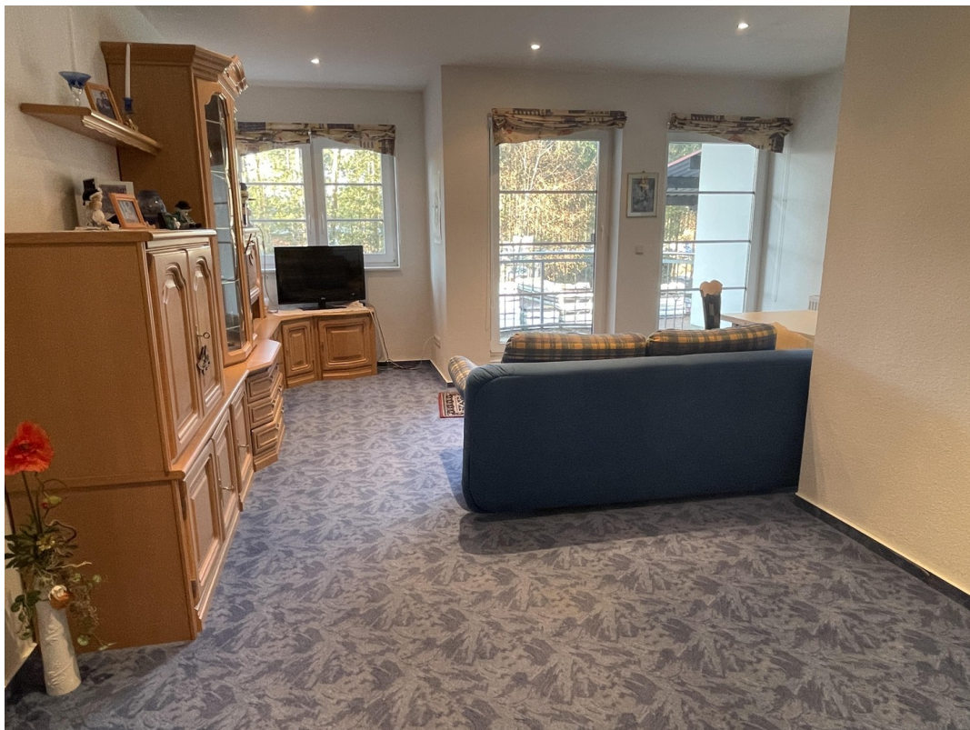
Wohnung 2 (1. OG)