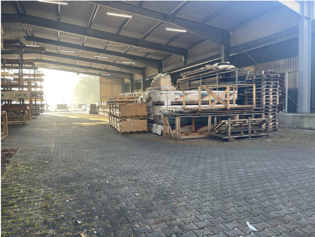
überdachte Lagerfläche A