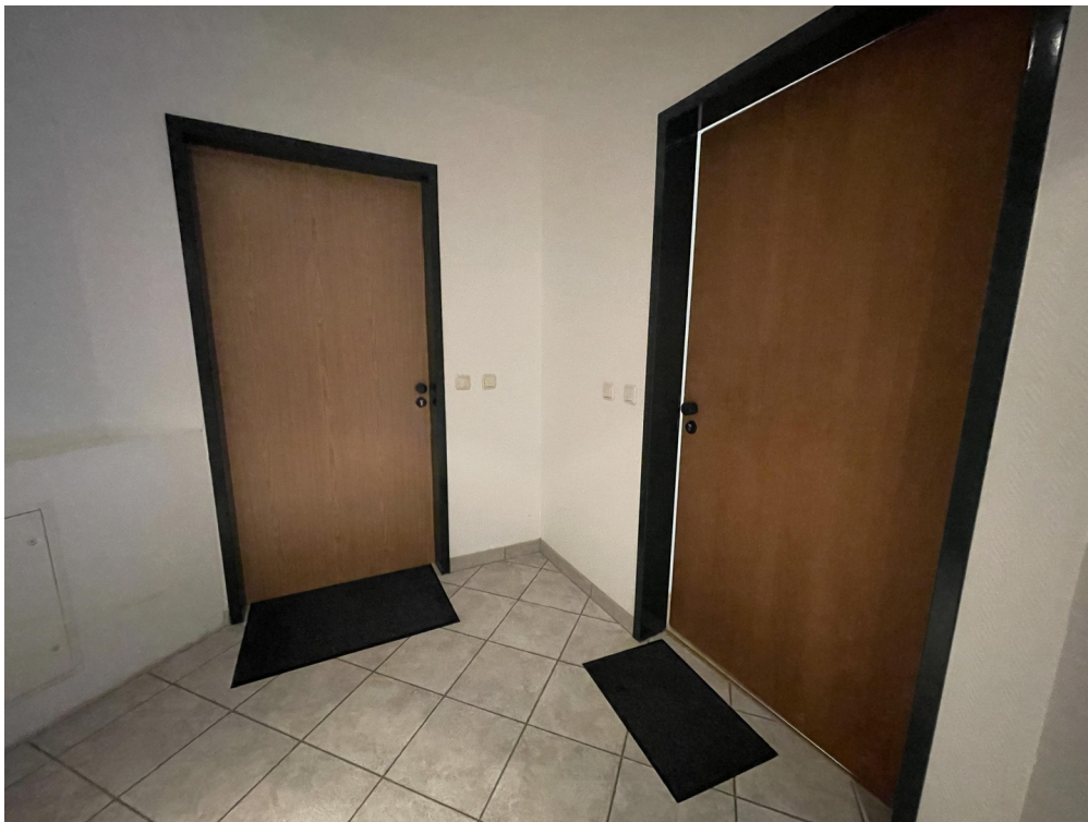
2 Wohnungen (1. OG)