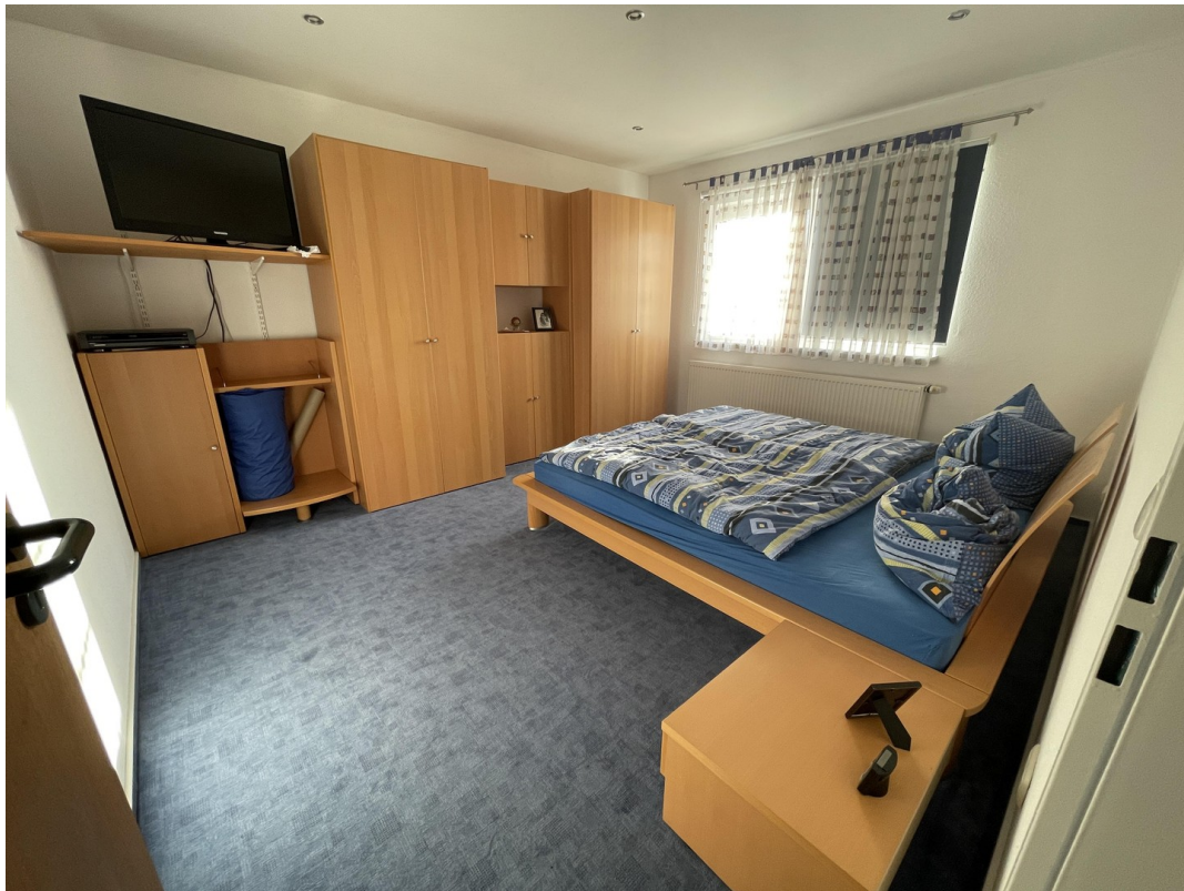
Wohnung 1 (1. OG)