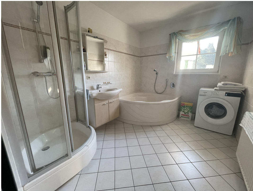
Wohnung 2 (1. OG)