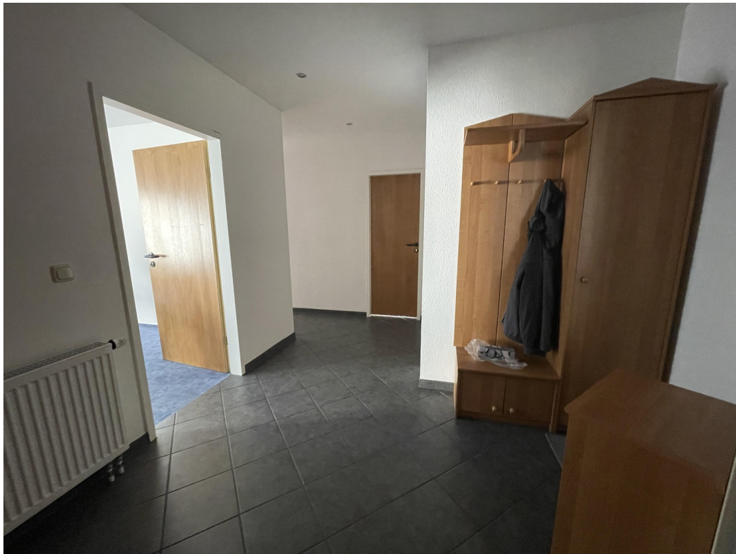
Wohnung 1 (1. OG)