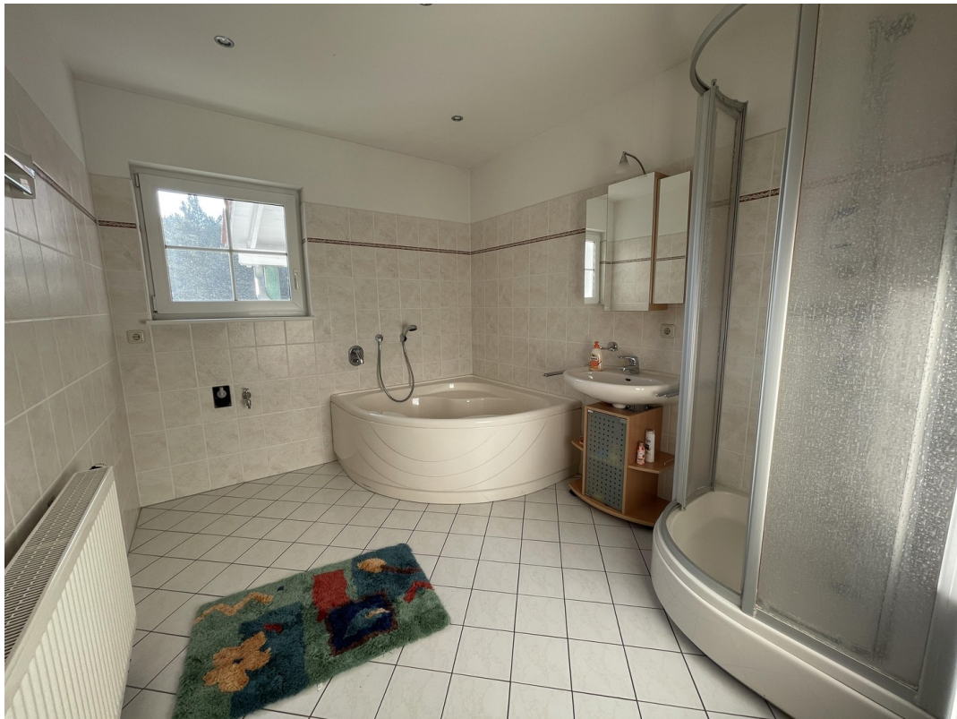
Wohnung 1 (1. OG)