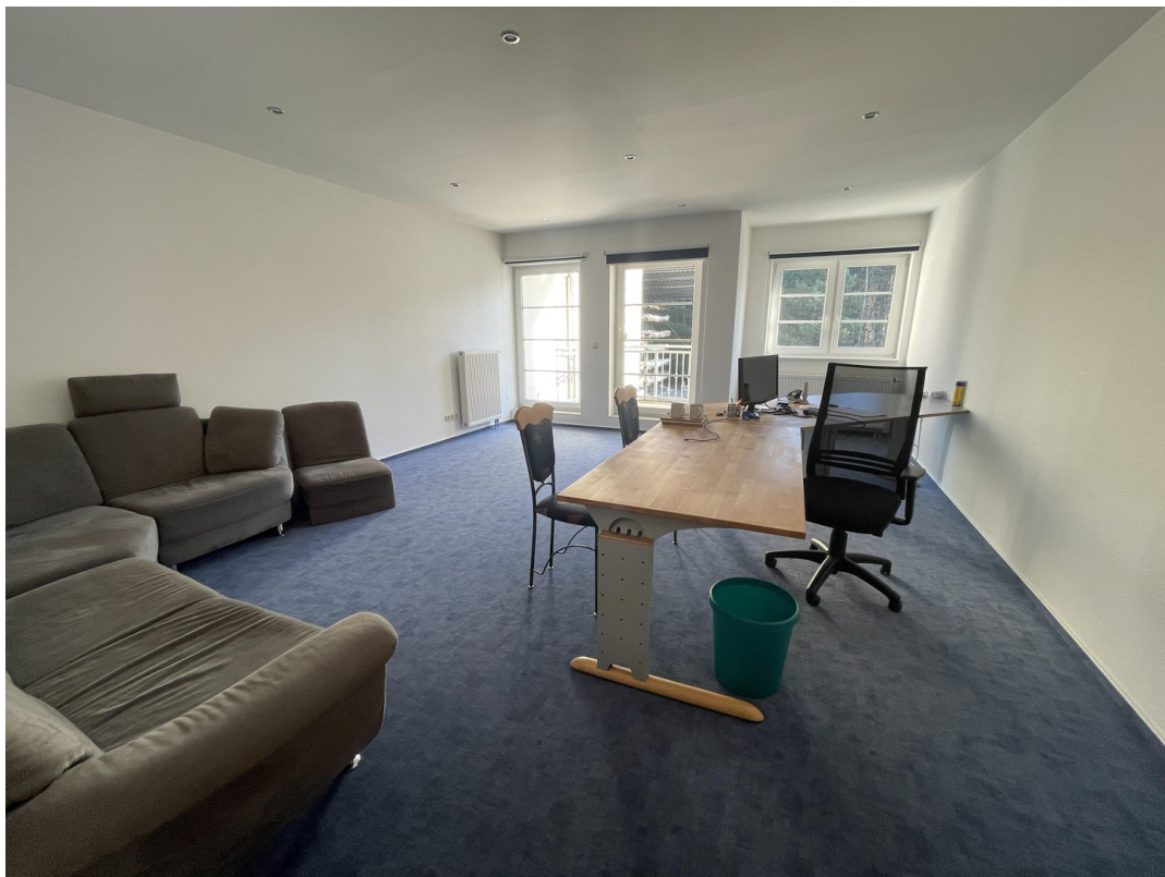
Wohnung 1 (1. OG)