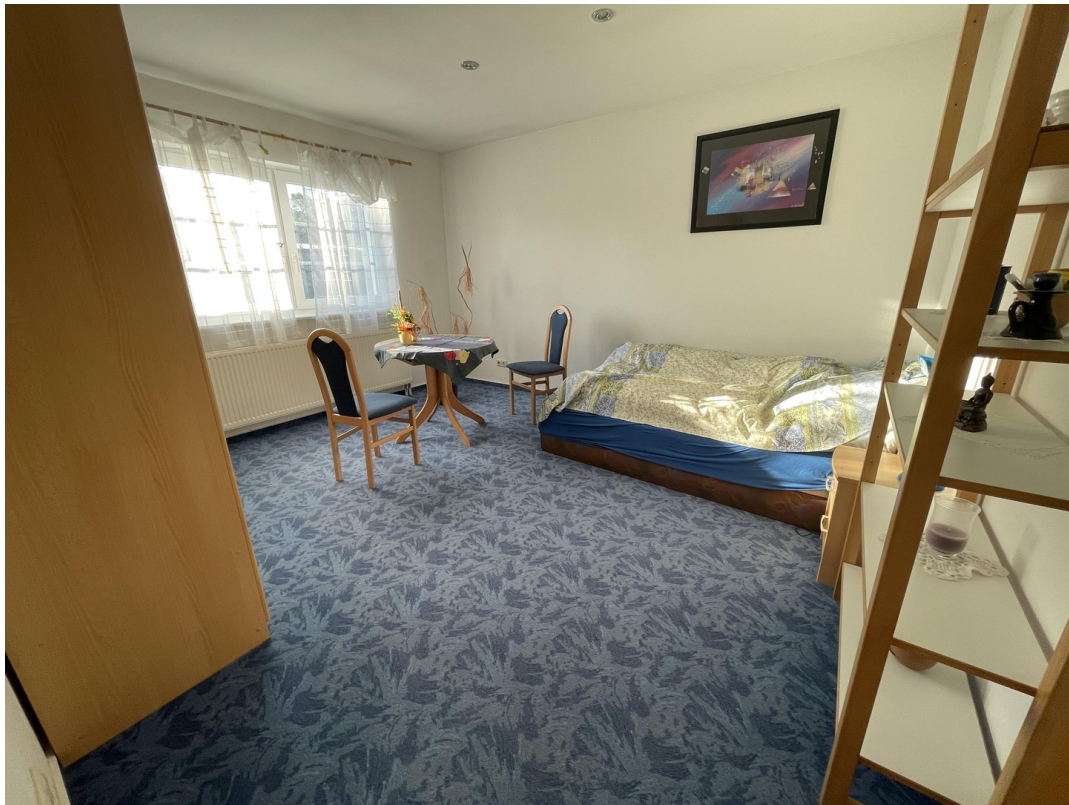
Wohnung 2 (1. OG)