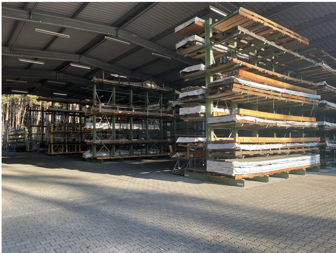
überdachte Lagerfläche C