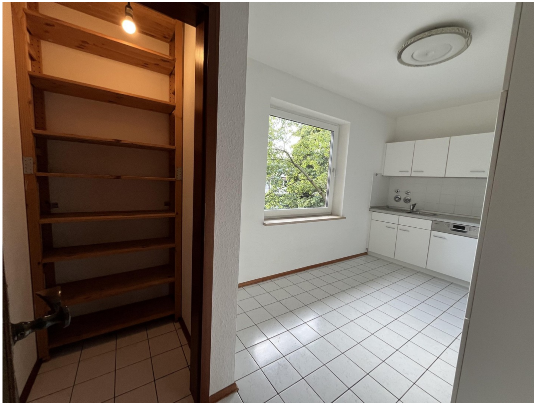
Abstellkammer in der Küche