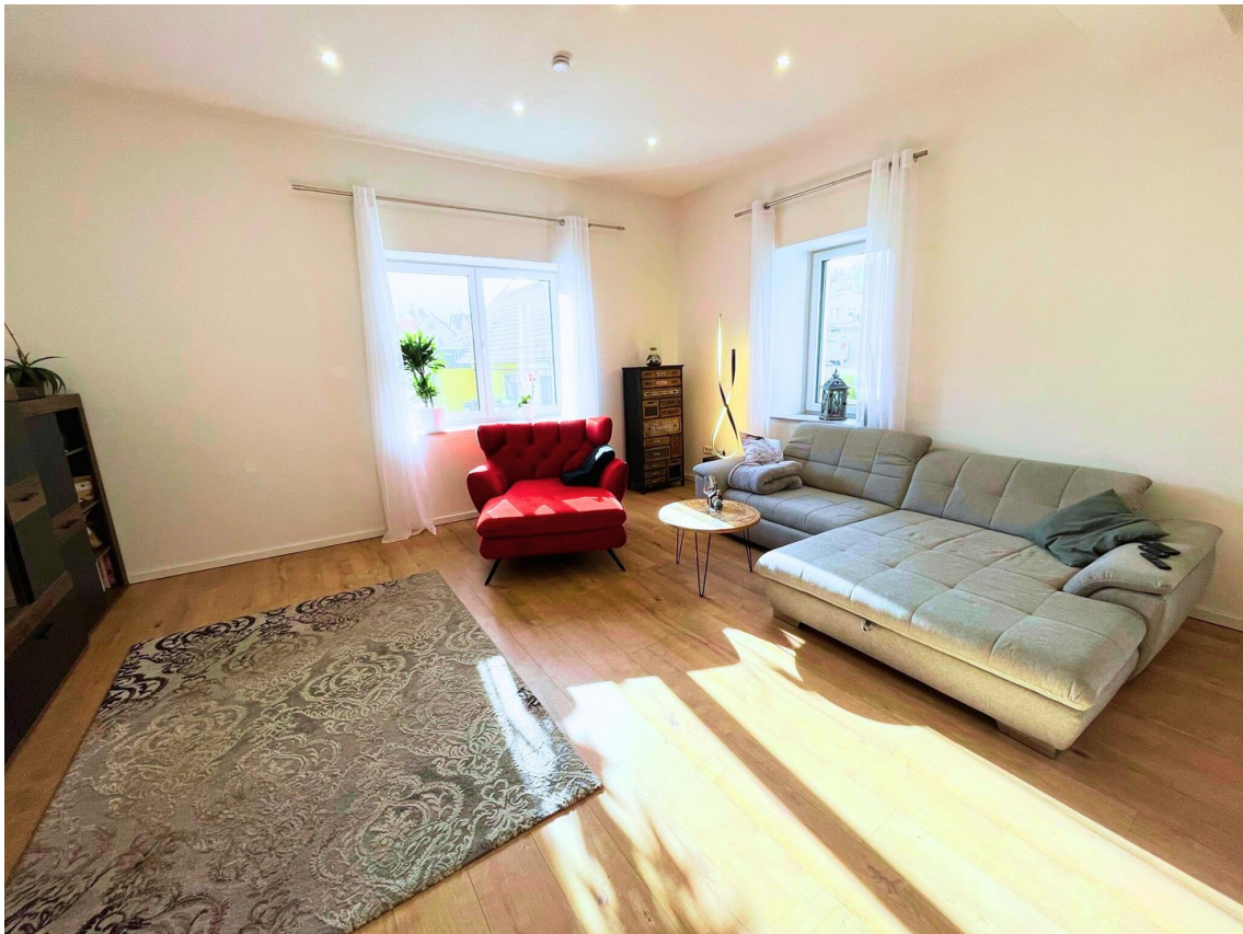
Blick ins Wohnzimmer