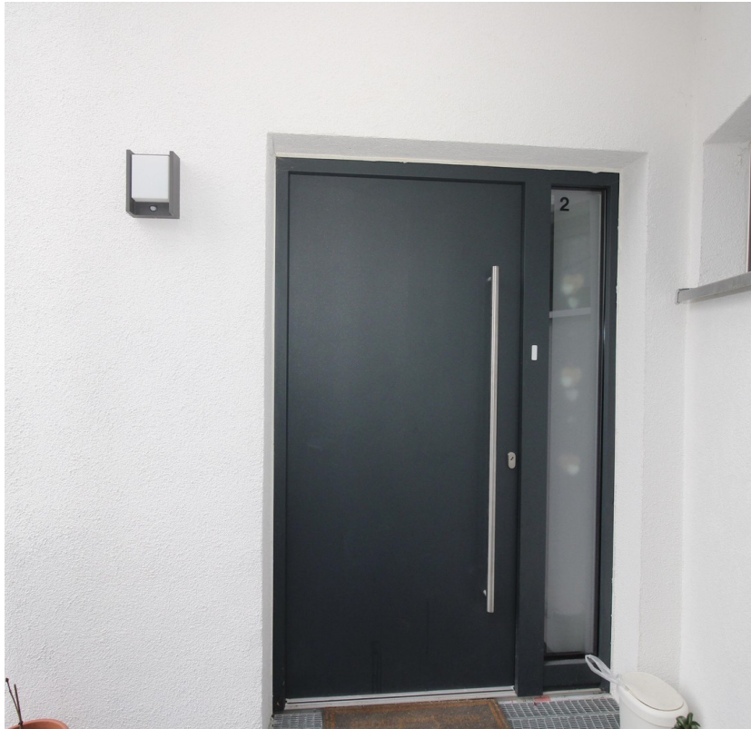
Eigene hochwertige Haustür