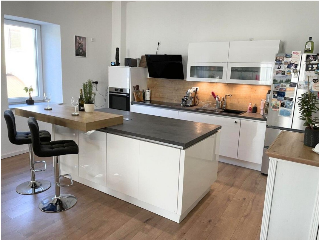
Einbauküche mit Kochinsel