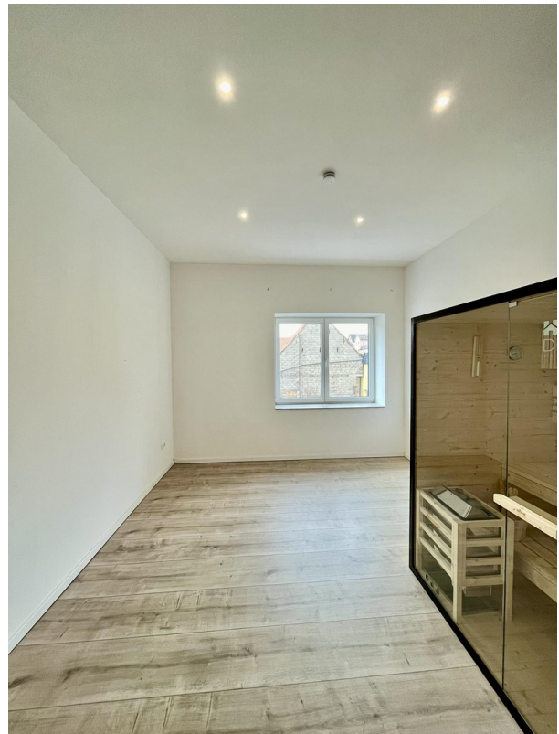
Zimmer 1 mit Sauna