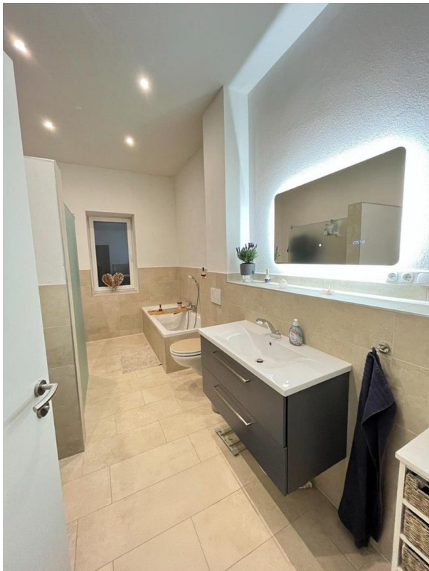
Bad mit begehbare Dusche