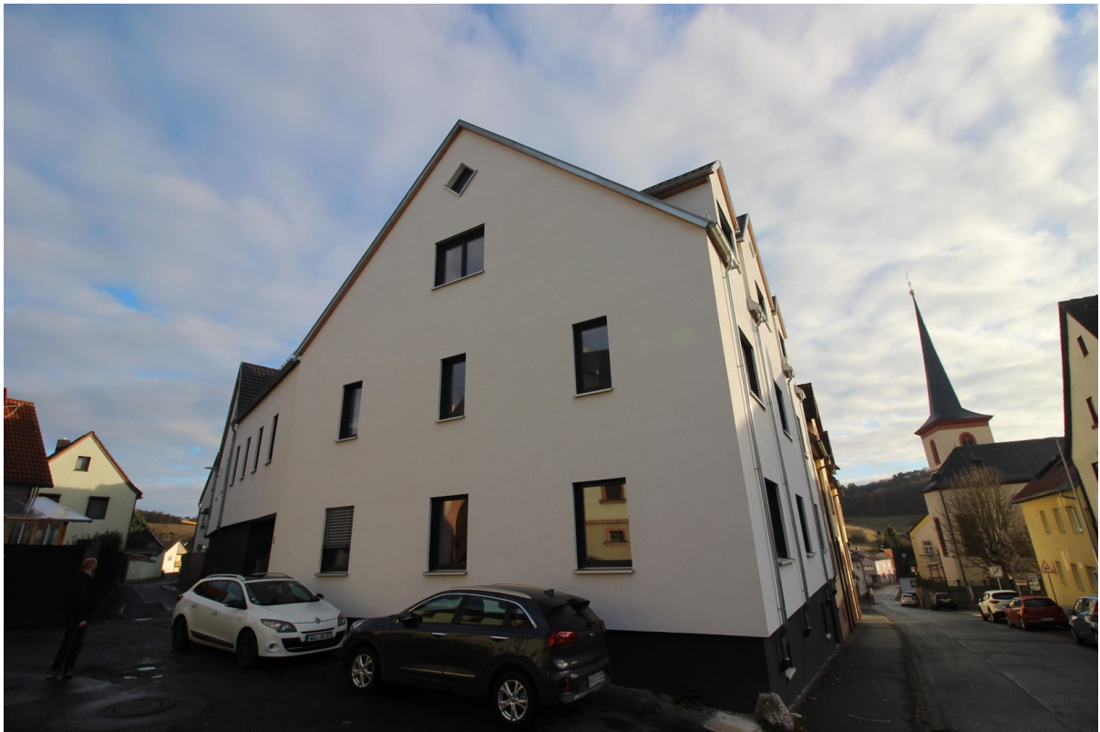
Außenansicht des Hauses