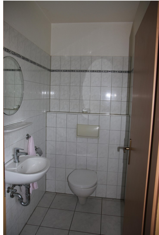
Gäste - WC