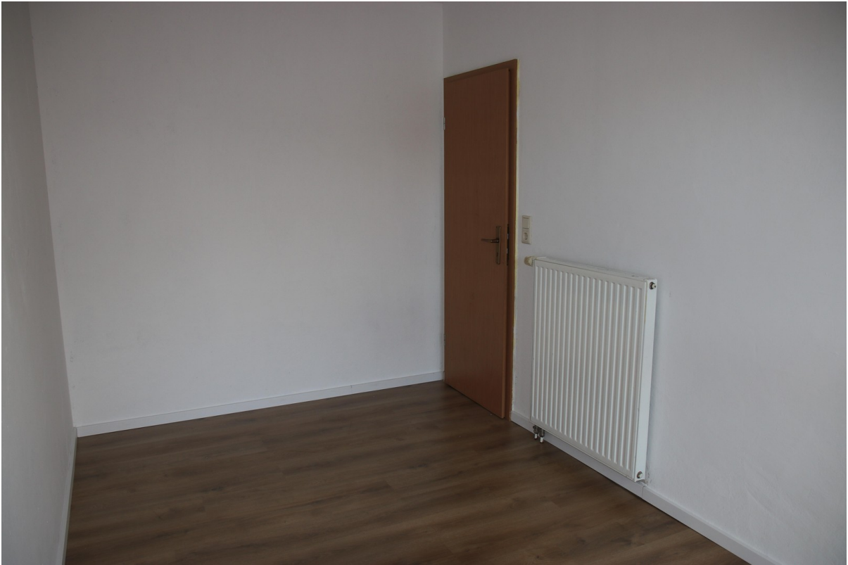
Schlafz. 3 OG 1