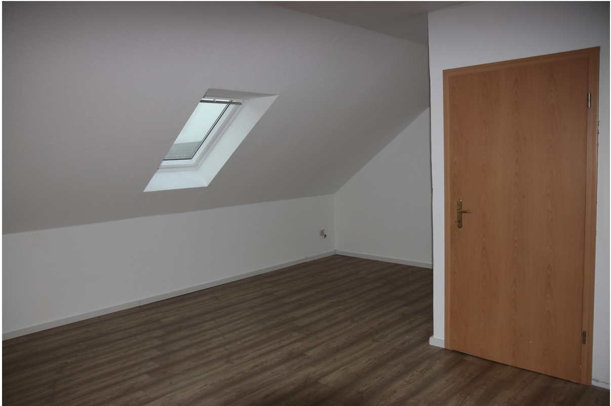
Schlafz.4 OG 2