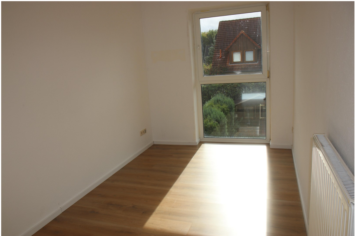
Schlafz.3 OG 1