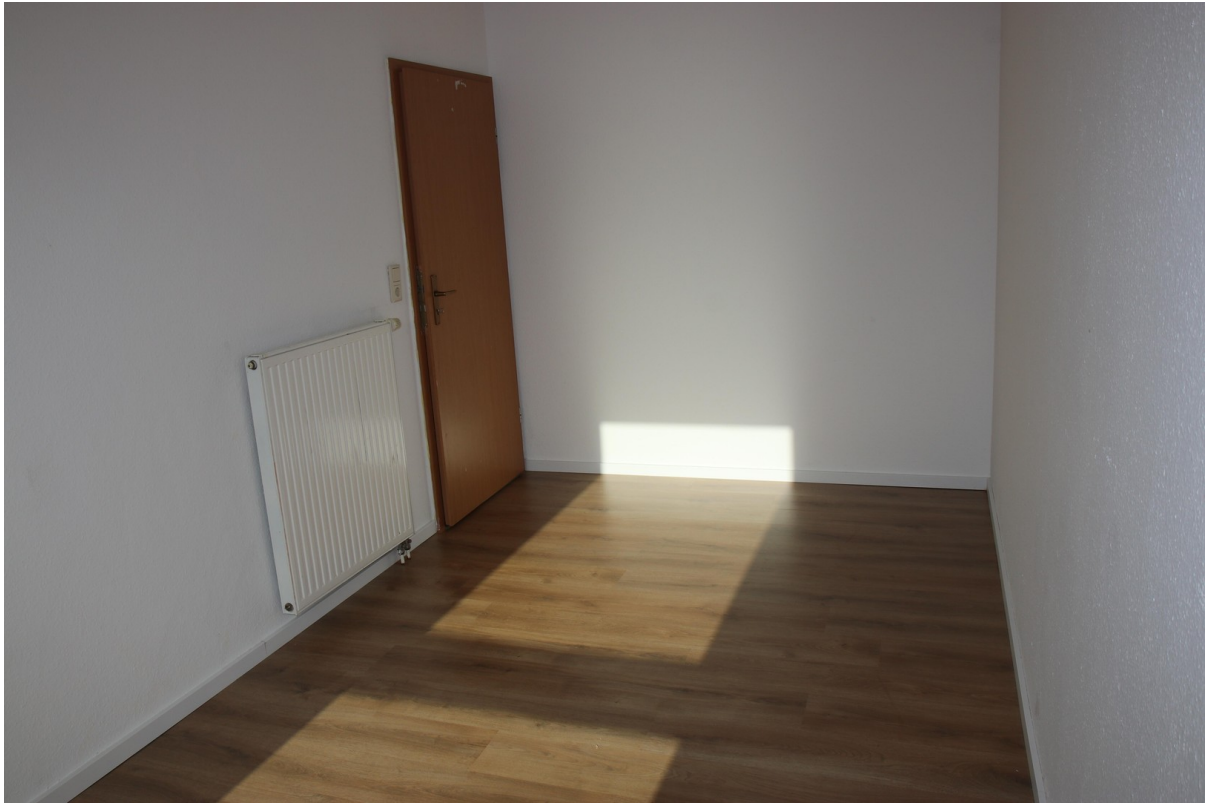
Schlafz. 2 OG 1