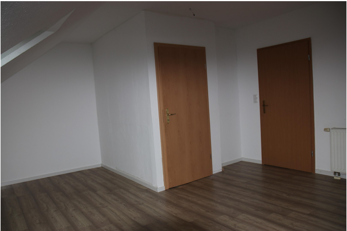
Schlafz. 4 OG 2