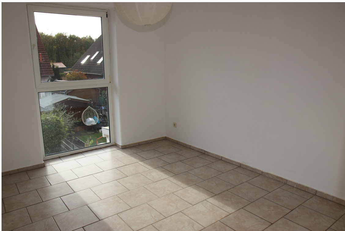
Schlafz. 1 OG 1