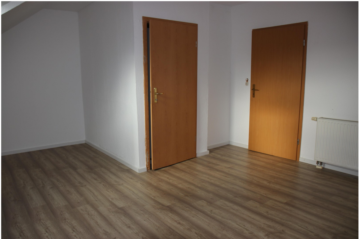
Schlafz.4 OG 2