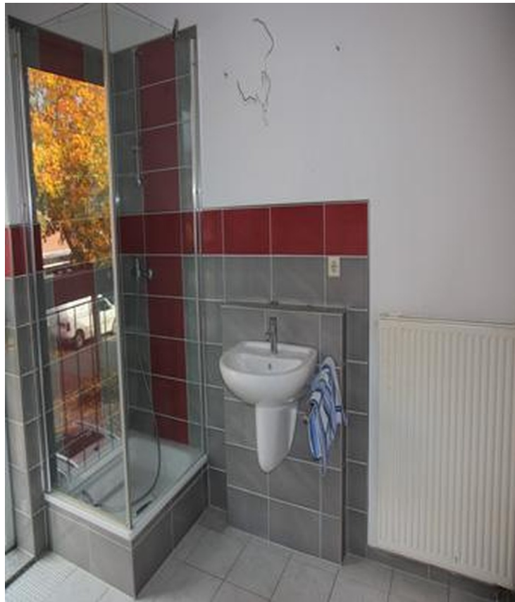
Bad OG 1