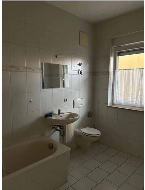
Badezimmer mit Fenster