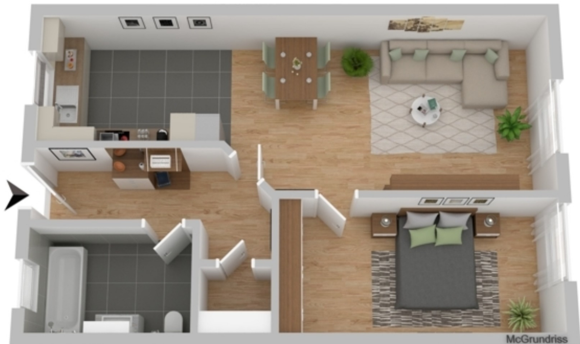
Grundrisse - Vorschlag