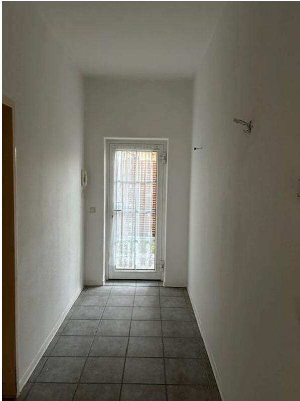
Flur / Eingangsbereich