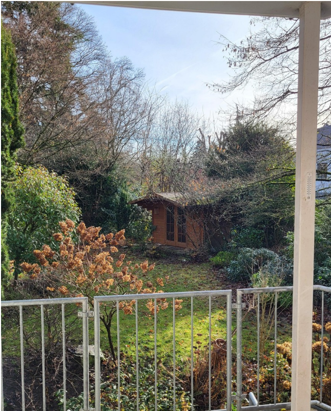
Blick vom Balkon in den Garten