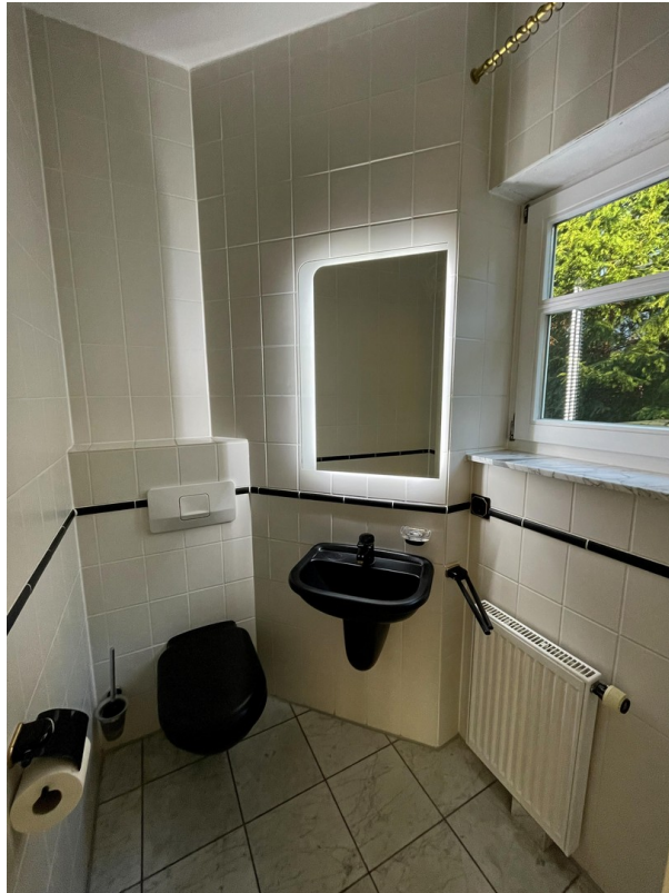
Gäste WC 1. OG