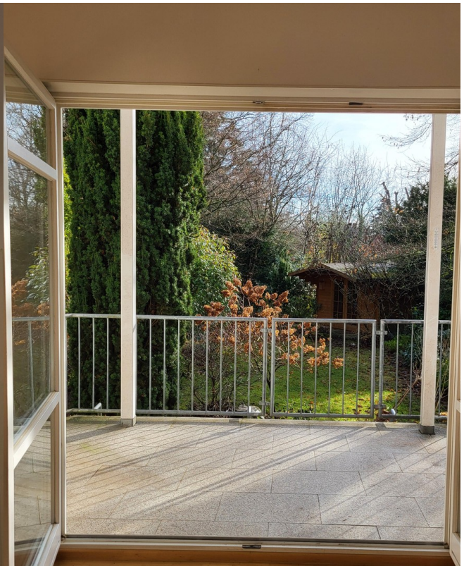
Großer Balkon 1 OG