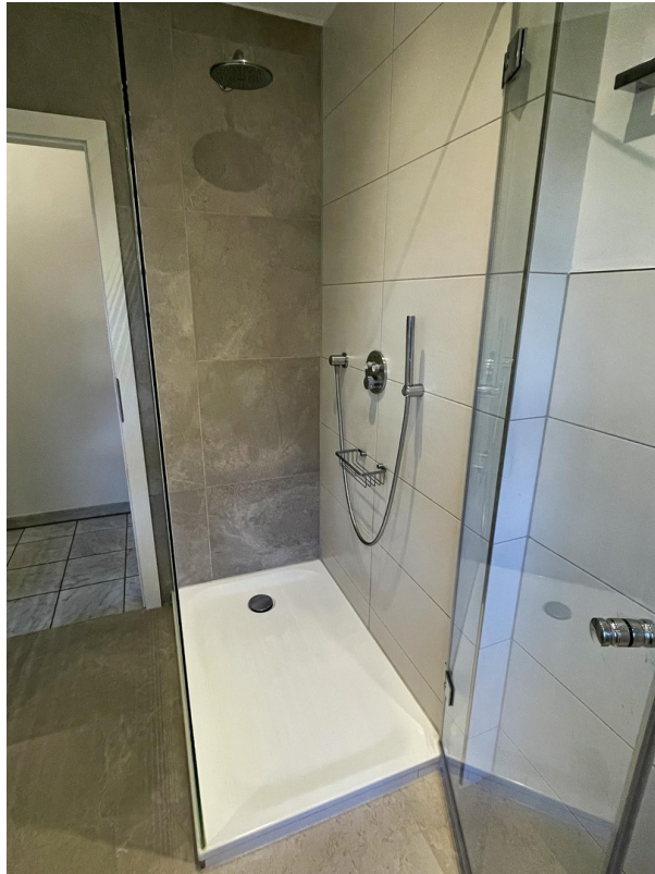
Bad mit großer Dusche