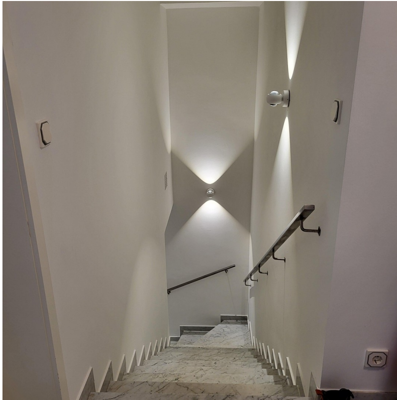
Treppe zum Erdgeschoss