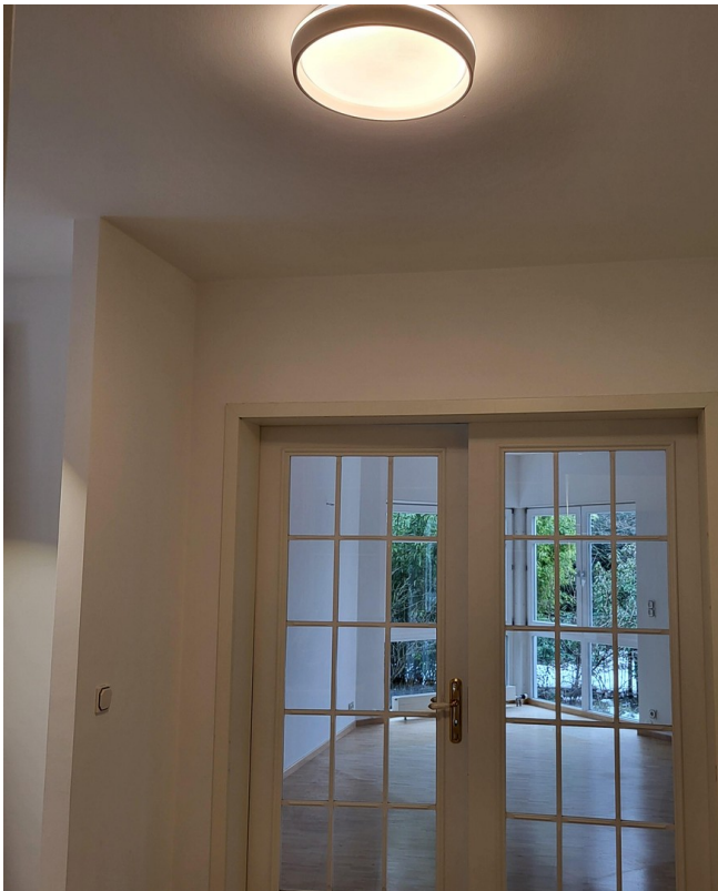
Eingang Wohnzimmer vom Flur