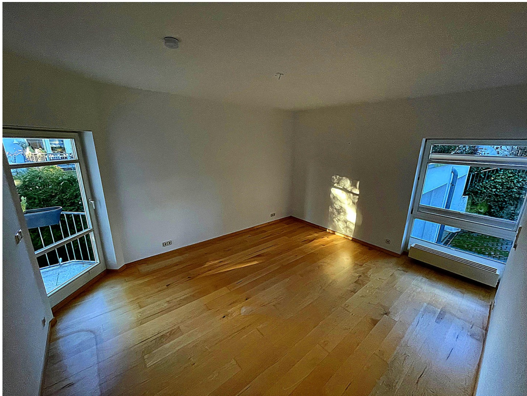
Schlafzimmer 1. OG