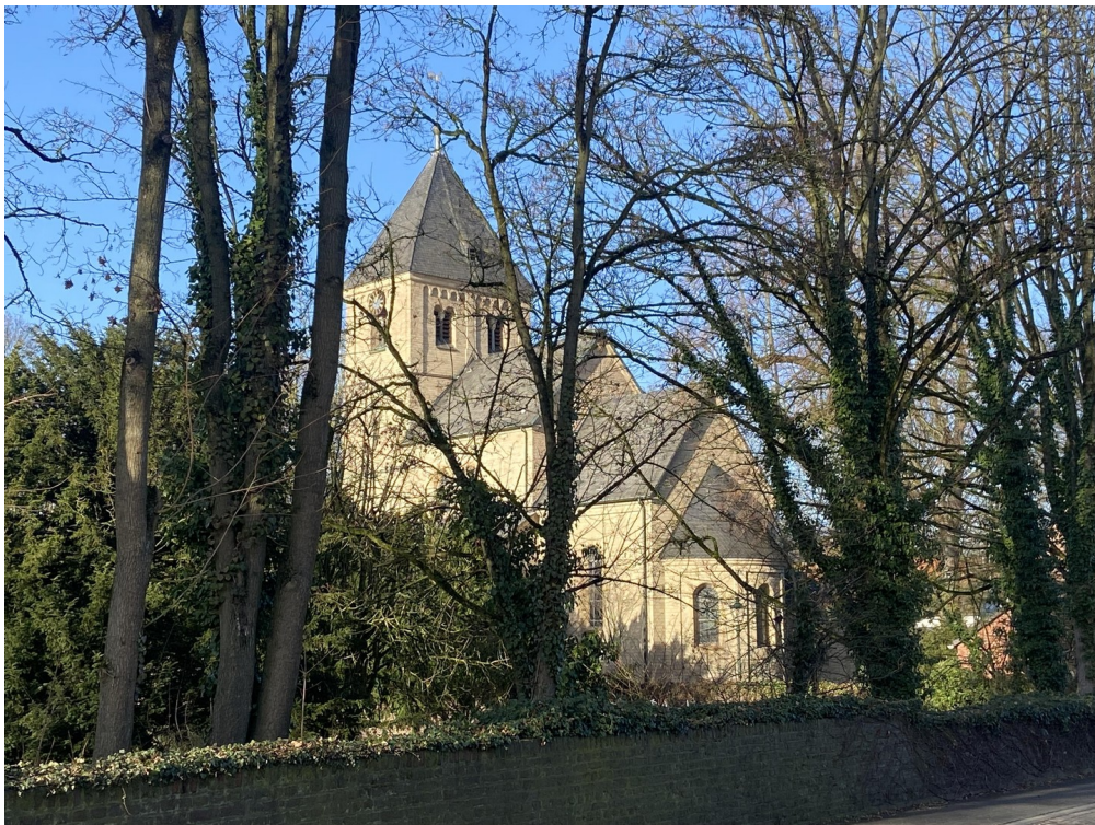
St. Lambertus Kalkum