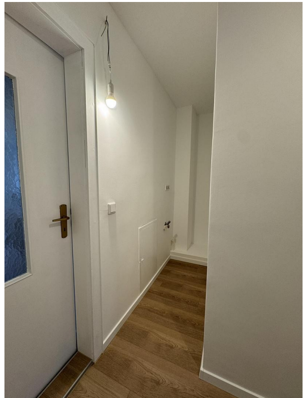
Nische für Waschmaschine