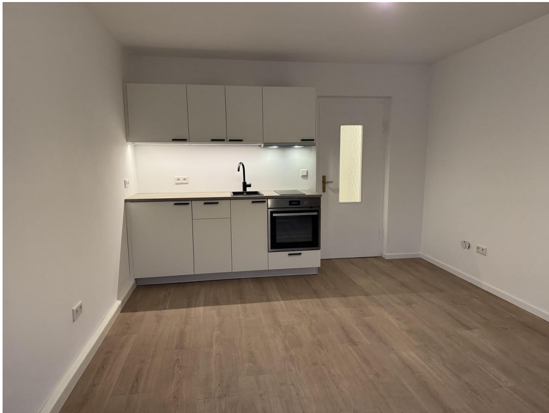
Wohnzimmer mit neuer Küche