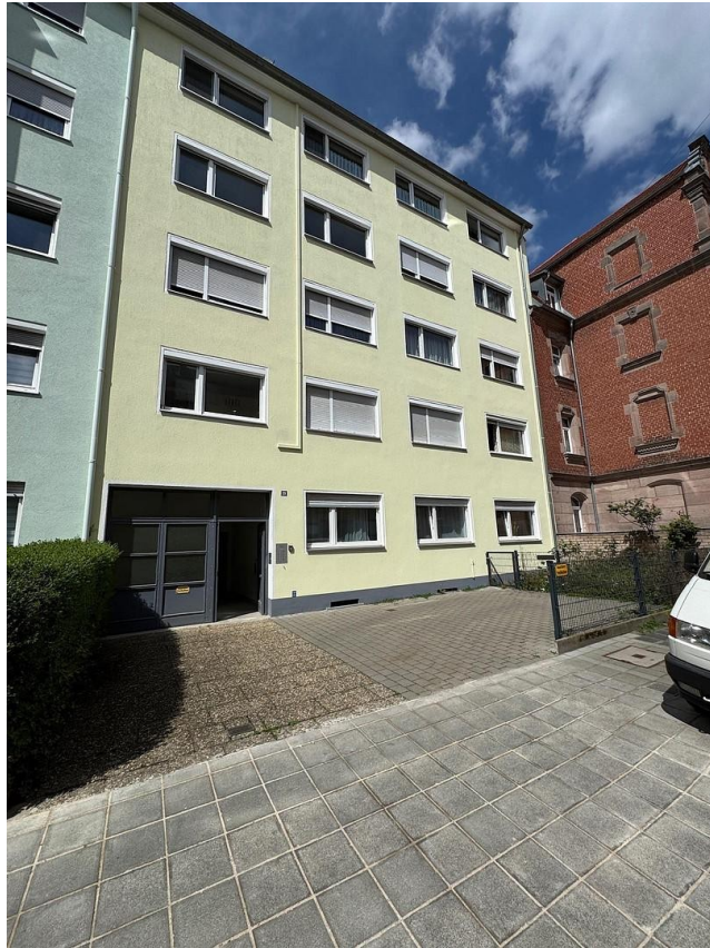
Haus Ansicht Außen