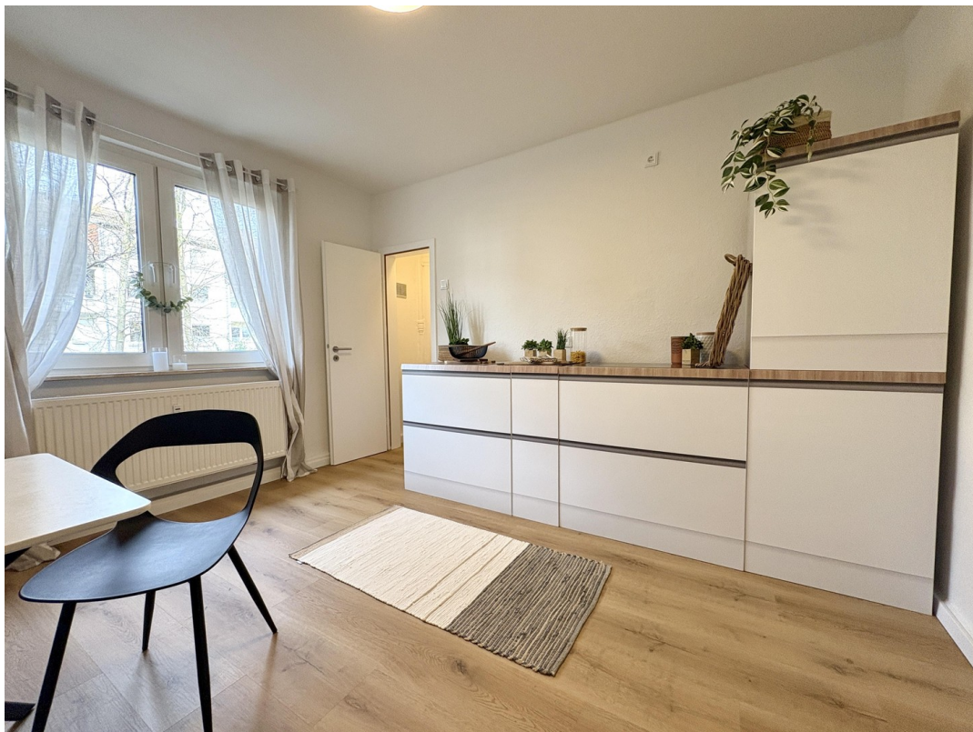
Küche + Abstellkammer