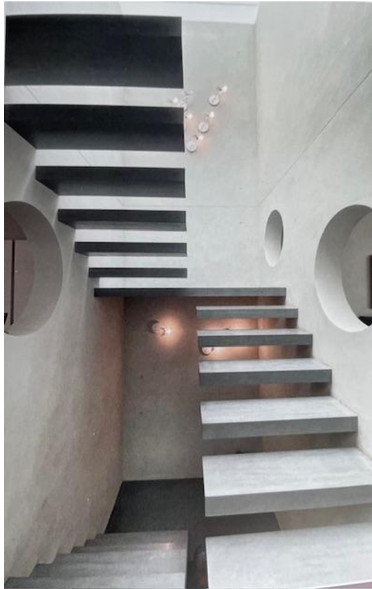
traumhafte skulpturale Treppe