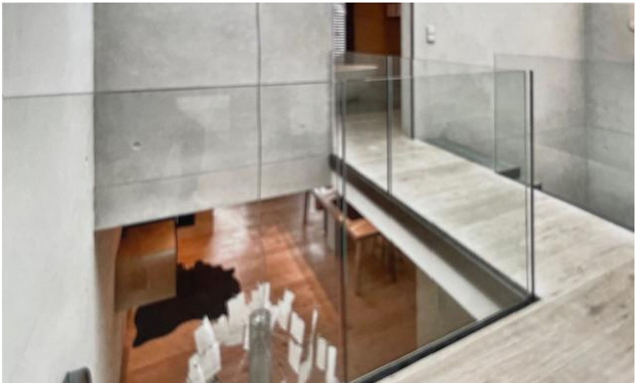
offene Galerie im 1. OG