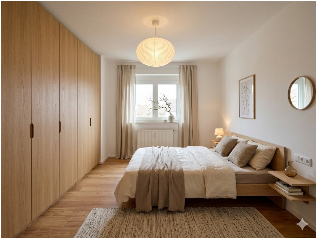
Schlafzimmer 2 Visualisierung