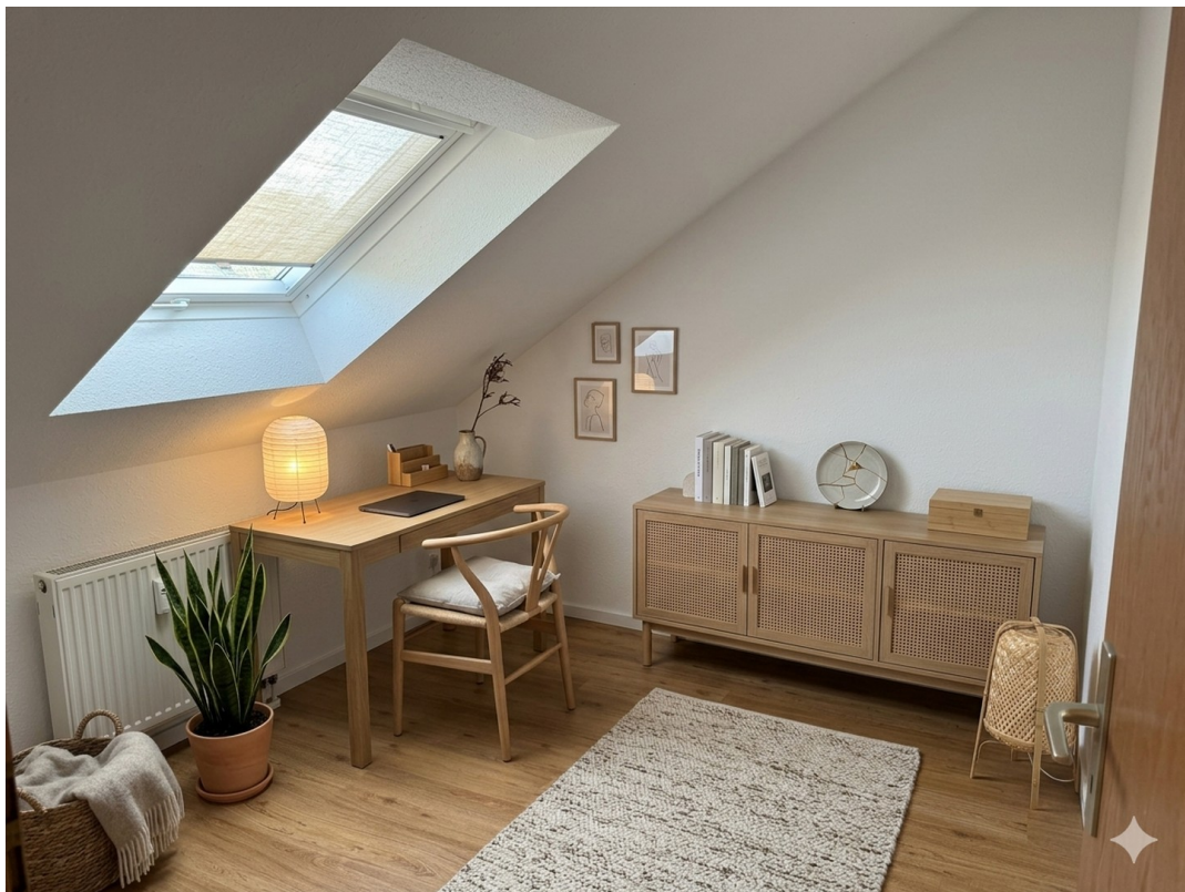
Arbeitszimmer 2 Visualisierung