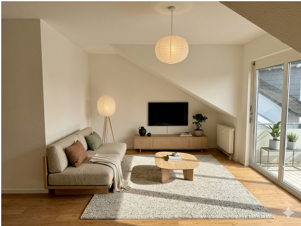
Wohnzimmer 3 Visualisierung