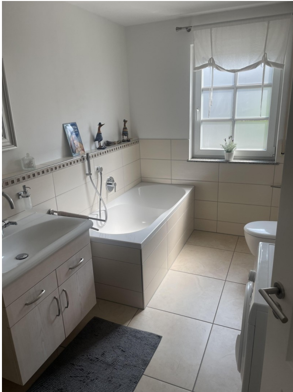
Bad Blick zur Wanne