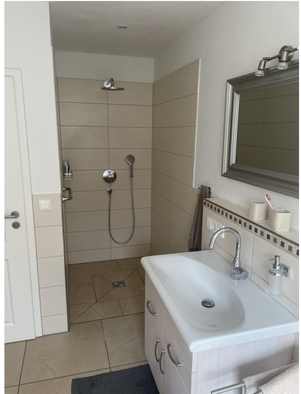
Bad Blick zur Dusche