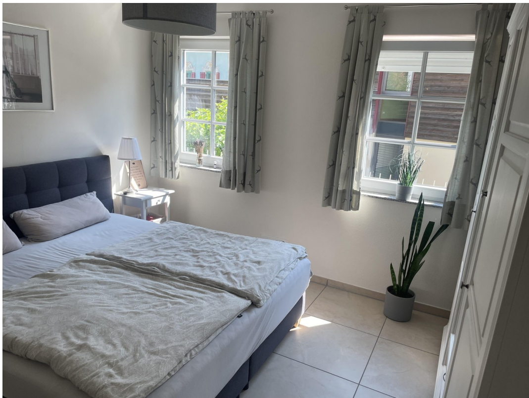
Schlafzimmer Ansicht 1