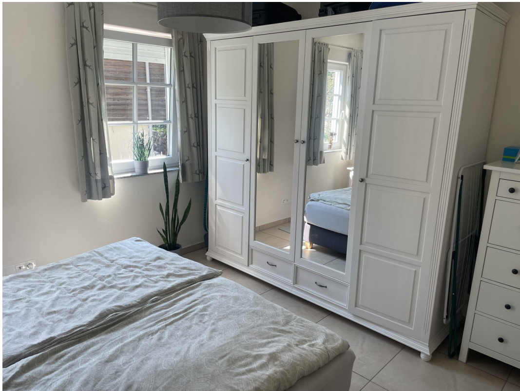
Schlafzimmer Ansicht 2