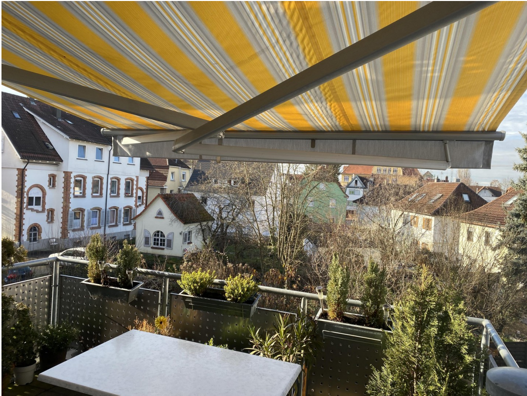
Balkon - elektrischer Markise