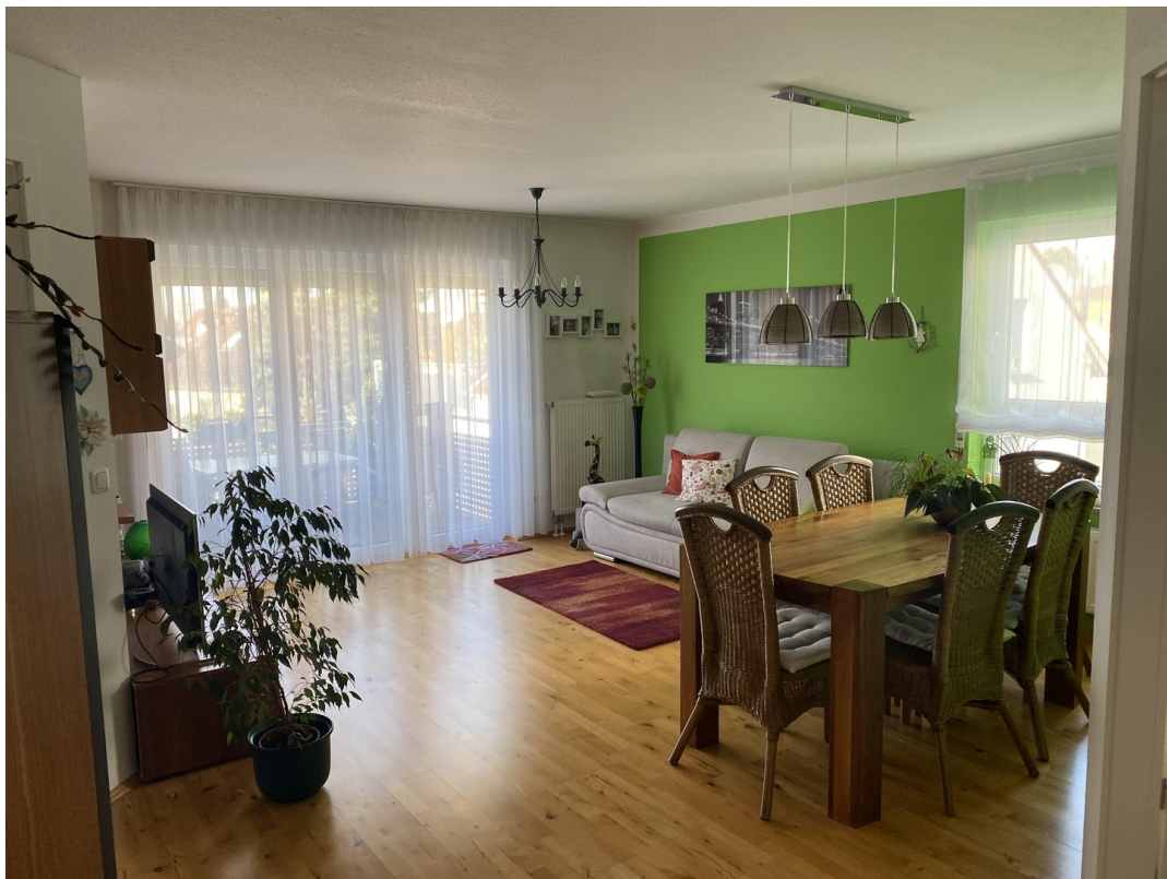
Helles Wohnzimmer mit großem F