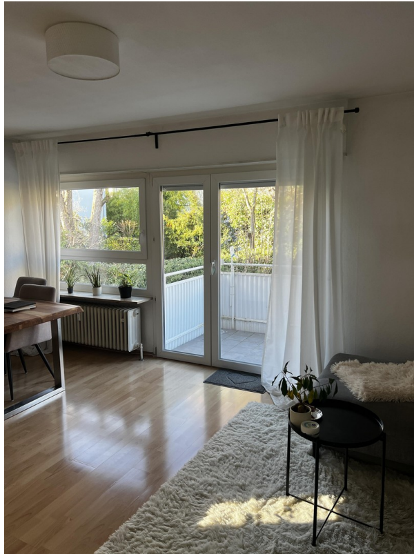
Wohnzimmer mit Balkon Zugang